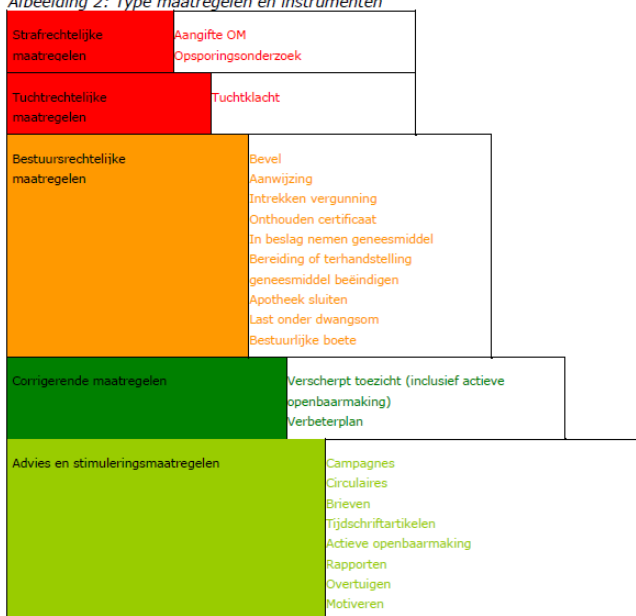
Afbeelding 2: Type maatregelen en instrumenten

De inspectie onderscheidt een viertal typen van maatregelen met bijbehorende instrumenten. Vaak gaat al een traject van afspraken vooraf aan het opleggen van maatregelen. De vier typen maatregelen zijn weergegeven in afbeelding 2: