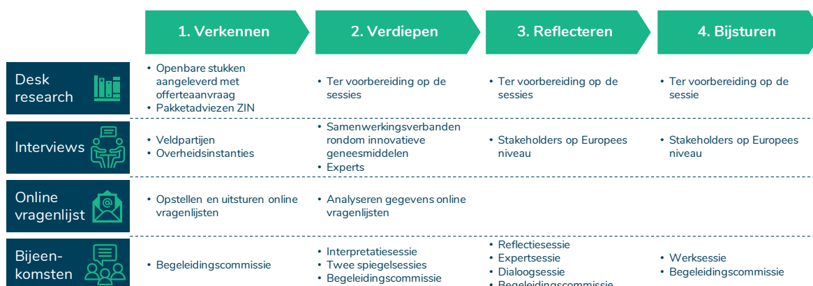
Figuur 2 Het evaluatierapport is gebaseerd op resultaten vanuit desk research, interviews, online vragenlijsten en bijeenkomsten