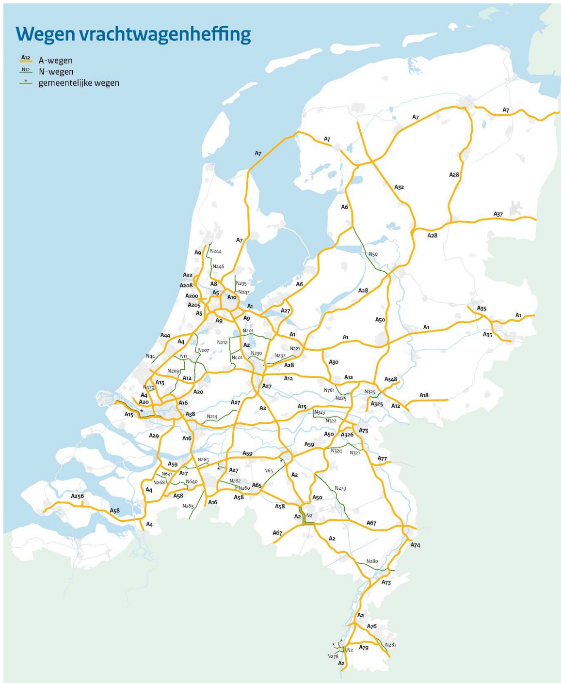
Figuur 2: Heffingsnetwerk van Nederland