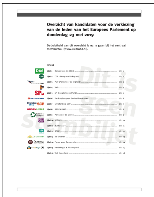
Afbeelding overzicht kandidaten voor kiezers in buitenland

De kiezers ontvangen bij het stembiljet ook een overzicht van kandidaten. Op dat overzicht kan de kiezer de kandidaten vinden die voorkomen op de lijsten die meedoen aan de verkiezing. Ook is het overzicht van kandidaten digitaal voor de kiezers beschikbaar.