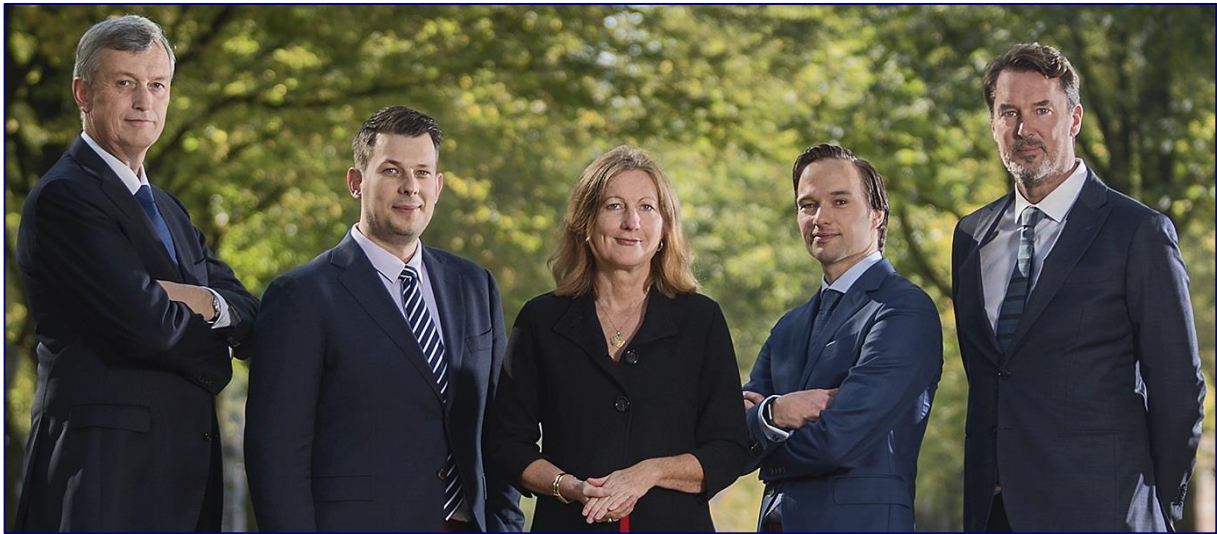
Afbeelding 2 - Samenstelling van de Toetsingscommissie Inzet Bevoegdheden

De Toetsingscommissie Inzet Bevoegdheden bestaat uit drie leden. Eén van de commissieleden is voorzitter. Ten minste twee van de drie leden moeten een achtergrond als rechter hebben. Het derde lid hoeft geen rechtelijke achtergrond te hebben, maar kan benoemd worden op grond van technische deskundigheid. Dat is thans het geval. De commissie wordt ondersteund door een secretariaat.