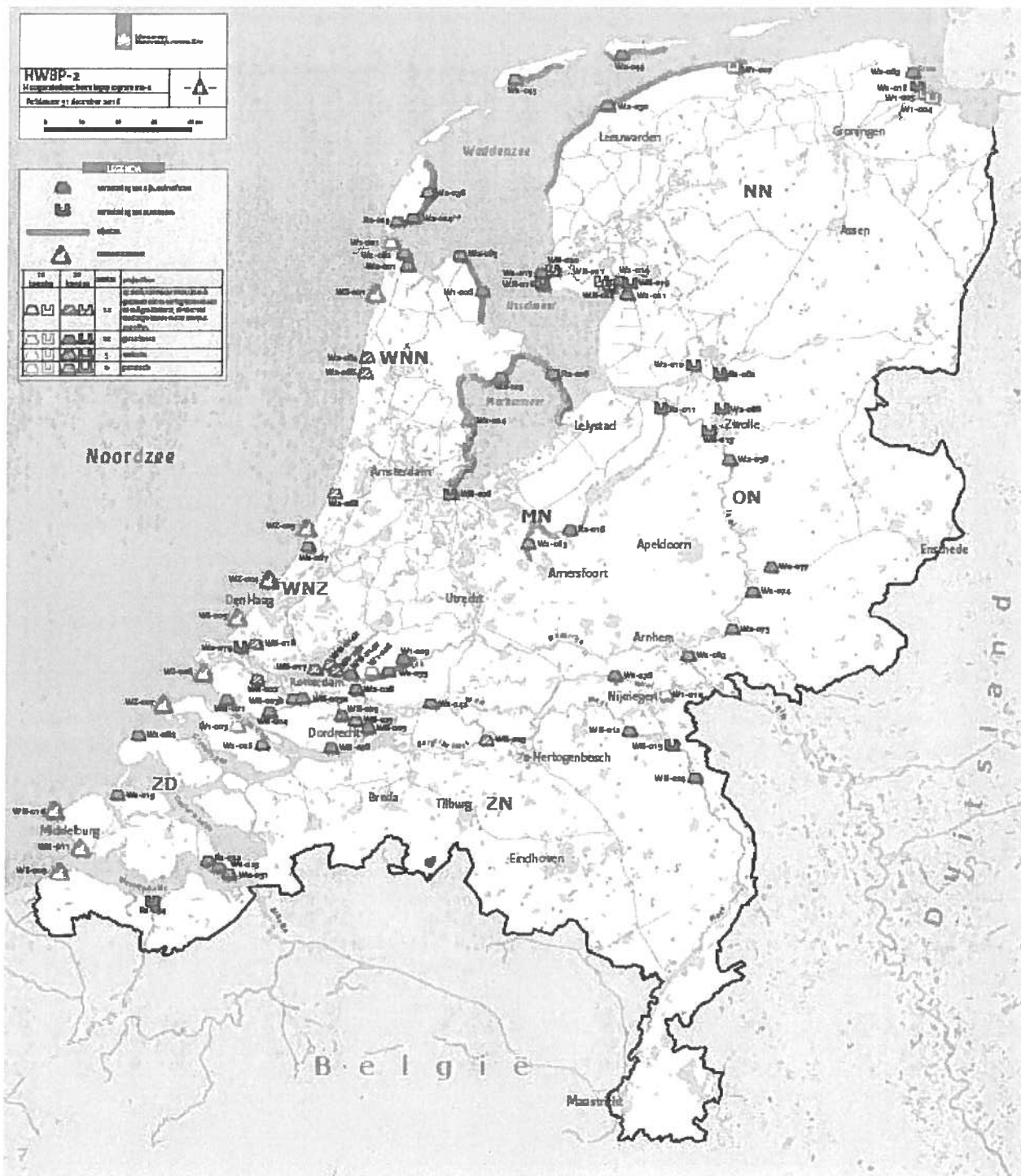
Figuur 2 Actuele scope van het programma, peildatum 31 december 2018