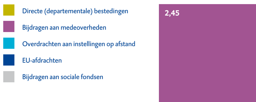
Figuur 1 Uitgaven provinciefonds in 2018