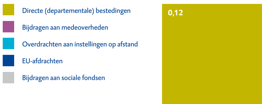
Figuur 1 Uitgaven Overige Hoge Colleges van Staat in 2018