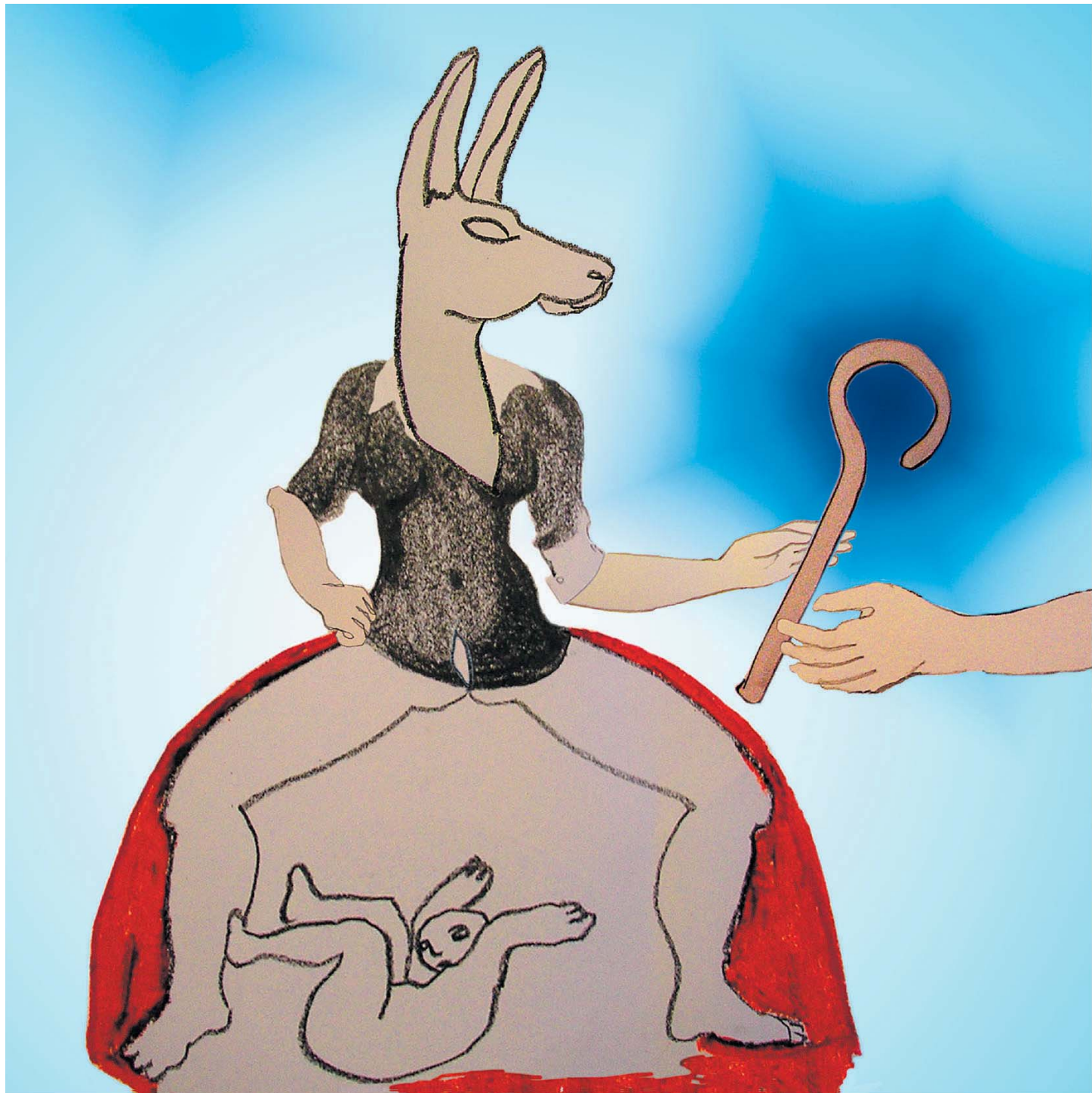
ILLUSTRATIE IRIS KIEWIET

De huidige generatie hoogopgeleide vrouwen zadelt de komende generatie vrouwen op met een gemankeerd zelfbeeld, namelijk dat voor hen geen