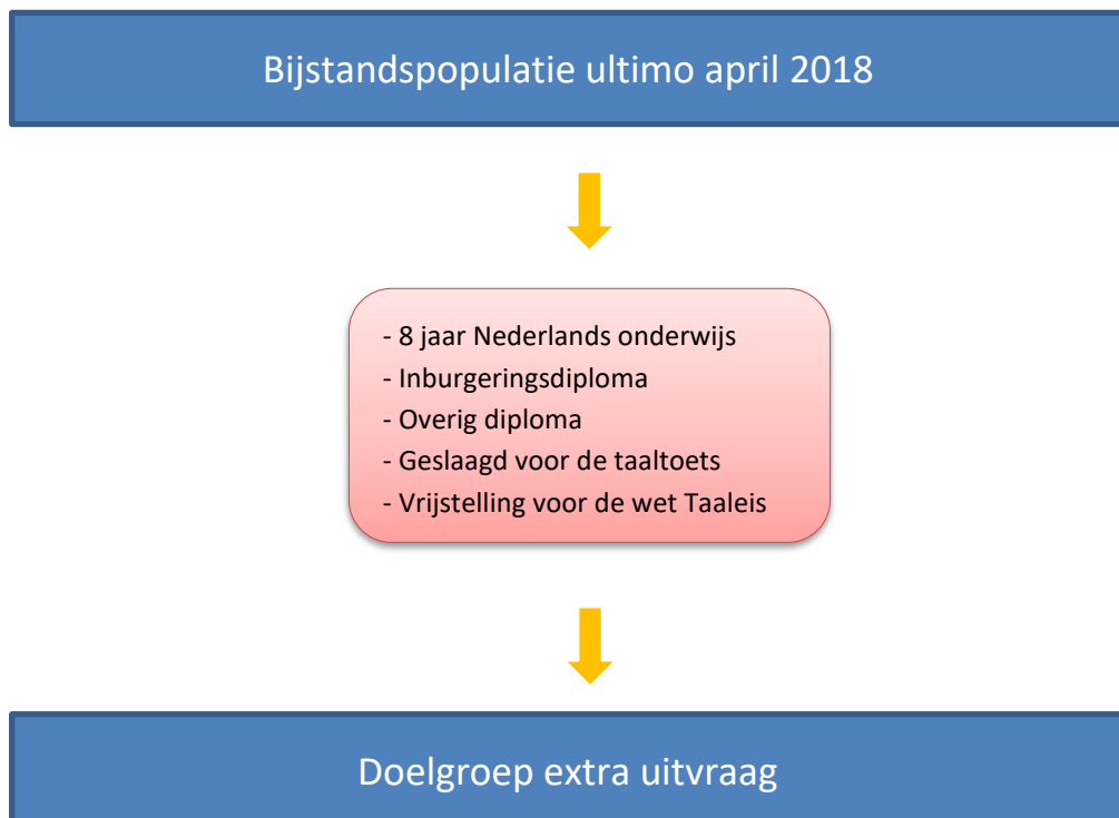
Figuur 2.1. Afbakening doelgroep

Indien gemeenten niet in staat waren om de omvang van de doelgroep ultimo april 2018 vast te stellen, hadden zij de mogelijkheid om zelf een ander peilmoment te kiezen en aan te geven welk moment dat is.