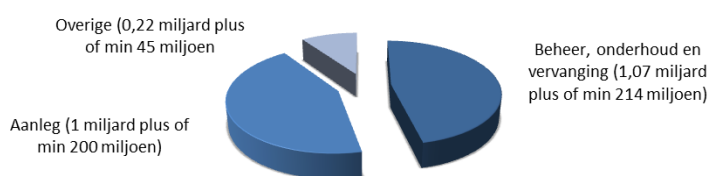
Figuur 3. Verdeling uitgaven en ontvangsten Openbaar Vervoer en Spoor (€ 2,14 miljard in 2022) en effecten 20% besparing/intensivering € 450 miljoen

De totale uitgaven en ontvangsten voor Openbaar Vervoer en Spoor worden voor 99% bepaald door de uitgaven en ontvangsten van de artikelen 13 en 17 van het Infrastructuurfonds, waardoor het voor de hand ligt om de besparingen vooral binnen het Infrastructuurfonds te zoeken. Binnen het Infrastructuurfonds worden de middelen vervolgens besteed aan twee grote posten: Beheer, onderhoud en vervanging (€ 1,07 miljard gemiddeld per jaar) en Aanleg (€ 1 miljard gemiddeld per jaar). De uitgaven voor het Beheer, onderhoud en vervanging maken 47% uit van de totale uitgaven en ontvangsten aan spoor. 44% van de uitgaven bestaat uit middelen die voor aanleg zijn bestemd. In Figuur 3 is de verdeling van de uitgaven en ontvangsten schematisch weergegeven. Tot slot zijn er besparingen (en intensiveringen) mogelijk op beleidsartikel 16 (uitgaven gemiddeld per jaar € 15 miljoen).