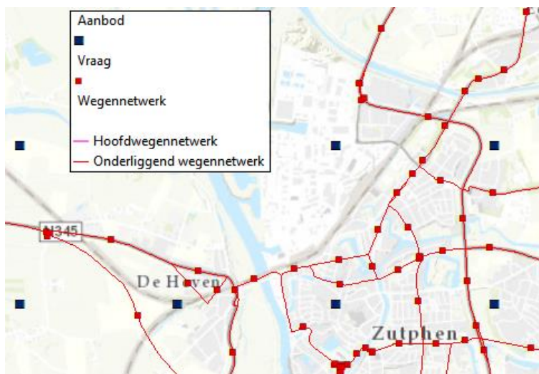
Afbeelding 2.1: Voorbeeld locatie-allocatie analyse

Voor de drie verschillende scenario's zijn drie verschillende sets met vraagpunten gegenereerd, zodat de 'locatie-allocatie analyse' methode voor elke scenario toegepast kon worden.