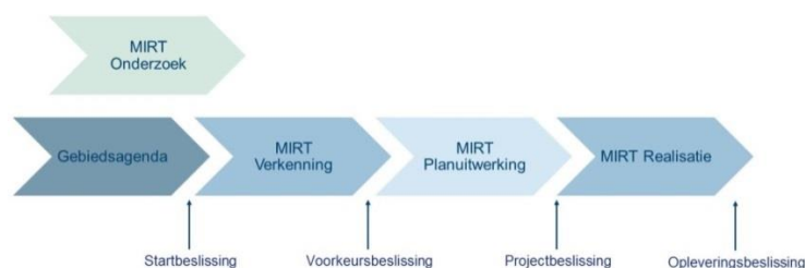
Figuur 2.1 Het MIRT-proces 13 .

Na besluitvorming wordt het voorkeursalternatief in de voorkeursbeslissing vastgelegd en vervolgens in een planuitwerkingsfase verder uitgewerkt om de realisatie voor te bereiden (figuur 2.1). De verkenningen die doorgaan naar de planuitwerking, eindigen met een politiek-bestuurlijk gedragen voorkeursoplossing. Deze voorkeursoplossing kan bestaan uit één voorkeursalternatief of uit een samenhangend en adaptief pakket van uiteenlopende acties op de korte en lange termijn.