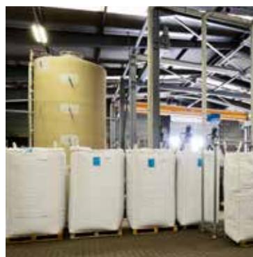
Urban Mining Corp: Biddinghuizen