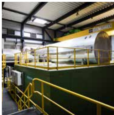
Energiecentrale BECC: Cuijk