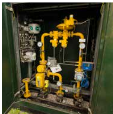
Schaap Bio Energie: Sint Nicolaasga