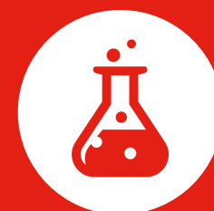
Dreiging van chemische, biologische, radiologische en nucleaire middelen (CBRN)