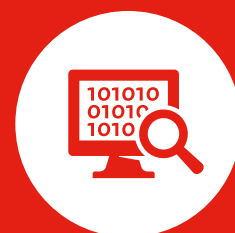
Ongewenste buitenlandse inmenging en ondermijning