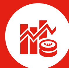
Bedreiging van vitale economische processen