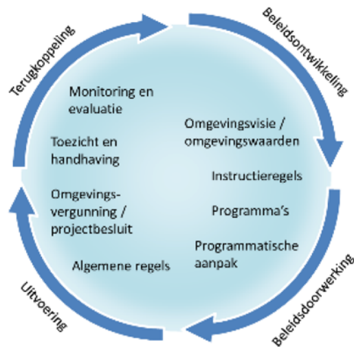
Figuur 1: De beleidscyclus van de Omgevingswet.

De Omgevingswet kent zes kerninstrumenten: de omgevingsvisie, het programma, decentrale regels (omgevingsplan, omgevingsverordening, waterschapsverordening), algemene rijksregels, omgevingsvergunning en het projectbesluit. 20 Daarnaast geeft de Omgevingswet ondersteunende instrumenten, zoals gedoogplichten, regels over grondexploitatie, financiële instrumenten, advisering, bevoegdheden in bijzondere omstandigheden en regels over informatievoorziening. Deze zes kerninstrumenten en de ondersteunende instrumenten kunnen worden ingezet voor het waarborgen van de gebruikswaarde van de bodem en het duurzaam gebruik van de functionele eigenschappen van de bodem.