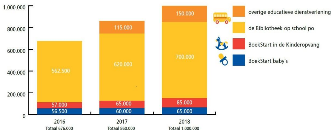
Figuur 3 Bereik Kunst van Lezen 2016 en verwachtingen voor eind 2017 en 2018

De stand van zaken eind 2016 en de verwachtingen voor eind 2017 en 2018 zien er als volgt uit: