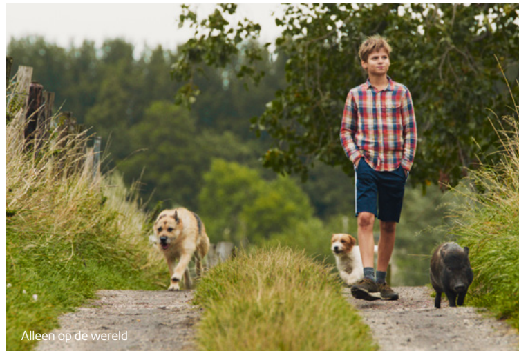
Alleen op de wereld

Naast ondertiteling voor doven en slechthorenden hebben we ons ook gebogen over access services voor blinden en slechtzienden. We hebben geëxperimenteerd met audiodescriptie: een dienst voor blinden en slechtzienden waarbij een stem tussen de dialogen beschrijft wat er te zien is. Vorig jaar zijn er zes Telefilms met audiodescriptie uitgezonden, evenals de kinderserie Alleen op de wereld (VPRO) en de pilotaflevering van Boer Zoekt Vrouw (KRO-NCRV).