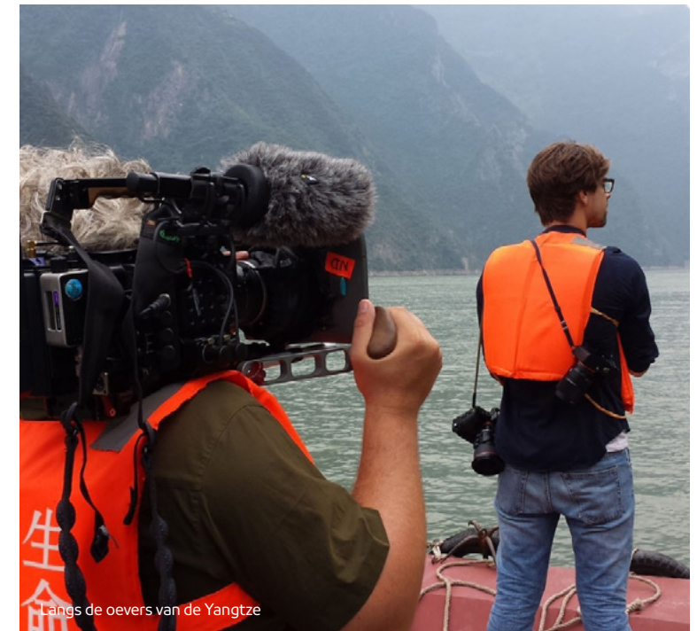
Langs de oevers van de Yangtze

Voor kinderen tussen 6 en 12 jaar biedt de NPO op Zapp dagelijks een sterk Nederlands aanbod aan kinderprogramma's, zoals Het Klokhuis (NTR) en het Jeugdjournaal (NOS). Ook zijn er speciaal voor kinderen gemaakte documentaires, series en films. Voor de jongere kinderen van twee tot en met vijf jaar is er de veilige omgeving van Zappelin, waar kinderen met programma's als Kindertijd (KRO-NCRV) en Het Zandkasteel (NTR) spelenderwijs kennis maken met de wereld om hen heen.