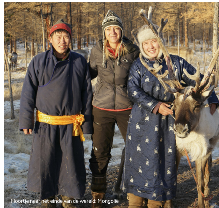
Floortje naar het einde van de wereld: Mongolië

In 2016 heeft de NPO voor het eerst gewerkt met het hierboven genoemde meetinstrumentarium. De komende jaren werken we aan een verdere invulling en verbetering ervan.