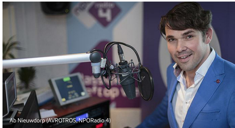
Ab Nieuwdrorp (AVROTROS, NPOradio 4)

Daarom hebben we de krachten van de verschillende zenders gebundeld in het opleidingsplatform NPO Campus. NPO Campus heeft in 2016 gezorgd voor coaching, ontwikkeltrajecten en workshops voor dj's en presentatoren die al voor een landelijke omroep werkzaam zijn. In totaal ging het om 23 dj's en presentatoren. NPO Campus scout ook nieuw talent. Om een brede, gevarieerde instroom mogelijk te maken is er daarom in 2016 naast de traditionele inzending van demo's ook gescout via workshops op hogescholen.