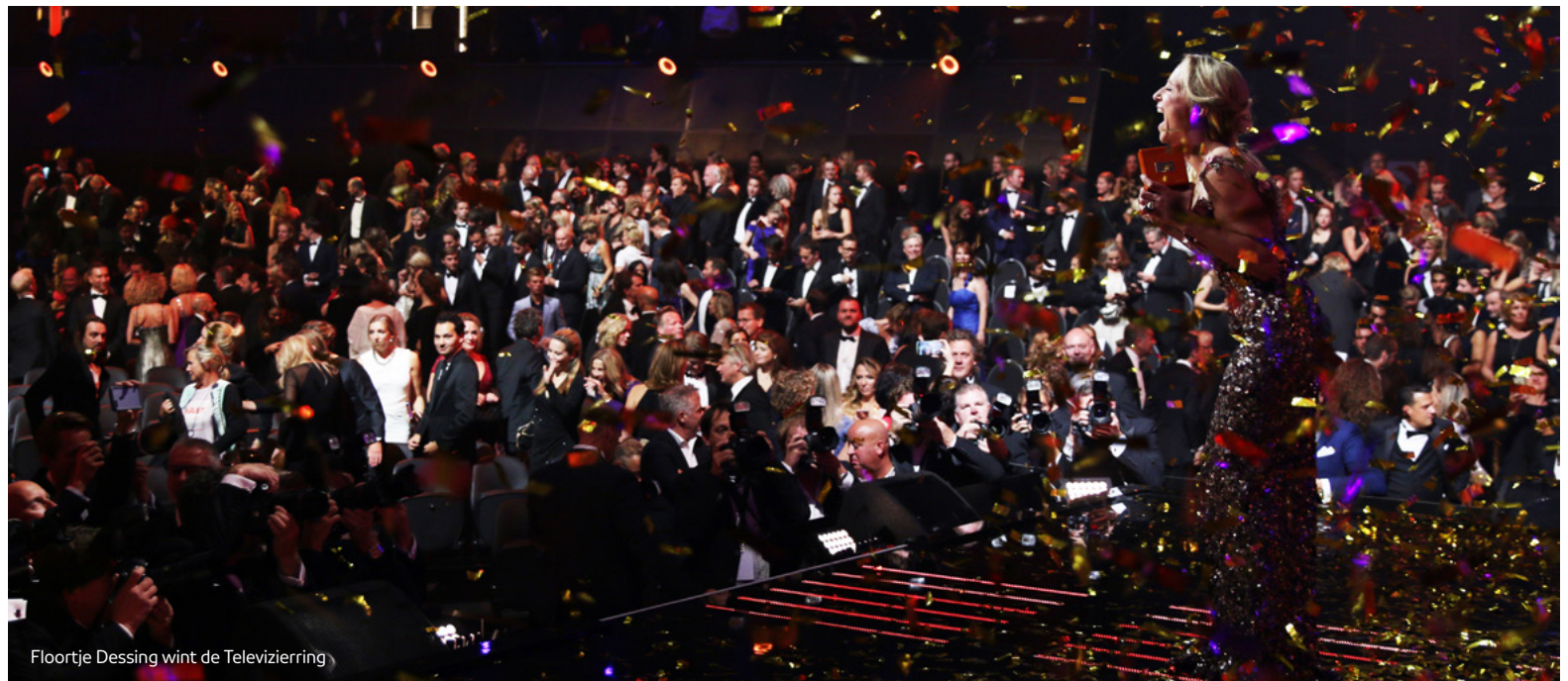
Floortje Dessing wint de Televizierring

Ook in het buitenland was er veel waardering voor programma's van de omroepen. Enkele highlights uit de gewonnen prijzen zijn de European Design Award voor de interactieve documentaire Jheronimus Bosch – Tuin der Lusten (NTR), een Prix Italia voor Paolo Ventura, de verdwijnende man (NTR) en vier prijzen (waaronder die voor beste film) op het Filmfestival van Milaan voor Lucia de B. (KRO-NCRV). Onze kinderprogramma's werden vele malen bekroond met prestigieuze prijzen, bijvoorbeeld een International Emmy Kids Award voor Rabarber (KRO-NCRV) en twee jury prijzen voor de jeugd documentaire Mensjesrechten - Een jaar zonder mijn ouders (EO) op het Chicago International Children's Film Festival.