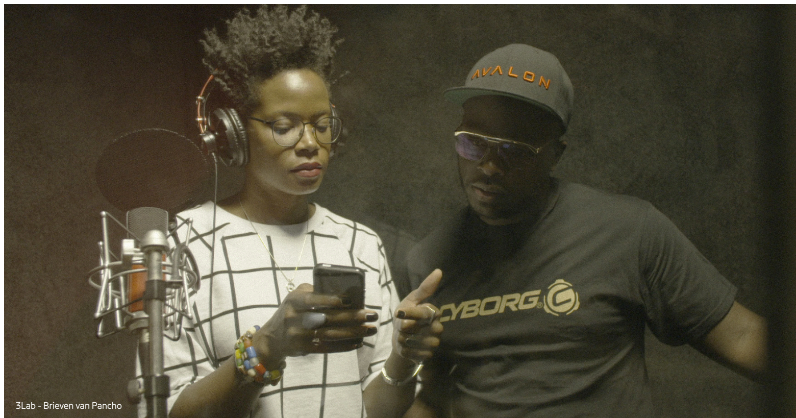
3Lab - Brieven van Pancho

speciale programma's, en al ons overige online aanbod. Om npo.nl een sterk, onafhankelijk en publiek domein te laten blijven, is regelmatige vernieuwing geboden. In 2016 hebben we ons vooral gericht op het makkelijker vindbaar maken van de lineaire livestreams in de navigatie. Dat betrof de vaste lineaire livestreams van de netten en zenders, inclusief de themakanalen, maar ook de tijdelijke livestreams rond het EK voetbal en de Olympische Zomerspelen.