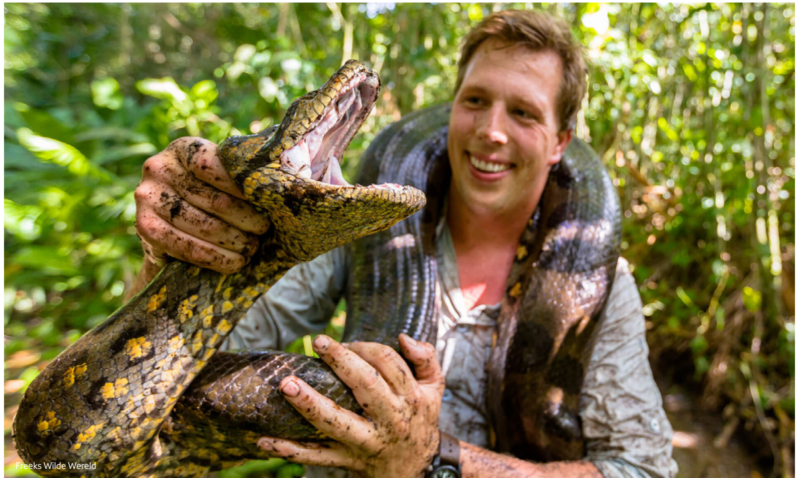
Freeks Wilde Wereld

Als er geen Zapp-programma op televisie is, wordt op deze livestream de programmering van het themakanaal Zapp Xtra uitgezonden. Zo kunnen kinderen altijd en overal naar het met liefde en aandacht voor hen gemaakte aanbod kijken.