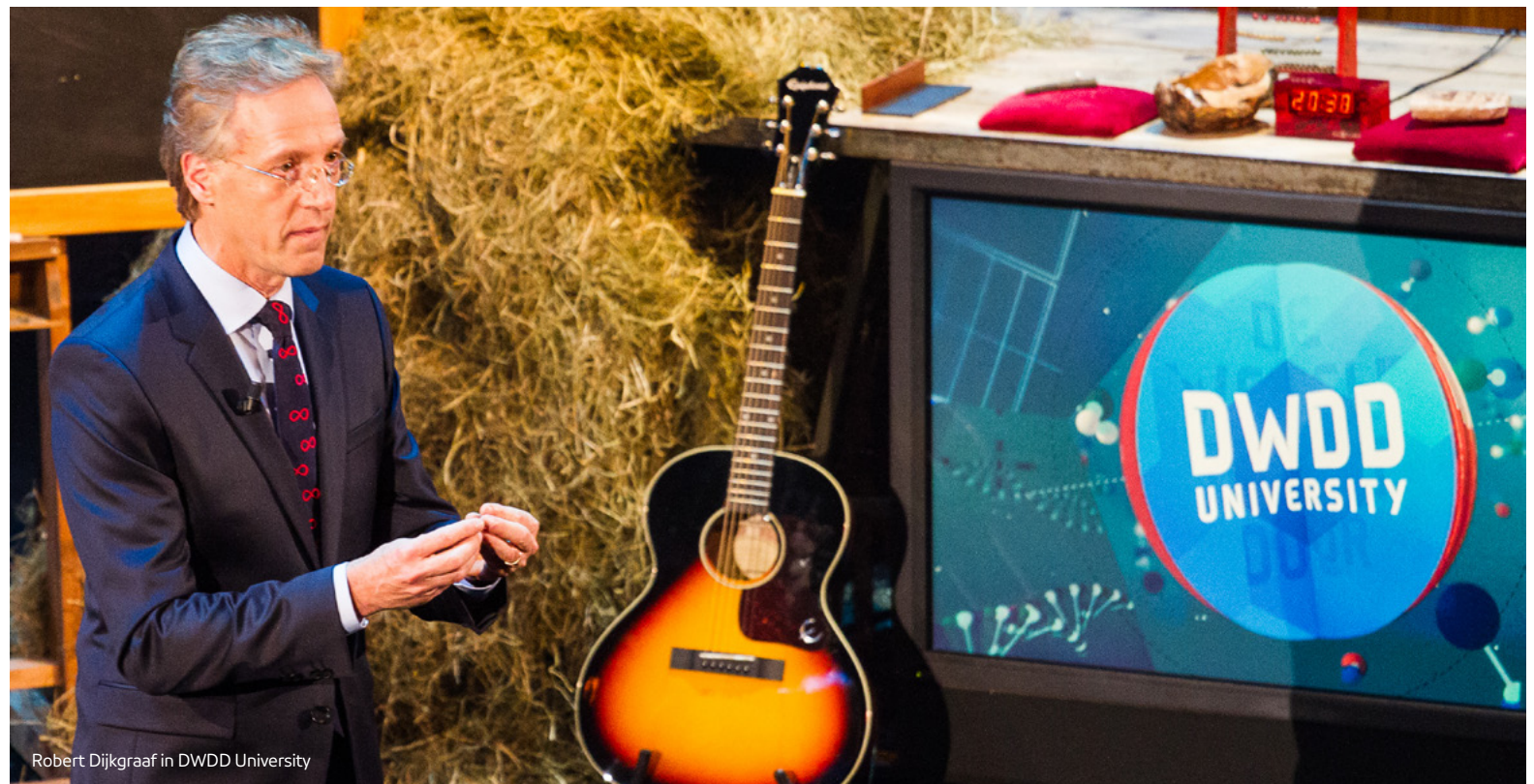
Robert Dijkgraaf in DWDD University

Om te kunnen meepraten, meedoen en meebeslissen hebben mensen kennis nodig. Ons aanbod bevatte ook in 2016 veel programma's in het domein Kennis, over uiteenlopende onderwerpen, van voeding tot