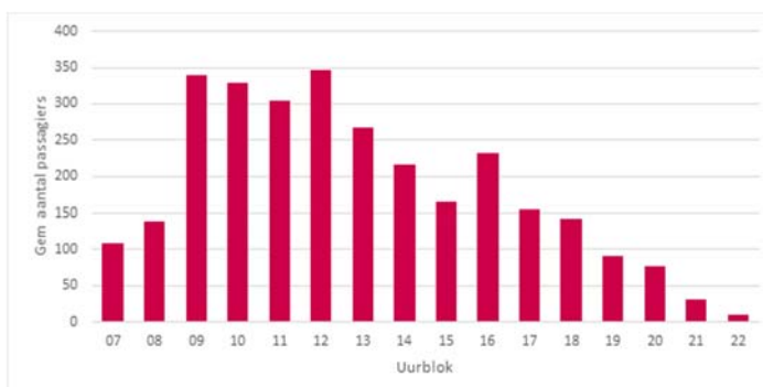
Figuur 6.1: Gemiddeld aantal reizigers Holwerd - Ameland per afvaart per uurblok

Een ruimer tijdvenster is voor reizigers aantrekkelijk: in de 5-kwartierdienst met 7 afvaarten is het mogelijk om 22.15 nog uit Holwerd te vertrekken, waar dat in de huidige situatie om 19.30 uur is. Kijken we naar de bezettingscijfers van de huidige afvaarten dan is duidelijk te zien dat het aantal reizigers van de laatste afvaarten (gemiddeld veel) lager is dan de bezetting van de andere afvaarten.