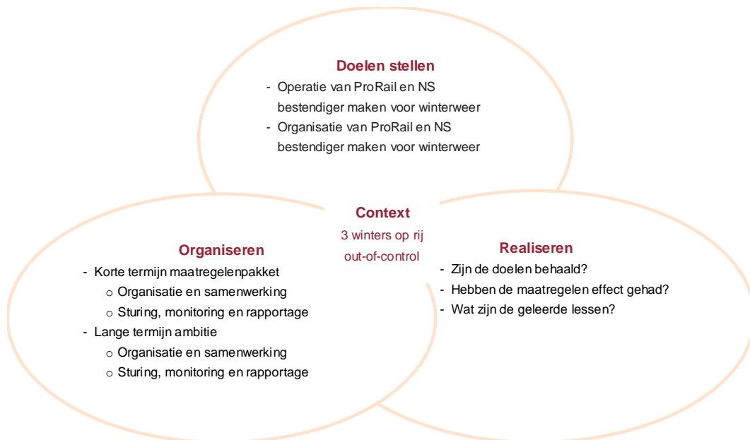
Figuur 1. Evaluatie programma winterweer NS en ProRail

In de tweede plaats hebben wij zowel de formele manier van organiseren en realiseren ('op papier') in het programma winterweer onderzocht, op basis van bureauonderzoek, als de manier van organiseren en realiseren in de praktijk, via het bureauonderzoek aangevuld met diepte-interviews. Bij de formele manier van organiseren gaat het om (deel)vragen als: welke maatregelen zijn gedefinieerd, hoe zijn die maatregelen formeel verankerd, hoe is de samenwerking tussen NS en ProRail verankerd, etc. De praktijk is echter minstens zo belangrijk; de maatregelen uit het programma winterweer zullen door een zeer groot aantal medewerkers dwars door beide organisaties heen moeten worden uitgevoerd. Daarbij gaat het om (deel)vragen als: in hoeverre zijn de maatregelen geïnternaliseerd, is er sprake van een plan-do-check-act cyclus die daadwerkelijk leidt tot continue verbetering, wisselen NS en ProRail regelmatig kennis en ervaringen uit met buitenlandse collega's en wat zijn de lessons learned.