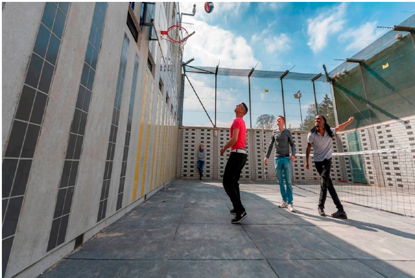
Afbeelding 16.

Binnen het terrein Jeugd is er een intensieve samenwerking tussen de verschillende toezichthouders in het jeugdveld en het sociaal domein. Naast de Inspectie Jeugdzorg en Inspectie voor de Gezondheidszorg werkt de Inspectie VenJ in het sociaal domein ook samen met de Inspectie Sociale Zaken en Werkgelegenheid en de Inspectie voor het Onderwijs. Deze vijf rijksinspecties werken samen onder de noemer Samenwerkend Toezicht Jeugd. Het toezicht richt zich op risico's, maar ook op calamiteiten. De Inspectie VenJ richt zich voornamelijk op instellingen waarmee jeugdigen via opgelegde justitiële maatregelen in aanraking komen. Dit zijn naast de justitiële jeugdinrichtingen ook de Raad voor de Kinderbescherming, de gecertificeerde instellingen voor onder andere jeugdreclassering en Halt.