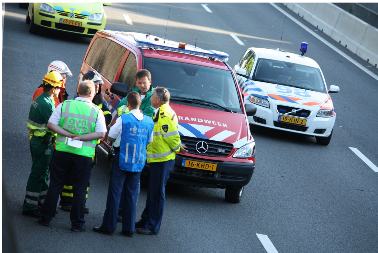
Afbeelding 1.

De Inspectie Veiligheid en Justitie (Inspectie) bestaat inmiddels vijf jaar. De afgelopen drie jaar heeft de Inspectie het toezicht gefocust op een aantal bepalende thema's: de invloed van bezuinigingen en reorganisaties, de kwaliteit van samenwerking in ketens en netwerken en informatieopslag en informatie-uitwisseling. Terugkijkend blijkt dit een juiste keuze. Uit het toezicht komt een aantal aandachtspunten naar voren voor de toekomstige uitvoering van taken, die samenhangen met deze thema's: