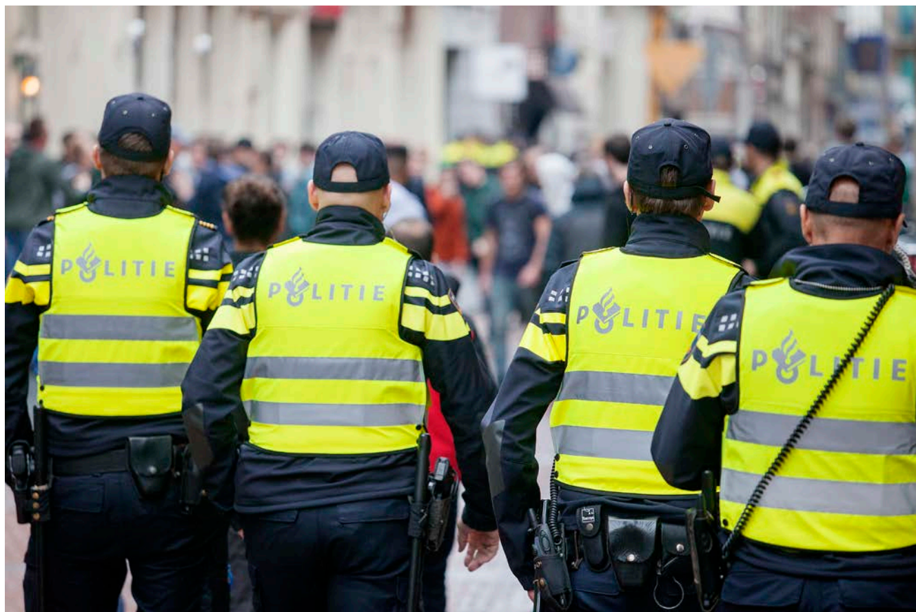
Afbeelding 9.

De Inspectie houdt toezicht op de taakuitvoering van, en de kwaliteitszorg door de politie. Daarbij kijkt de Inspectie ook naar de kwaliteit van het politieonderwijs en hoe de politie functioneert als partner in bijvoorbeeld de strafrechtketen en de vreemdelingenketen. Hiernaast rapporteert de Inspectie sinds de start van de reorganisatie van de politie periodiek over de voortgang van de vorming van de nationale politie. In 2017 publiceert de Inspectie een afsluitend rapport over de vorming van de nationale politie.