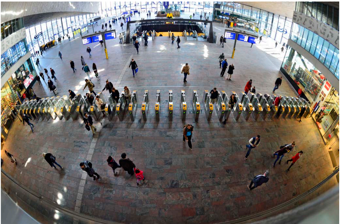
Afbeelding 2.