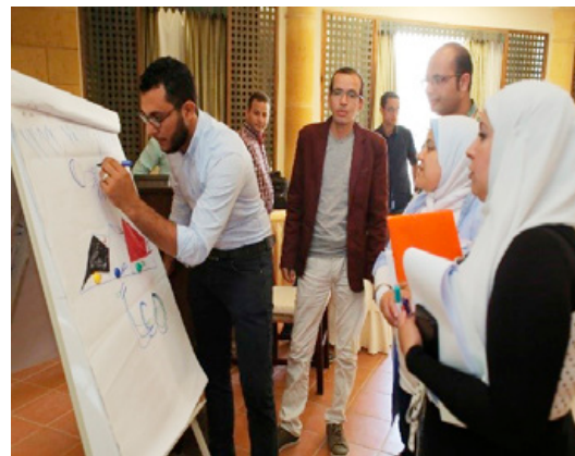
Deelnemers in gesprek tijdens workshop van de ngo Coptic Evangelical Organization for Social Services (CEOSS)

zijn drie projecten geïdentificeerd en gefinancierd die elkaar versterken. Ze richten zich op het stimuleren van de dialoog tussen religieuze en sociale groepen en het beschermen van vervolgte minderheden d.m.v. rechtsbijstand en verlenen van onderdak. Zo geeft de ngo Centre for Legal Aid, Assistance and Settlement (CLAAS) onderdak en rechtshulp aan religieuze minderheden die bedreigd worden. Het project zal aan circa 80 personen onderdak kunnen bieden en rechtshulp geven bij 100 rechtszaken.