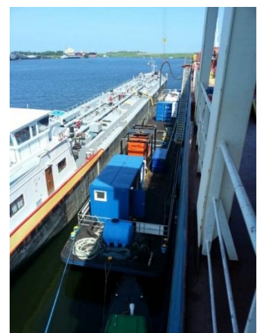
4.2: Boord-boord overslag

In dit project zijn twee ontwikkelingen gefinancierd met de subsidie. Ten eerste de VentoClean, de machine die daadwerkelijk schoonmaakt. Deze ontwikkeling was nooit mogelijk geweest zonder de subsidie. Daarnaast zijn er ook afmeerpalen aangelegd. Doordat de haven van Amsterdam te krap is om te werken met boeien, waren er palen nodig. Deze zijn echter veel duurder. Om de concurrentiestrijd met onder andere Rotterdam niet te verliezen, waar de goedkopere boeien worden gebruikt, heeft de subsidie de onrendabele top opgevuld. De VentoClean werkt wel, maar zonder wettelijke verplichting is er geen businesscase van te maken door de hoge kosten. In Estland is die verplichting er wel, daar wordt het nu ook toegepast.