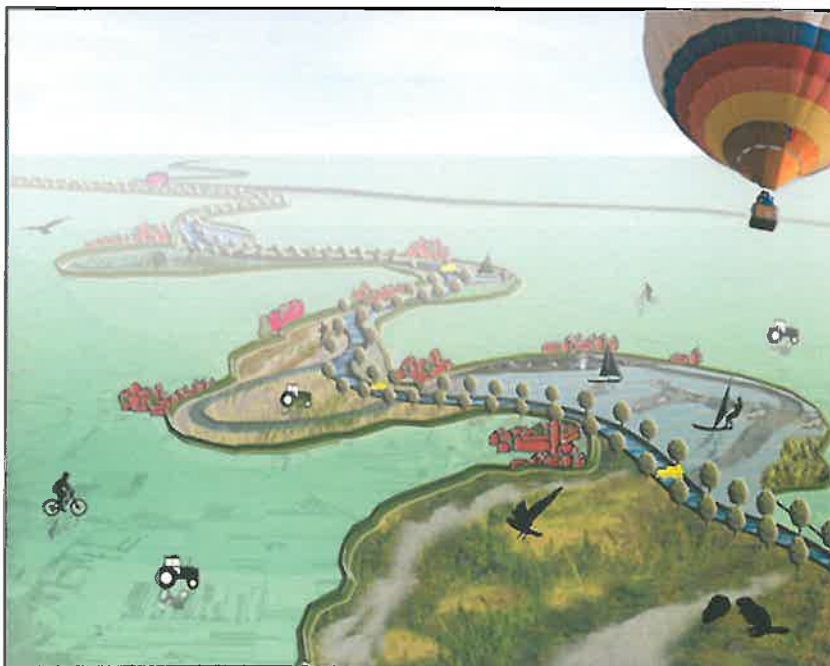
Figuur 1: het perspectief op de Meanderende Maas.

In het BO MIRT van 12 oktober 2016 is ingestemd met de start van een integrale verkenning voor Ravenstein-Lith. De start van de verkenning is onderdeel van een samenhangend pakket aan waterveiligheidsmaatregelen voor de gehele Maas. Dit pakket geeft invulling aan de urgente hoogwaterveiligheidsopgave en verbindt die met lokale ruimtelijke en economische ambities.