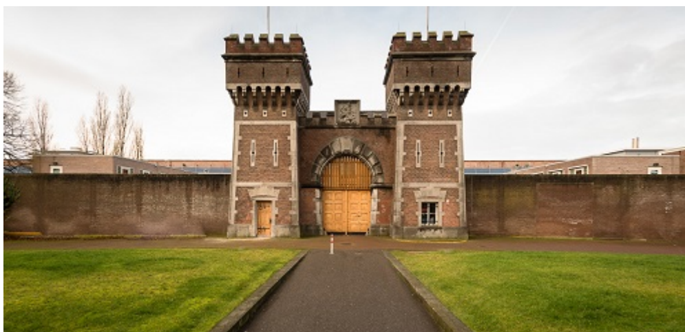
Afbeelding 15.

In 2014 heeft het gevangeniswezen een sober arrestantenregime ingevoerd voor gedetineerden die zijn veroordeeld tot een celstraf van maximaal acht weken. Dit betekent dat een gedetineerde dan een beperkt dagprogramma heeft van 28 uur per week. De overige uren zit hij op cel. Arbeid wordt in deze periode niet aangeboden. De Dienst Justitiële Inrichtingen voert dit regime uit geconcentreerd in een beperkt aantal inrichtingen. De Inspectie onderzoekt in 2017 onder andere of het arrestantenregime in penitentiaire inrichtingen voldoet aan de geldende normen.