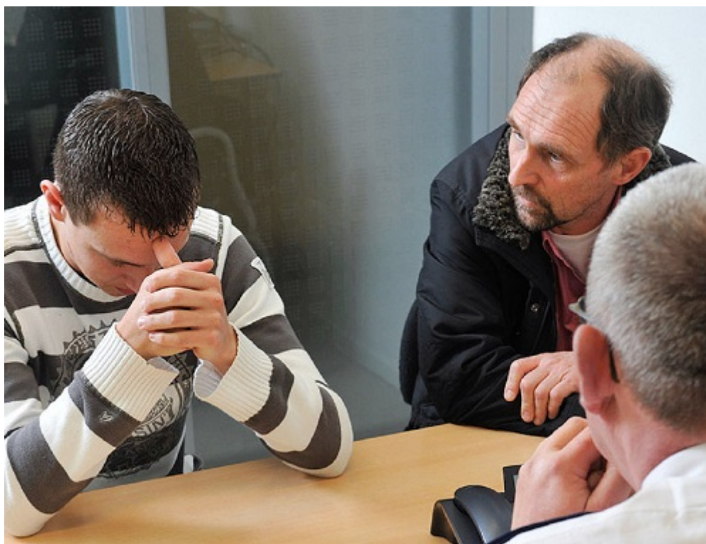
Afbeelding 18. De Inspecties zijn een onderzoek gestart naar de wijze waarop Halt samenwerkt met de ketenpartners.

Als vervolg op de doorlichting van Halt in de provincies Limburg, Noord-Brabant en Zeeland zijn de inspecties Veiligheid en Justitie en Jeugdzorg in 2016 een thematisch onderzoek gestart naar de wijze waarop Halt samenwerkt met ketenpartners, dat doorloopt naar 2017. Uit de doorlichting bleek dat de afdoening door Halt zelf in grote lijnen goed wordt uitgevoerd, maar dat de wijze waarop de Halt-zaken door de politie, het Openbaar Ministerie en/of de leerplichtambtenaren worden aangeleverd en de samenwerking met jeugdhulpaanbieders naar aanleiding van de Halt-afdoening aandachtspunten zijn.