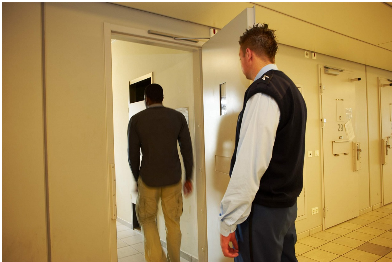
Afbeelding 12.

Bij de uitvoering van straffen en maatregelen spelen verschillende organisaties een rol, zoals gevangenissen, forensisch psychiatrische centra en de reclassering. De Inspectie houdt toezicht de sanctietoepassing als onderdeel van de justitieketen. Hier vallen onder: inrichtingen van het gevangeniswezen, de instellingen voor forensische zorg, de reclasseringsorganisaties, de Regionale Instellingen voor Beschermd Wonen en de landelijke diensten van de Dienst Justitiële Inrichtingen.