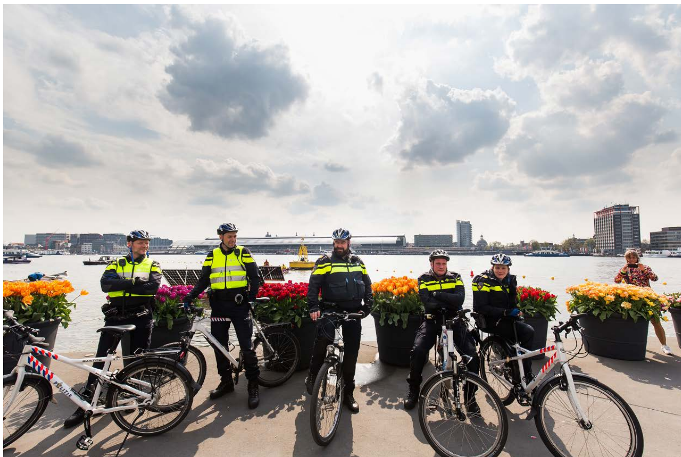
Afbeelding 7.

De politie levert een belangrijke bijdrage aan het handhaven en vergroten van de veiligheid in Nederland. Onder gezag van de burgemeesters en het Openbaar Ministerie werkt zij hierbij samen met hen en met andere publieke en private organisaties binnen de vreemdelingen-, de veiligheids- en de strafrechtketen zoals de reclassering en de veiligheidsregio's.