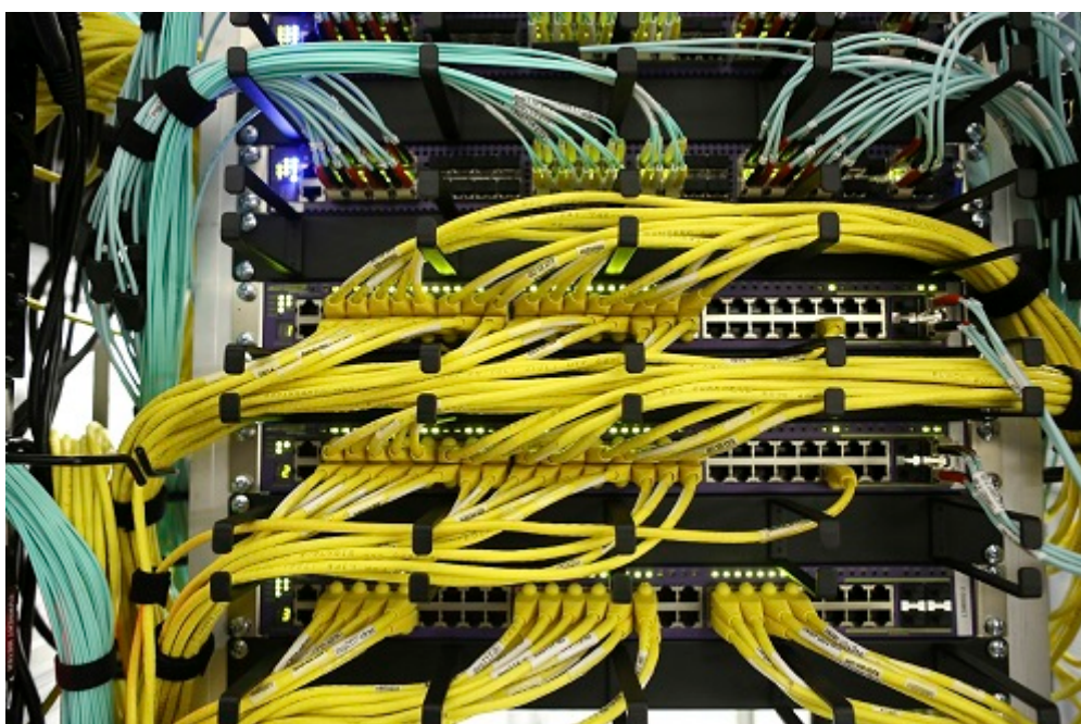
Afbeelding 4. De Inspectie richt haar toezicht zowel op de voorbereiding op fysieke dreigingen als op digitale en sociale dreigingen.

Inspectie richt haar toezicht op zowel de voorbereiding op fysieke dreigingen als op digitale en sociale dreigingen. De wijze waarop organisaties inspelen op risico's en maatschappelijke ontwikkelingen is daarbij een aandachtspunt. De Inspectie geeft het toezicht op Nationale veiligheid steeds meer gestructureerd vorm. Er wordt ingezet op het periodiek opstellen van beelden over de rampenbestrijding, brandweer en GHOR. De focus van het toezicht komt daarbij meer te liggen op het toetsen van de daadwerkelijke kwaliteit en kwaliteitsontwikkeling. Daarnaast voert de Inspectie in 2017 een verkenning uit naar cybersecurity.