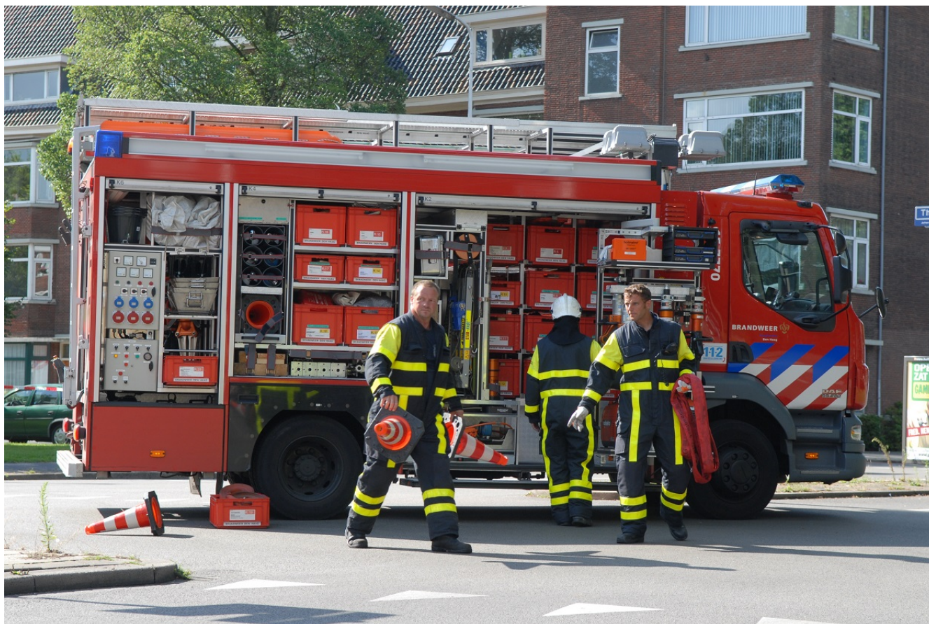
Afbeelding 3.

De overheid zet zich in om Nederland te beschermen tegen dreigingen die de maatschappij kunnen ontwrichten. Het kan daarbij gaan om 'klassieke' fysieke dreigingen zoals branden en natuurgeweld. Maar de dreiging kan ook een digitaal of sociaal karakter hebben, denk bijvoorbeeld aan terrorisme, uitval van ICT en cybercrime.