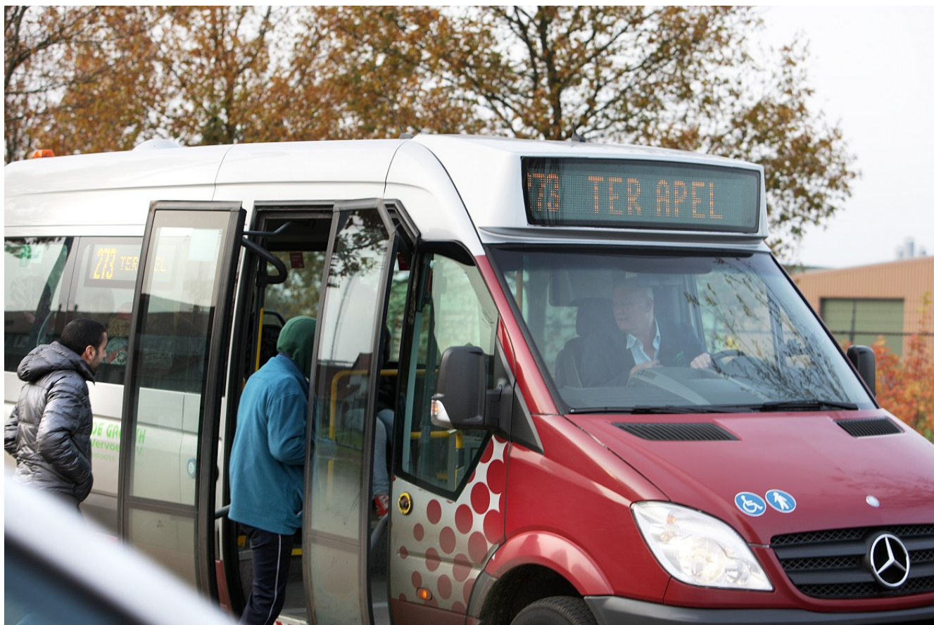
Afbeelding 9.

In Nederland zijn verschillende organisaties belast met het vormgeven en uitvoeren van vreemdelingenbeleid. Ze werken daarbij samen in ketens en netwerken die bestaan uit een groot aantal organisaties, waaronder de Immigratie- en Naturalisatiedienst, het Centraal Orgaan opvang Asielzoekers, de Dienst Terugkeer en Vertrek, de politie, de Koninklijke Marechaussee en de Dienst Justitiële Inrichtingen.