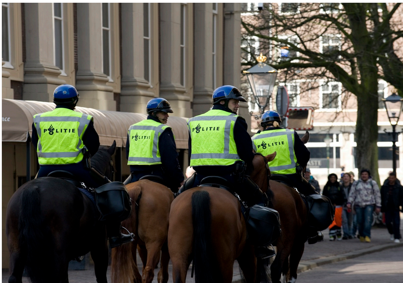
Afbeelding 2.