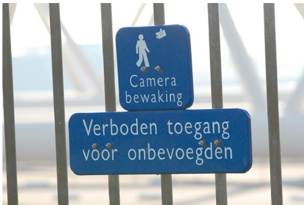
Afbeelding 8. De politie moet voor elke nucleaire inrichting een plan opstellen voor de externe beveiligingsorganisatie. De Inspectie doet onderzoek naar de plannen.

Een nucleaire inrichting is zelf verantwoordelijk voor de veiligheid van de inrichting. De overheid is verantwoordelijk voor de externe beveiliging. De politie moet voor elke inrichting een plan opstellen voor de externe beveiligingsorganisatie. Dit plan richt zich op mogelijke dreigingen die de productie van een nucleaire inrichting kunnen verstoren of die een gevaar kunnen vormen voor de samenleving. Het plan beschrijft de maatregelen die de politie in zulke situaties treft in het kader van de ordehandhaving, bewaking, beveiliging en responsmanagement waaronder (speciale) interventie. De Inspectie is in 2016 gestart met een onderzoek naar de externe beveiligingsorganisatieplannen.