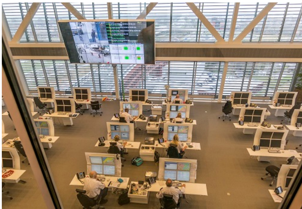
Afbeelding 6. De Inspectie concludeerde in 2015 dat de continuïteit van meldkamers een punt van zorg is.

Vanwege de cruciale rol die de meldkamers spelen in het hulpverleningsproces van met name de politie, de brandweer en de ambulancezorg onderzoekt de Inspectie wat met de aanbevelingen uit het inspectieonderzoek naar de meldkamers uit 2015 is gebeurd. En in hoeverre de eerder geconstateerde aandachtspunten in de nieuwe meldkamers zijn opgelost. Tevens biedt het de mogelijkheid om de good practices en aandachtspunten van de nieuwe meldkamers inzichtelijk te maken en deze mee te nemen in het vervolgtraject van het samenvoegen van alle meldkamers.