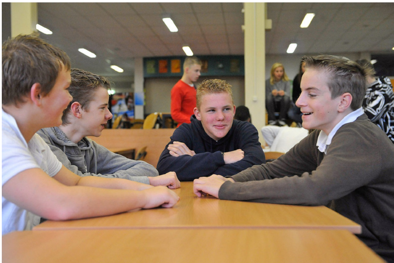
Afbeelding 16.

Het jeugddomein omvat de jeugdhulp, de jeugdbescherming en de jeugdreclassering. Het werkkterrein van de Inspectie VenJ omvat de justitiële jeugdinrichtingen, de Raad voor de Kinderbescherming, Halt en de gecertificeerde instellingen voor jeugdbescherming en jeugdreclassering. Daarnaast spelen ook de politie en de reclassering vaak een rol in het jeugddomein. Zo is de politie bijvoorbeeld de organisatie die de meeste zorgmeldingen doet bij Veilig Thuis bij mogelijk huiselijk geweld en kindermishandeling.