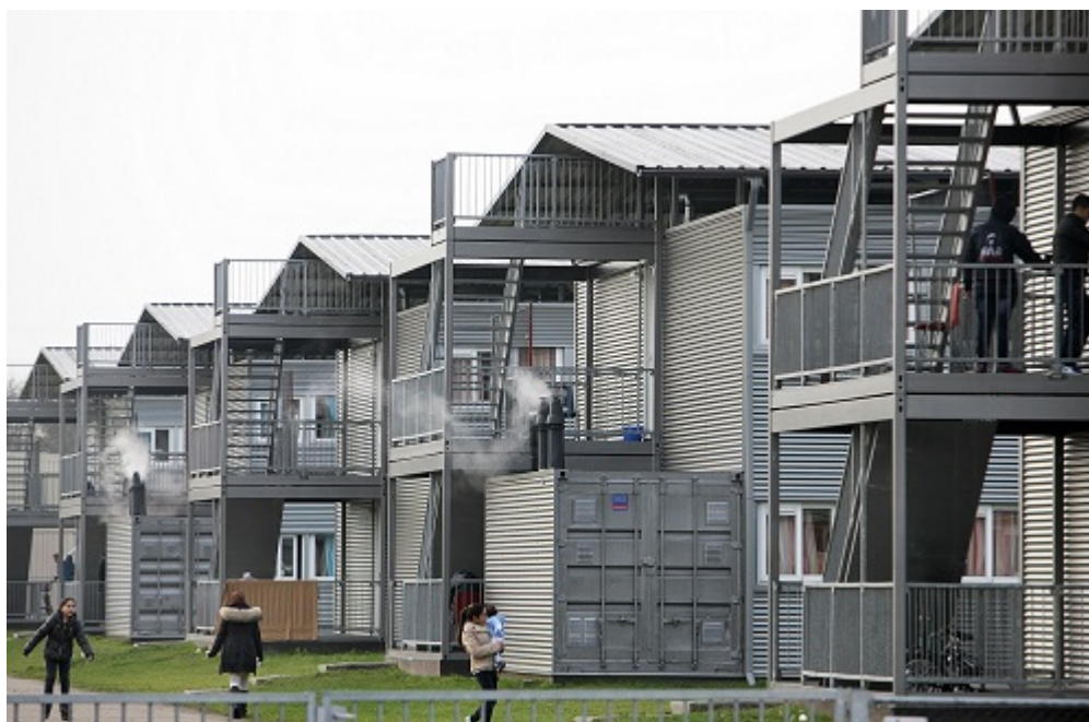
Afbeelding 11. Tijdelijke woonunits asielcomplex Ter Apel.

De Nederlandse overheid is verantwoordelijk voor de beschikbaarheid van veilige en leefbare opvang voor asielzoekers tijdens de asielprocedure. Tegelijkertijd is, gezien de schommelingen in de asielstromen, gebleken dat het plannen en realiseren van opvangcapaciteit complex is. Situaties van opbouw en afbouw van opvangcapaciteit kunnen elkaar snel opvolgen; soms zijn noodvoorzieningen aan de orde. De Inspectie onderzoekt daarom in hoeverre het Centraal Orgaan opvang Asielzoekers (COA) onder de geschetste omstandigheden in staat is een voor bewoners veilige opvang te realiseren. In het onderzoek is ook aandacht voor de veiligheid van medewerkers van het COA.