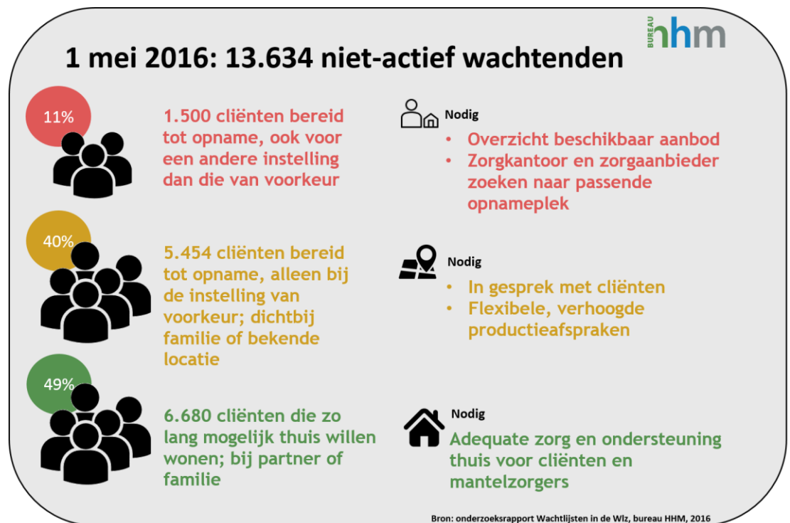
Figuur 1. Samenvatting rapportage wachtlijsten in de Wlz

Een derde groep cliënten heeft op dit moment geen bereidheid tot opname. Zij willen zo lang mogelijk thuis blijven wonen, ook al komt er een plek vrij bij de voorkeursaanbieder. Zij wonen veelal met een partner of een familielid. 49% van de mensen in deze groep geeft aan niet te willen verhuizen naar de aanbieder op het moment dat daar een plek vrijkomt. Van deze cliënten geeft 42% aan dat het thuis redelijk gaat. Van de mantelzorgers geeft 43% aan dat het verlenen van zorg redelijk gaat.