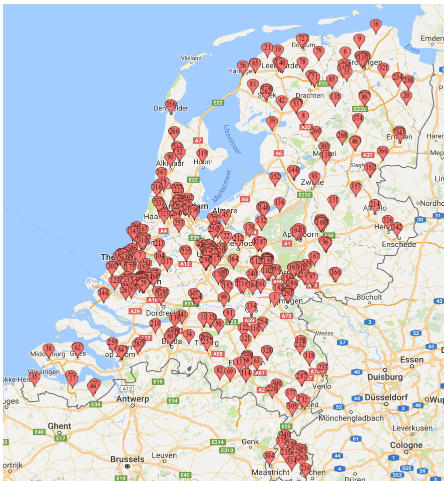
Figuur 2: Spreiding van vestigingen van keurmerkhouders met een aanbod voor analfabeten

Wat in het kader van de inburgering in Nederland te volgen is, is zeker niet het enige interessante gegeven. Minstens van even groot belang is op welk niveau inburgeraars hun cursus kunnen krijgen. Het zou immers zo maar kunnen dat de inburgeringsbedrijven zich vooral richten op de relatief gemakkelijk in te burgeren personen met een relatief hoge koopkracht (de hoger opgeleiden) en net op de moeilijker groep van laaggeletterden veelal afhankelijk van een uitkering. Om hier inzicht in te krijgen heeft Blik op Werk ook een uitsplitsing gemaakt naar vestigingen, waar een aanbod is naar opleidingsniveau van betrokkene. Voor analfabeten is er op 422 locaties een aanbod, voor laagopgeleiden op 497, voor middelbaar opgeleiden op 522 en ten slotte voor hoogopgeleiden voor 525. Uit de cijfers blijkt dat naarmate het opleidingsniveau hoger is, het aanbod groter wordt. Dat leidt tot de vraag in hoeverre de bereikbaarheid van vestigingen, voor laagopgeleiden, in het bijzonder analfabeten, voldoende is. In figuur 2 is weergegeven hoe de spreiding van locaties voor een aanbod voor analfabeten of laaggeletterden gespreid is over Nederland.