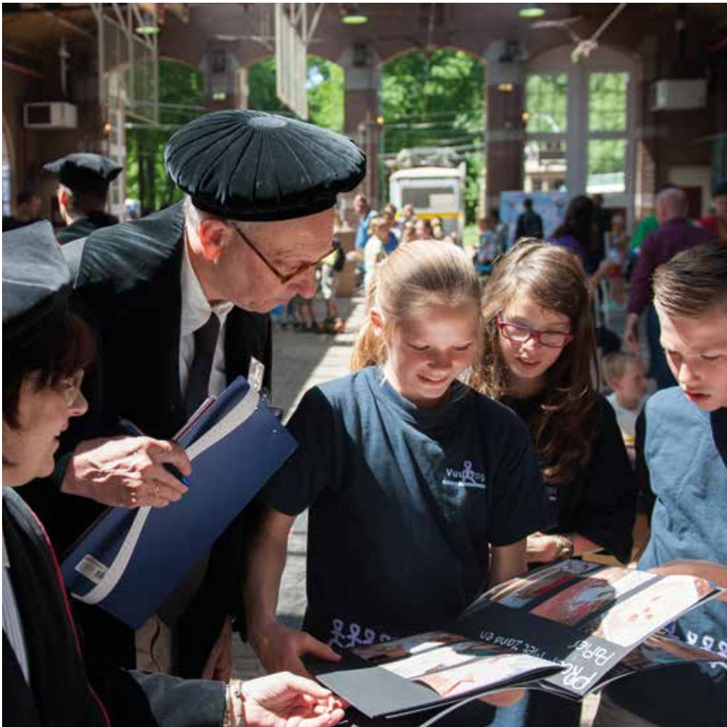
Elk jaar vindt het populaire Techniek Toernooi plaats, een techniekwedstrijd voor leerlingen uit alle groepen van het basisonderwijs. Het wordt gesponsord door bedrijven, kennisinstellingen en organisaties die techniek een warm hart toedragen en het belang van wetenschap en techniek voor de toekomst inzien. Professoren, in toga en met baret, vormen de hooggeleerde jury.