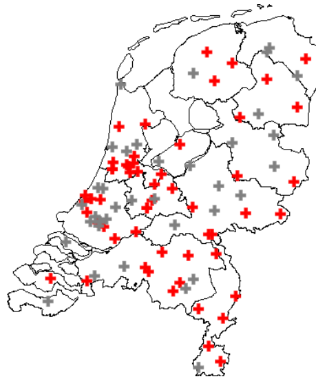
Figuur 2.1 Een overzicht van de SEH's die hebben deelgenomen aan de vuurwerkregistratie (de rode markeringen)