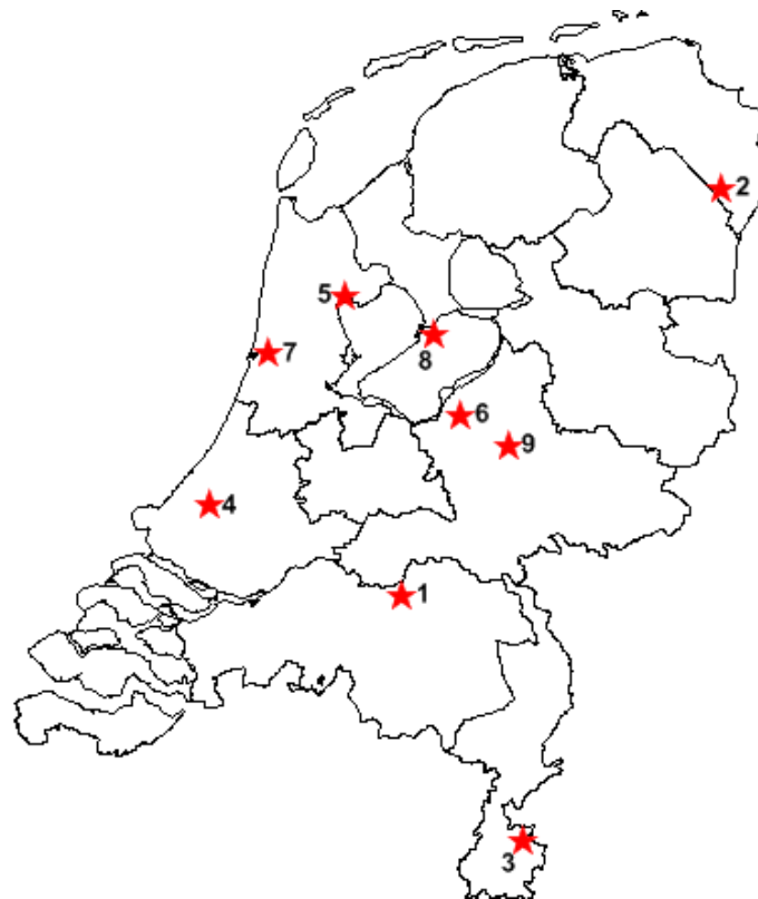
Figuur 3.2 Vuurwerkongevallen in de media in november 2015 tot en met januari 2016 (exclusief 31 december en 1 januari) waarbij er sprake was van ernstig letsel