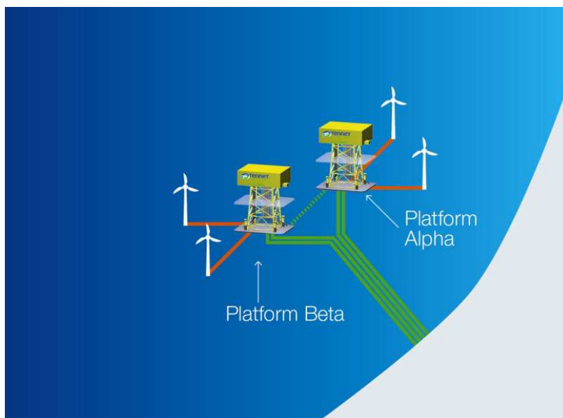
Figuur 2 Schematische weergave van concept van een net op zee.

Het uitgangspunt voor de opgave voor windenergie op zee is om de windparken op de meest kosteneffectieve wijze te realiseren. Dit gebeurt door uit te gaan van een nieuw concept van TenneT voor het net op zee 16 . Dit concept maakt gebruik van standaardplatforms, waarop per platform 700 MW windenergiecapaciteit kan worden aangesloten. Op het platform worden de windturbines van de windparken aangesloten, zie figuur 2. TenneT combineert twee windparken (van elk circa 350 MW) op een platform.