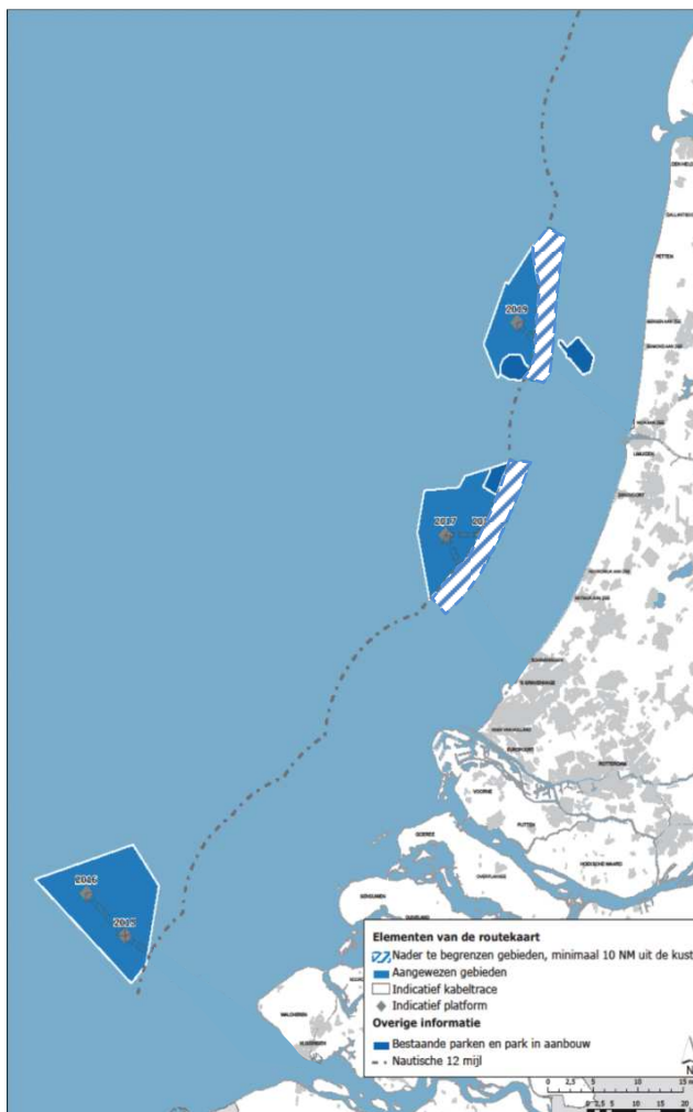
Figuur 1 Windenergiegebieden waarop dit ontwikkelkader betrekking heeft. De gearceerde gebieden moeten nog worden aangewezen.

Tijdens de evaluatie van de vorige uitgifteronde van windenergie op zee is de conclusie getrokken dat het kostenvoordelen biedt wanneer de uitrol van windenergie op zee geclusterd en onder regie van de rijksoverheid zal plaatsvinden 8 . Dit is onderkend bij het maken van afspraken in het Energieakkoord. Concreet betekent dit dat de uitrol zal plaatsvinden in clusters per windenergiegebied dat is aangewezen in het nationaal waterplan. In elk windenergiegebied zullen vervolgens kavels worden vastgesteld. De vergunningen en subsidie worden uitgegeven via een tenderprocedure.