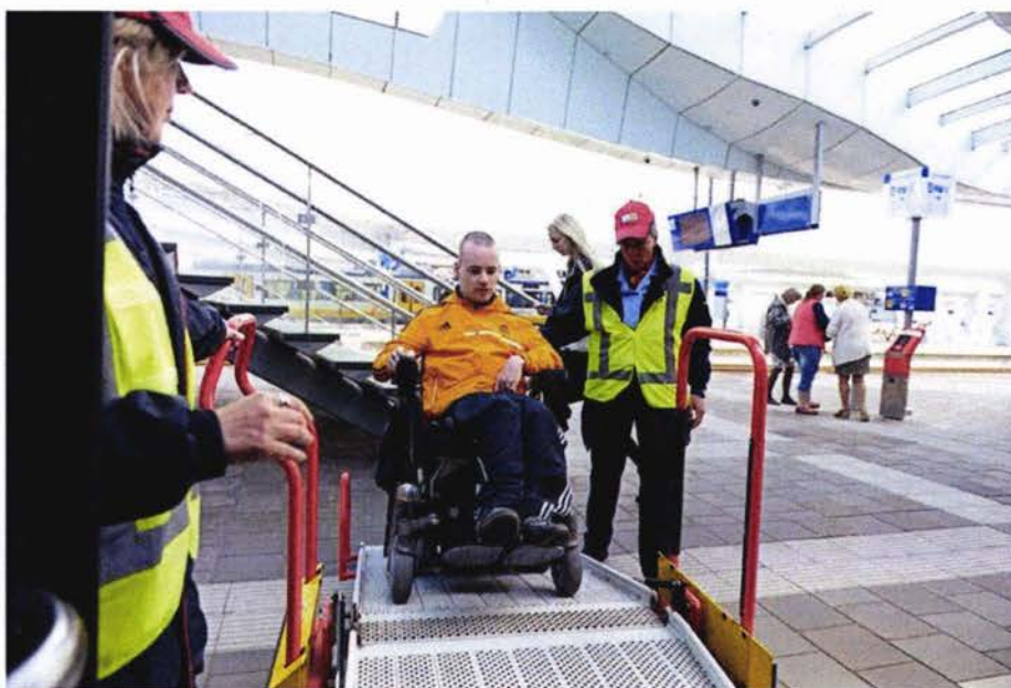
ASSISTENTIE BIJ HET INSTAPPEN

Als zelfstandig reizen lastig is, kunnen reizigers assistentie aanvragen bij NS. NS begeleidt reizigers die reizen met assistentieverlening door het station en helpt hen met in-, over- en uitstappen. Zie hoofdstuk 6.3.