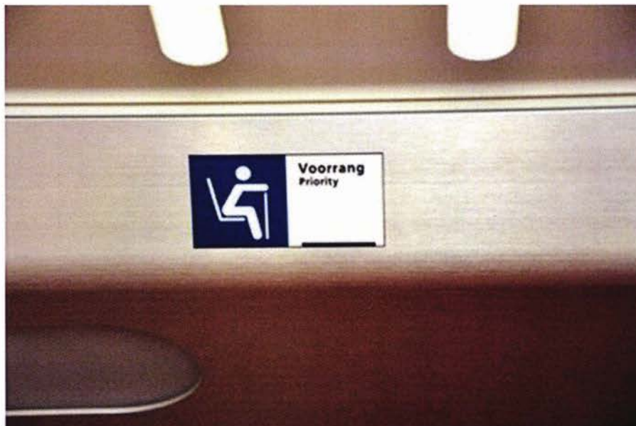
DE STICKER BIJ DE PRIORITY SEAT GEEFT AAN DAT REIZIGERS MET EEN LOOP-/STABEPERKING HIER MET VOORRANG MOGEN ZITTEN

Het verder toegankelijk maken van treinen voor reizigers met een auditieve of visuele beperking vindt plaats tijdens revisies, modernisering en door de instroom van nieuwe treinen. Waar mogelijk worden er bij revisies en modernisering ook stappen gezet om de toegankelijkheid van treinen voor reizigers met een motorische beperking te verbeteren. Zo worden de komende jaren de rolstoeltoegankelijke toiletten in de dubbeldekkers van het type VIRM verbeterd. Soms is het mogelijk om, los van modernisering en revisies, de voorzieningen voor reizigers met een beperking te verbeteren. Zo is in 2015 tien procent van alle zitplaatsen in de treinen gemarkeerd als priority seat . Dit zijn zitplaatsen die met voorrang zijn bedoeld voor mensen met een loop-/stabeperking zoals zwangere vrouwen, ouderen en mindervalide reizigers. NS geeft onder andere met deze maatregel invulling aan het flankerend toegankelijkheidsbeleid.