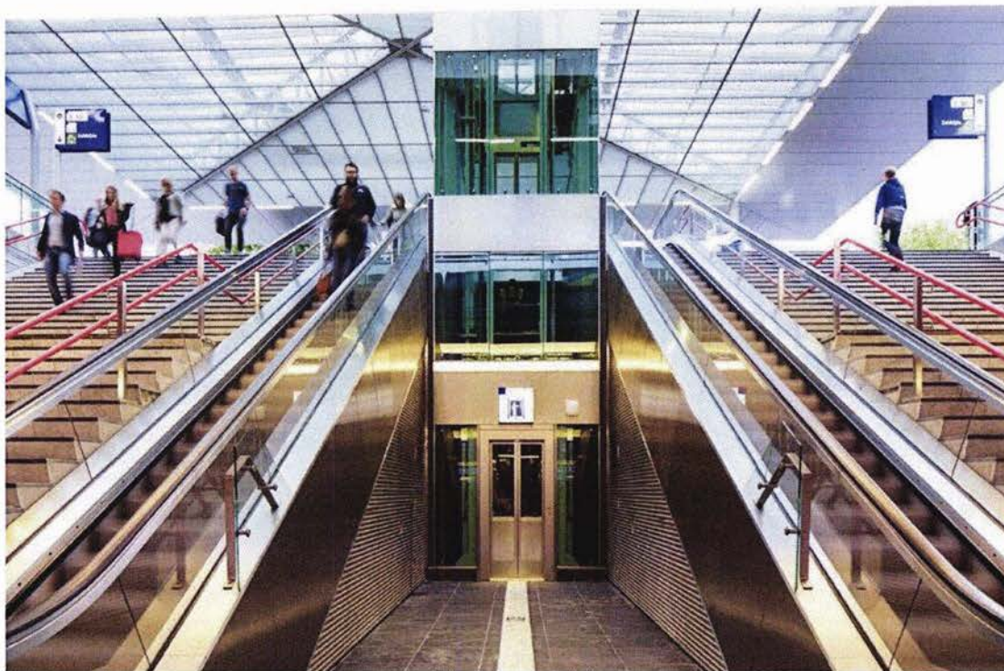
NIEUWE LIFT OP STATION ZWOLLE

In het kader van het programma Uitbreiden Sanitaire Voorzieningen zijn inmiddels 34 van de 40 toiletten gerealiseerd. De verwachting is dat deze opdracht ruim binnen budget zal worden afgerond.