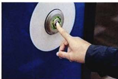
TACTIEL HERKENBARE BUITENDEURKNOP