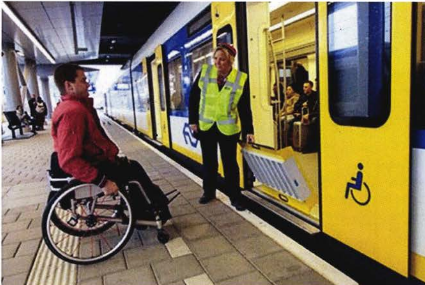
ALS ZELFSTANDIG REIZEN LASTIG IS, KUNNEN REIZIGERS ASSISTENTIE AANVRAGEN BIJ NS

Als zelfstandig reizen lastig is, kunnen reizigers assistentie aanvragen bij NS. Reizigers met een rolstoel maken het meest gebruik van deze service. NS begeleidt reizigers die reizen met assistentieverlening door het station en helpt hen met in-, over- en uitstappen.