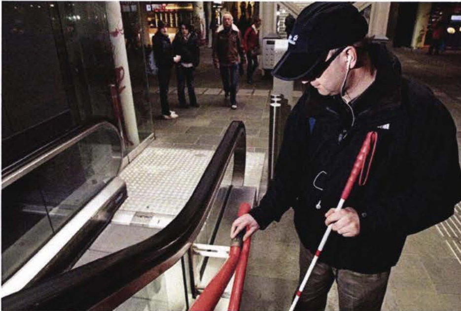
'TACTIELE' INFORMATIE IS TE VINDEN OP DE TAST

In onderstaande tabel wordt zowel de stand van zaken per 2016 (nadat alle kleine maatregelen ten behoeve van mensen met een visuele en auditieve beperking zijn gerealiseerd) als de situatie per 2020 weergegeven. Voor de reizigersaantallen in 2020 is gebruik gemaakt van prognoses.