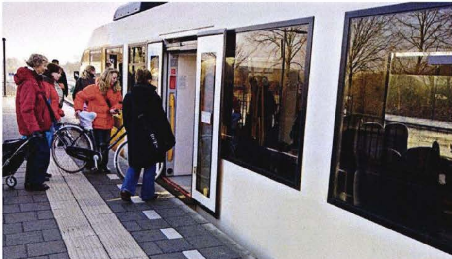
EEN GELIJKVLOERSE INSTAP IS VOOR ALLE REIZIGERS COMFORTABEL

Onbelemmerd reizen is een groot goed voor iedereen in Nederland, dus ook voor mensen met een beperking. Een toegankelijk spoorstelsel staat dan ook niet voor niets hoog op de agenda van het Rijk, de betrokken belangenorganisaties en de spoorsector. In de Lange Termijn Spooragenda die het ministerie van IenM in 2014 presenteerde, is het verbeteren van de toegankelijkheid van treinen en stations één van de belangrijke doelen. Bij het realiseren van een toegankelijk spoorstelsel is het uitgangspunt dat een reis zonder drempels de wens is van alle reizigers en dus niet alleen van reizigers met een beperking. Alle reizigers zijn immers gebaat bij goed bereikbare perrons, een gelijkvloerse instap in treinen is voor alle reizigers comfortabel en reisinformatie die zowel auditief als visueel wordt aangeboden, wordt door alle reizigers gewaardeerd. Vanuit deze visie werken NS en ProRail samen met de betrokken belangenorganisaties, de (regionale) concessieverleners en vervoerders aan het wegnemen van drempels en daarmee aan een toegankelijke treinreis. Een toegankelijk spoorstelsel is niet van vandaag op morgen gerealiseerd. Maar door het stap voor stap implementeren van de maatregelen uit het implementatieplan wordt reizen met de trein steeds gemakkelijker 3 .