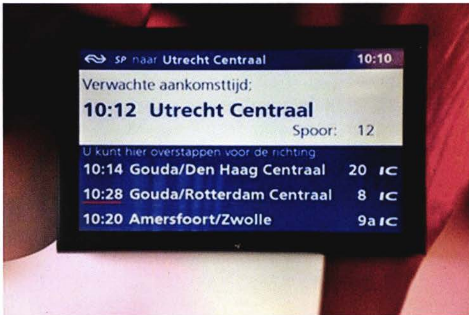
STEDS MEER INFORMATIE IS ZICHTBAAR OP DE REISINFORMATIESCHERMEN

Voor de stations heeft NS, in overleg met de belangenorganisaties, nieuwe gele vertrekstaten ontwikkeld die beter aansluiten op de digitale schermen met vertrekinformatie. Daarnaast werkt NS aan het verbeteren van de algemene verstoringinformatie. Zo wordt de komende jaren informatie over actuele werkzaamheden en verstoringen niet alleen via de omroep, maar ook via de digitale reisinformatieschermen aangeboden. Dit is een stap voorwaarts voor reizigers met een auditieve beperking.