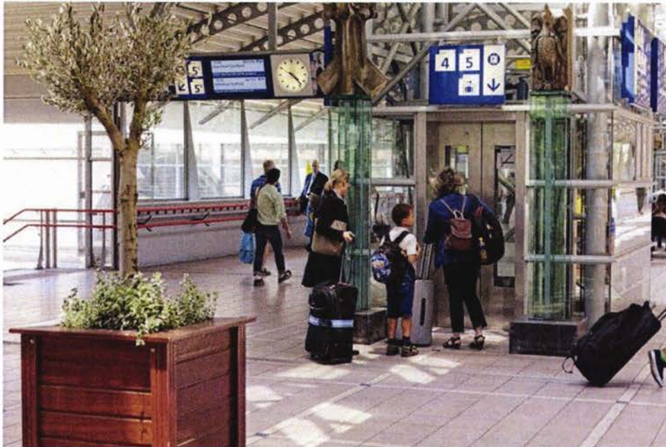
SKYWALKER BIEDT DE MOGELIJKHEID OM REIZIGERS INZICHT TE GEVEN IN ACTUELE LIFTSTORINGEN

Naast de liften op 35 stations, die ProRail voor 2020 aansluit op Skywalker, is de vuistregel dat alle nieuw te bouwen liften worden aangesloten op Skywalker. Hierbij wordt opgemerkt dat het kan voorkomen dat er stations zijn waarbij niet alle liften aangesloten zijn vanwege de gefaseerde uitrol.