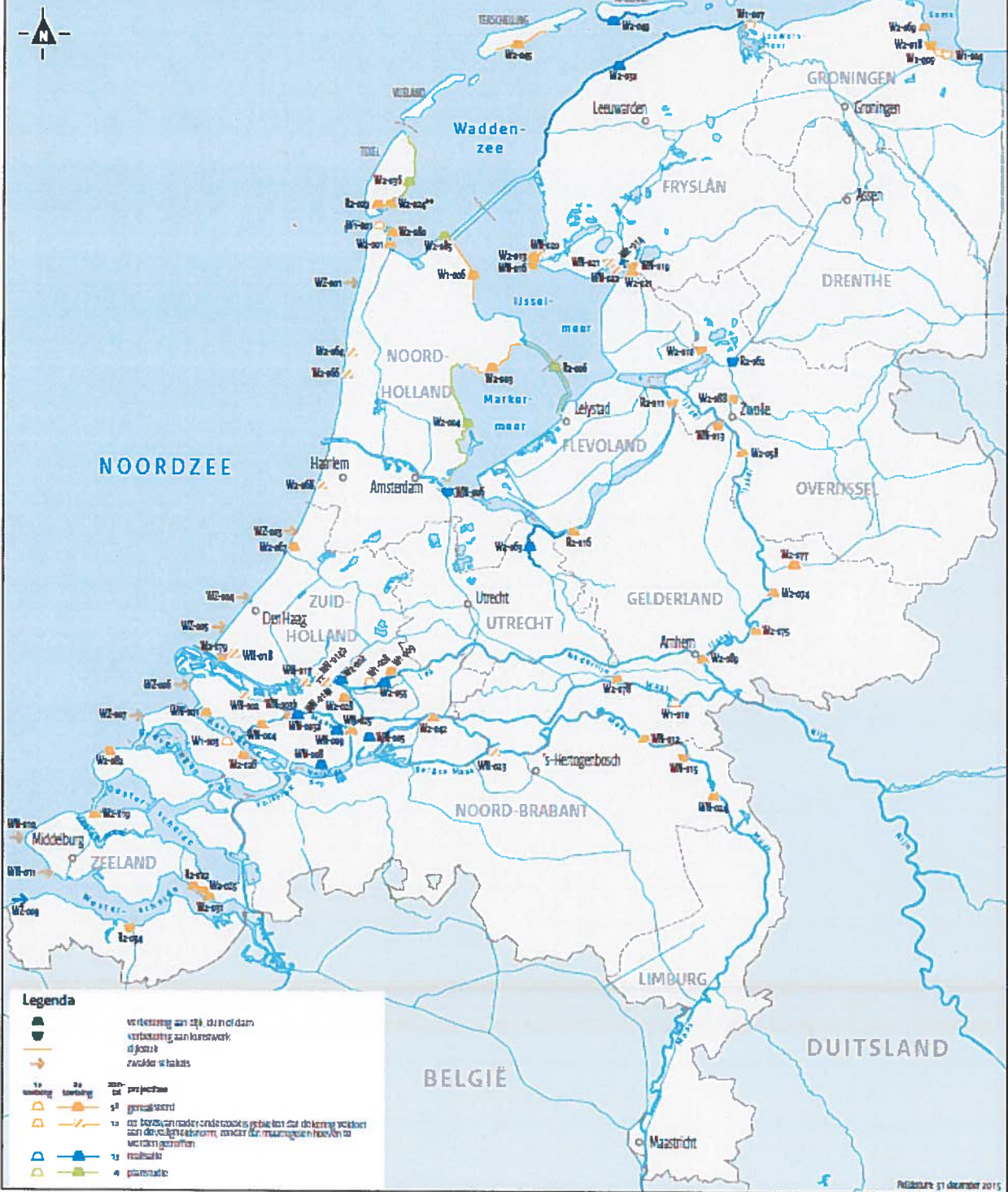
Figuur 2 Actuele scope van het programma, peildatum 31 december 2015