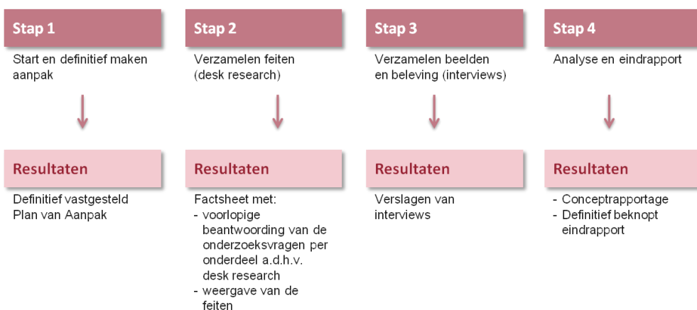
Figuur 2. Gefaseerde aanpak evaluatie Kennisplatform Windenergie

Tussentijds is met de opdrachtgever contact geweest over de voortgang. De feiten en meningen zijn vervolgens geanalyseerd. Tot slot zijn bevindingen geordend en heeft een afweging plaatsgevonden over het beantwoorden van de onderzoeksvragen.