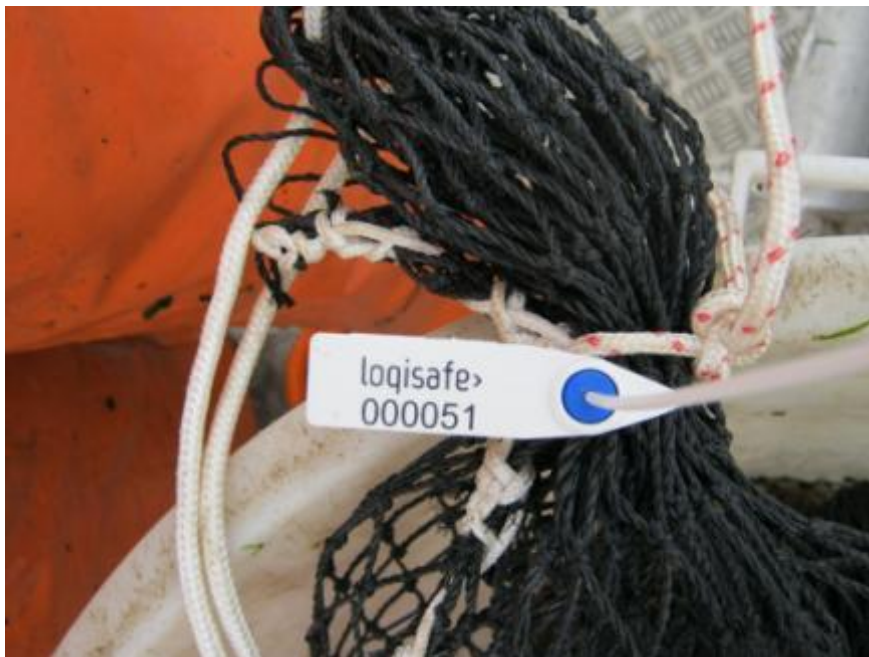
Zegel met uniek zegelnummer