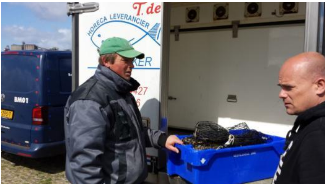
Overdracht van bak met verzegelde netten aan transporteur voor vervoer naar verwerkingsbedrijf in Urk