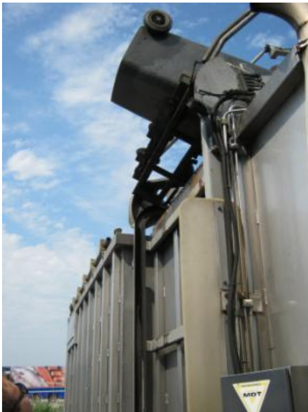
5 juni 2015: Klike's worden geleegd in vrachtwagen Rendac