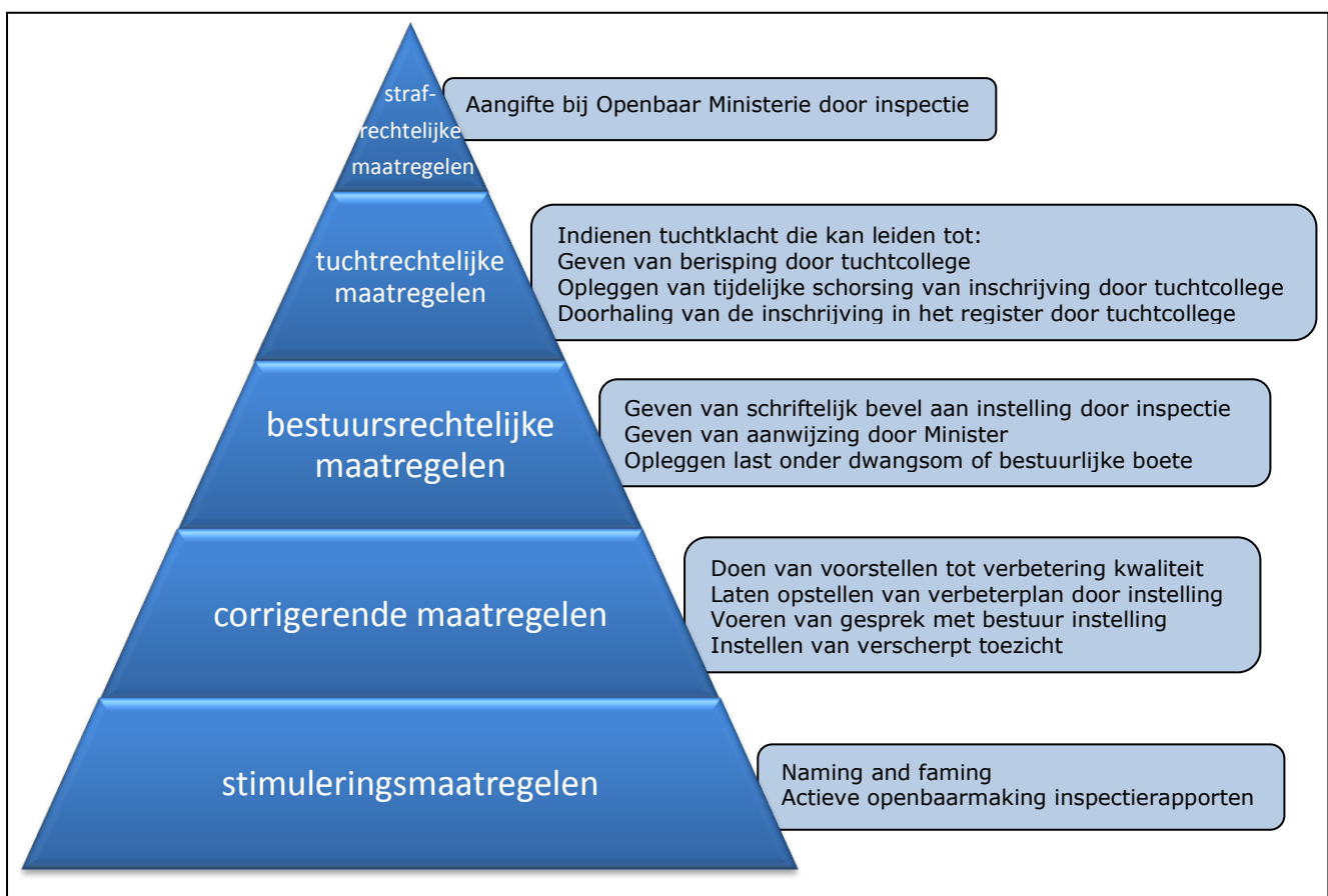
Figuur 1: interventiepiramide

Dit vertrouwen in het lerend vermogen van de sector is echter slechts één kant van de medaille. Als de inspectie vaststelt dat het niveau van de zorg onvoldoende is of als zij risico's ziet, dan grijpt zij in bij de aanbieder of individuele beroepsbeoefenaar. Op basis van de Jeugdwet heeft de inspectie hierbij de beschikking over een aantal interventies . De interventiepiramide in figuur 1 maakt duidelijk dat sprake is van escalerende interventies. De minst ingrijpende interventies staan onderaan in de piramide en de meest ingrijpende bovenaan. Bij elk soort interventie staan in de piramide voorbeelden hiervan weergegeven. De oplopende zwaarte van sancties is een motivatie voor de aanbieder of individuele beroepsbeoefenaar om de kwaliteit van zijn werk te verbeteren, om risico's te reduceren of te voorkomen en om de naleving te bevorderen. Dat er sprake is van escalatie wil overigens niet zeggen dat er maar voor één van de beschikbare interventies kan worden gekozen of dat er altijd moet worden gestart met het inzetten van de minst ingrijpende interventie.