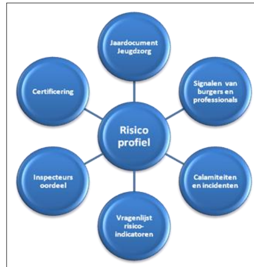
Figuur 2: risicomodel

De inspectie houdt risicogebaseerd toezicht . Dit houdt in dat zij toezicht uitvoert op die plaatsen waar volgens haar inschatting de risico's van onveiligheid en/of kwaliteitstekorten voor jongeren het grootst zijn. Die inschatting maakt de inspectie op basis van zowel interne als externe informatie, waarbij ook het professionele oordeel van de inspecteurs een belangrijke rol speelt.