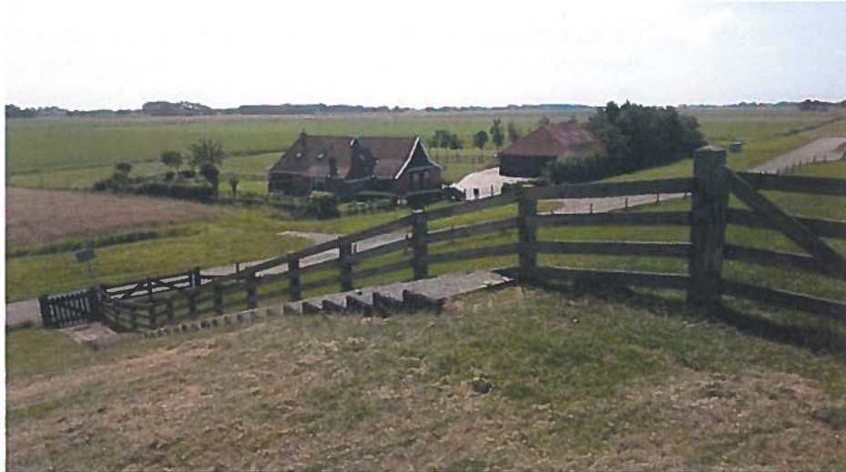
Het Friese waddegebied bij Ferwerd. Er vinden hier nauwelijks ontwikkelingen plaats.

Enkele gemeenten zijn actief bezig met het behoud van de landschappelijke kwaliteiten van Waddenzee, bijvoorbeeld voor wat betreft de duisternis. Zo is in Franekeradeel in een strook langs de Waddenzee de straatverlichting achterwege gelaten en worden kassen aan de zijkant afgeschermd. Verdere uitbreiding van de glastuinbouw is voorzien, waarbij afspraken zijn gemaakt over beperking van de lichtuitstraling. Texel wil reguliere verlichting vervangen door dimbare led-lampen.