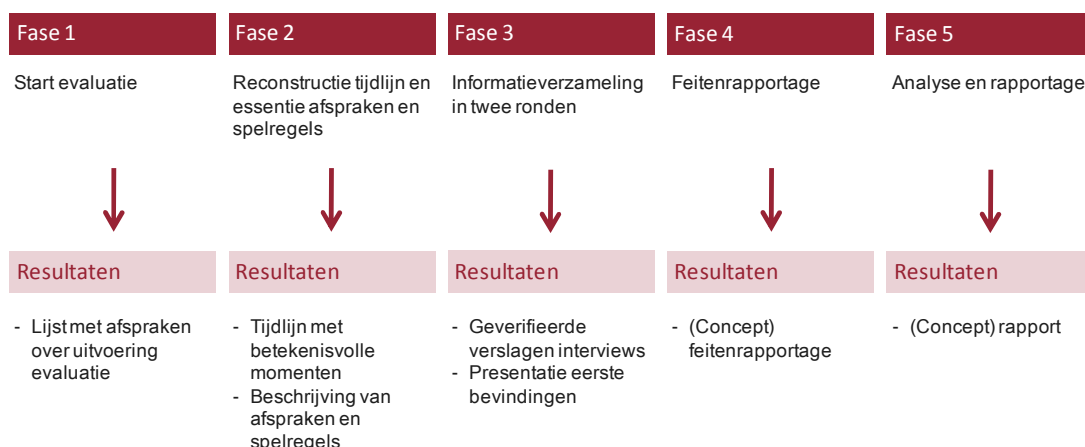
Figuur 1. Gefaseerde aanpak evaluatie besluitvorming, informatie-uitwisseling en projectbeheersing OV SAAL KT cluster c en Doorstroomstation Utrecht

De evaluatie is uitgevoerd in vijf fasen (zie figuur 1).