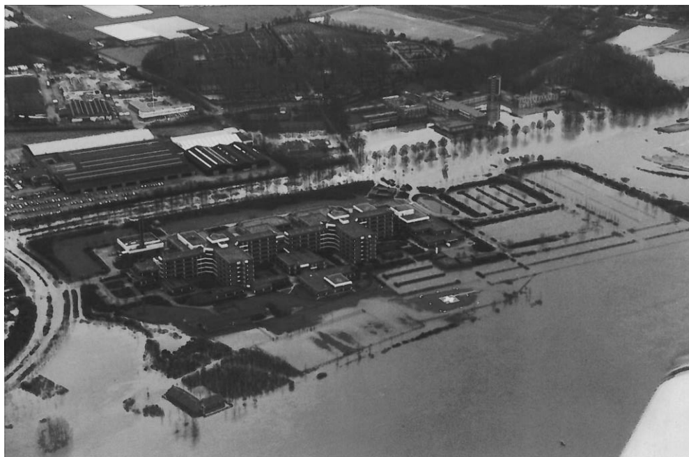
Figuur 2 Het Venlose St. Maartens Gasthuis (thans VieCuri MC) helemaal omsloten door het Maaswater (Bron: Kerst in het Water, Watersnoodramp 1993, Dagblad voor Noord-Limburg).

Na de overstroming in 1995 is een dijk aangelegd, die het ziekenhuisterrein afgrenst van de Maas. In de zomer van 2009 ontstond opnieuw wateroverlast, dit keer als gevolg van kortstondige, extreem hevige regenval. Het gevolg was dat: