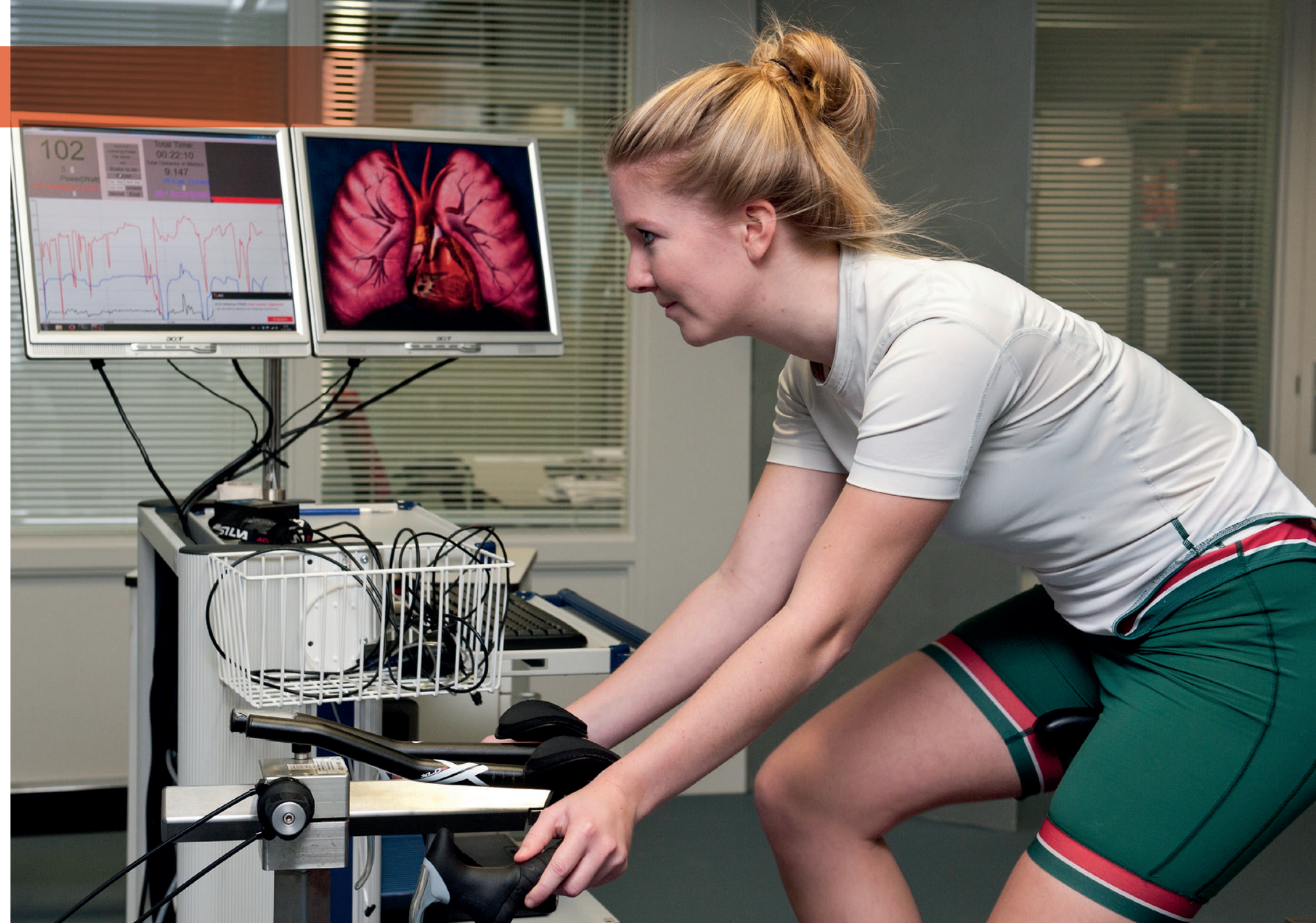
Foto: Meten is weten op InnoSportLab Papendal