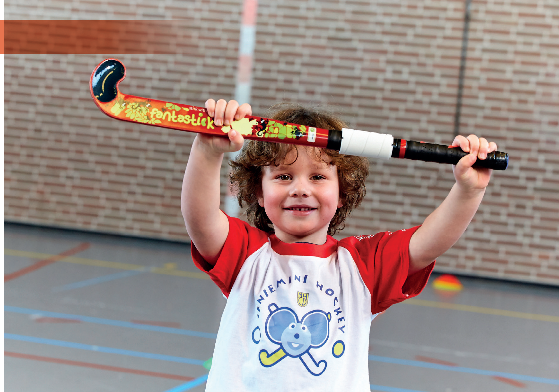
De Fantastick is een innovatieve junior hockeystick speciaal ontwikkeld voor kinderen tussen 3 en 7 jaar

Er wordt aan de sport, het bedrijfsleven, de overheden en de wetenschap gevraagd om deze ingediende voorstellen op hun merites (mee) te beoordelen. Er zal op basis van de input uit het netwerk en de gestelde criteria een transparante keuze worden gemaakt voor de beste voorstellen.