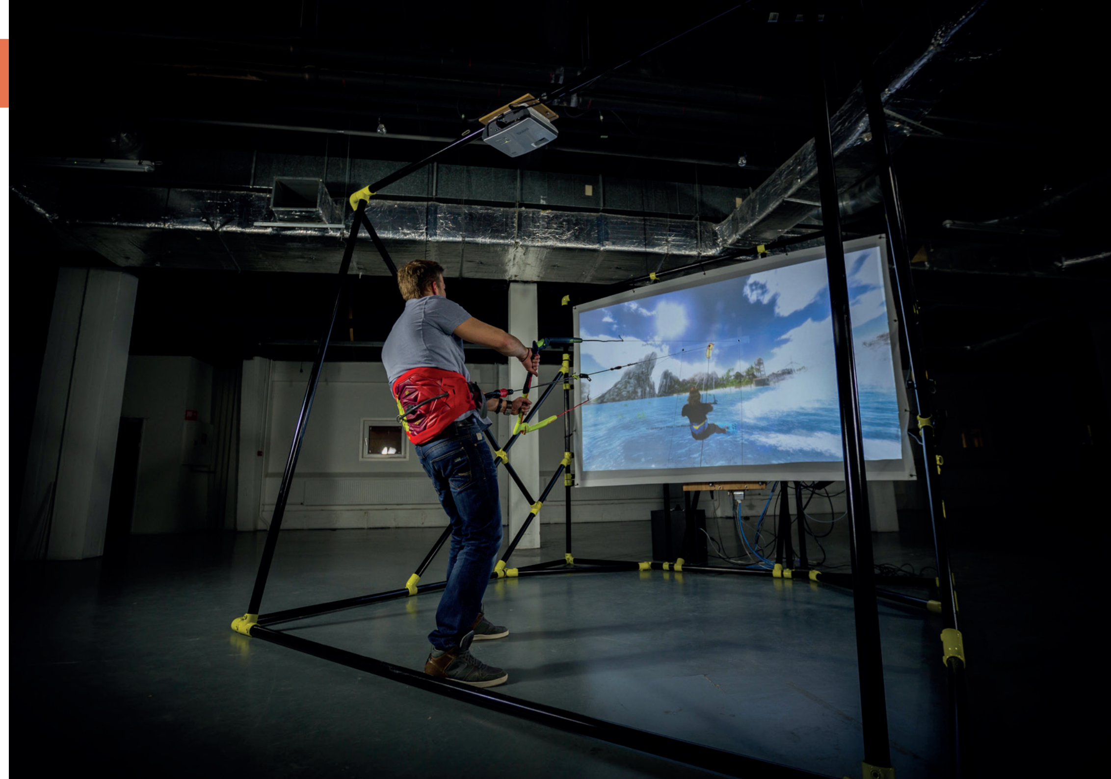
Kite Sim is de eerste realistische kitesurfsimulator