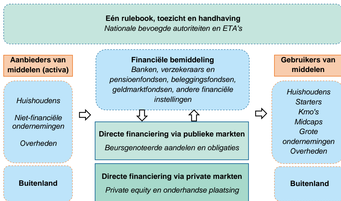
Grafiek 1. Gestileerd beeld van de kapitaalmarkten in het bredere financiële systeem

De kapitaalmarkten zijn in de jongste decennia in de EU gegroeid. De totale waarde van de EU-aandelenmarkten bijvoorbeeld bedroeg eind 2013 8,4 biljoen EUR (ongeveer 65% van het bbp), tegenover 1,3 biljoen in 1992 (22% van het bbp). De totale waarde van de uitstaande obligaties bedroeg meer dan 22,3 biljoen EUR (171 % van het bbp) in 2013, tegenover 4,7 biljoen EUR (74 % van het bbp) in 1992 3 .