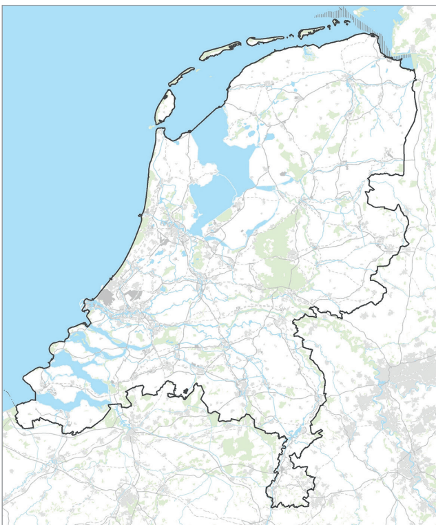
Figuur 1 - Plangebied

Bij de beoordeling van effecten van deze activiteiten wordt ook gekeken welke effecten deze activiteiten hebben op andere activiteiten in de onder- of bovengrond, zoals bijvoorbeeld landbouw en natuur. De effecten van mogelijke schaliegaswinning worden in het planMER voor de Structuurvisie Schaliegas onderzocht. De Structuurvisie Schaliegas zal integraal onderdeel uitmaken van de Structuurvisie Ondergrond.