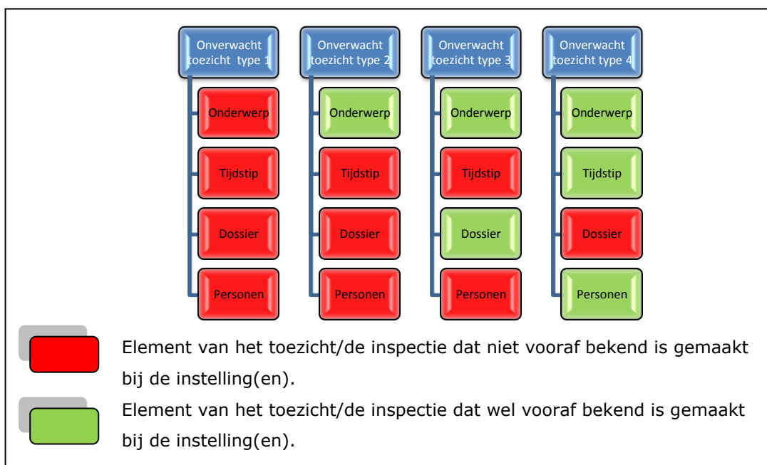
Figuur 2: elementen onverwacht toezicht

Het is niet altijd nodig alle elementen onbekend te houden om goed toezicht uit te voeren. Soms is het nodig om wel concrete afspraken te maken over het bezoek en het toezicht, zodat men er zeker van is dat mensen met wie moet worden gesproken in huis zijn.