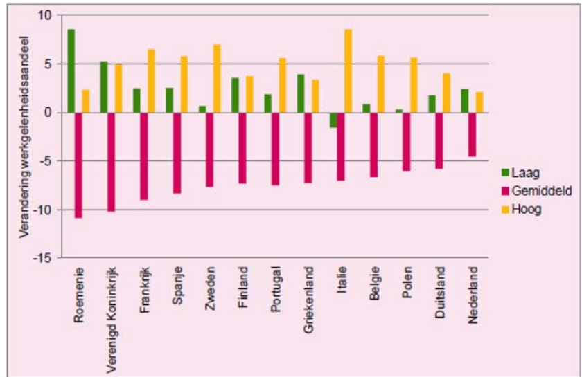
Figuur 2: De verandering van werkgelegenheidsaandelen van laag, gemiddeld en hoog betaalde banen in Europa (1998–2010).