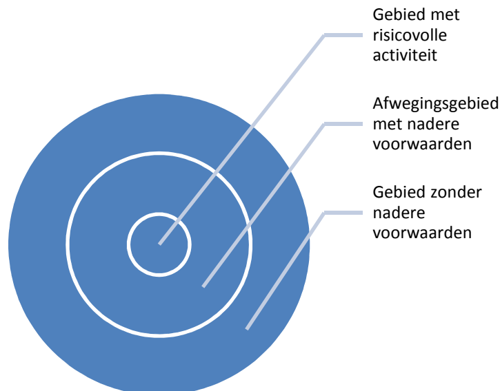
Figuur 2: schillenmodel

Door op de plankaart rondom een bestaande risicobron concrete gebieden op te nemen waar nadere voorwaarden aan de ruimtelijke inrichting zijn verbonden vanwege de omgevingsveiligheid, wordt bereikt dat omgevingsveiligheid vroeg in het planproces in beeld is. De initiatiefnemer komt deze informatie dan als kader tegen. Deze nadere voorwaarden kunnen uiteenlopen van algemene regels tot maatwerk in afstemming met de omgevingsdienst en/of veiligheidsregio. Daarbij kunnen bijvoorbeeld de beperkingen in de zelfredzaamheid van bewoners een rol spelen. Door rekening te houden met deze nadere voorwaarden kan een intrinsiek veiliger gebied of gebouw worden ontworpen (zie figuur 2: schillenmodel).