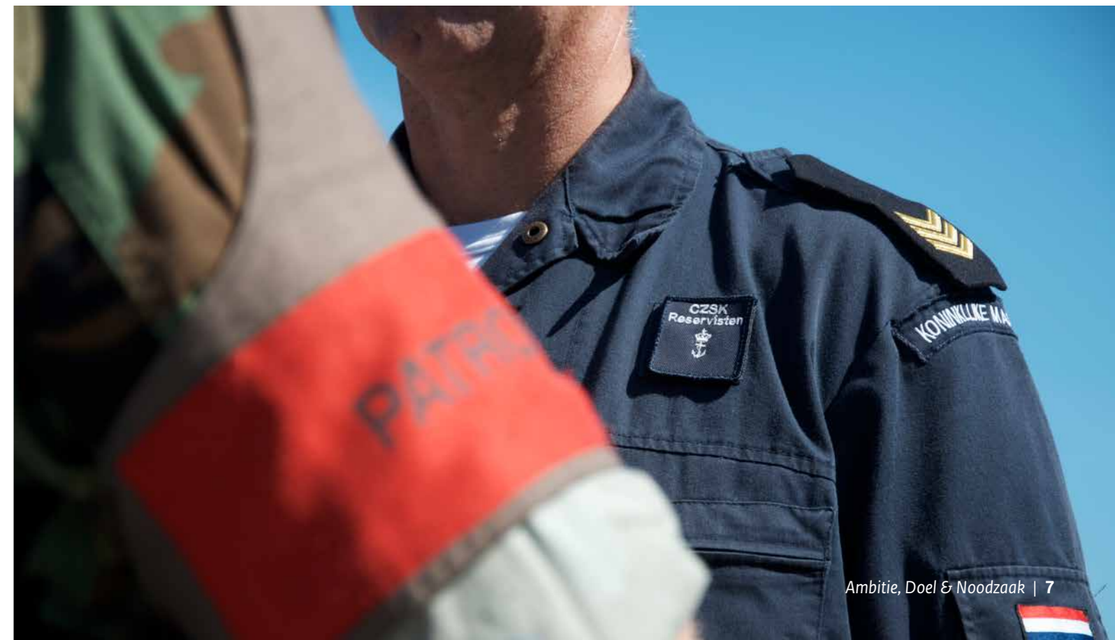
Reservisten bij de Koninklijke Marine

De krijgsmacht zal het voorbeeld van de rest van Nederland volgen en nieuwe constructies/mogelijkheden bedenken omtrent flexibel werken. Het spreekt voor zich dat reservisten - flexwerkers bij uitstek - in deze constructies/mogelijkheden een voorname rol kunnen spelen.