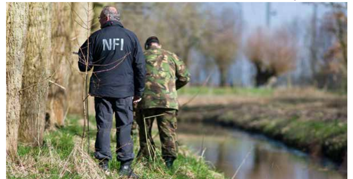
Ondersteuning civiele autoriteiten