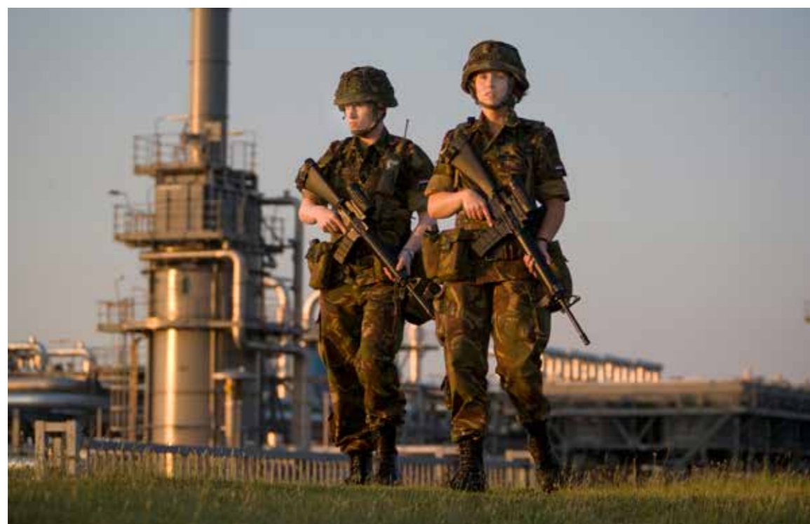
Reservisten van de Natres