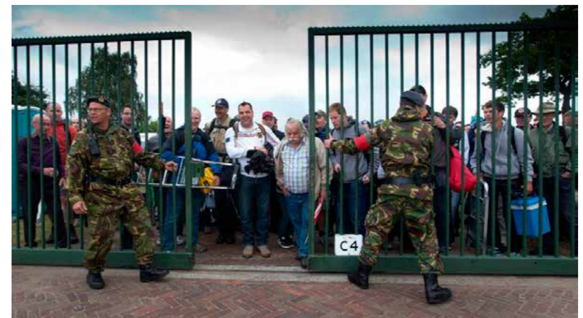
Groep Luchtmacht Reserve