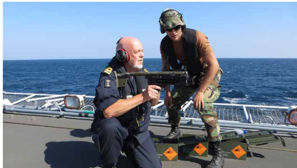
Reservist bij operatie Atalanta