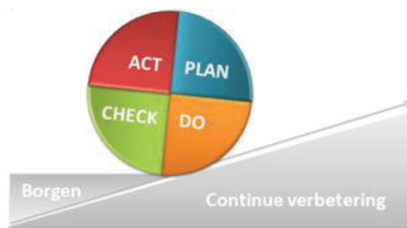
Figuur 2: Kwaliteitscyclus/ Deming cyclus