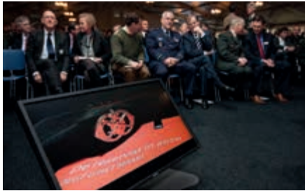
Reservistensymposium 2 december 2013

Om reservisten en beroepsmilitairen te informeren en consulteren over het reservistenbeleid van de toekomst, is op 2 december 2013 in Hilversum een symposium reservistenbeleid georganiseerd. Op dit symposium, waar meer dan 600 reservisten en militairen bijeen waren, deelden vooraanstaande sprekers uit het bedrijfsleven en de vakbonden hun visie op het toekomstig reservistenbeleid. De uitkomsten van het symposium worden gebruikt bij het opstellen van een nieuwe nota over het reservistenbeleid, die naar verwachting in het voorjaar van 2014 aan de Tweede Kamer wordt aangeboden.