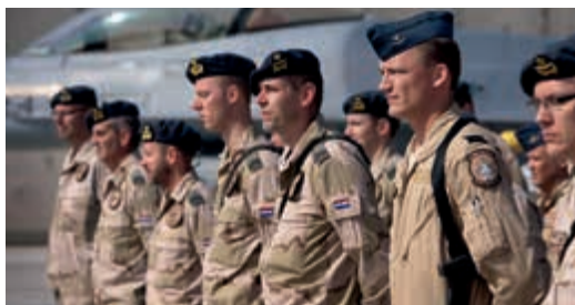
Bevorderen doorgroei hoogwaardig personeel