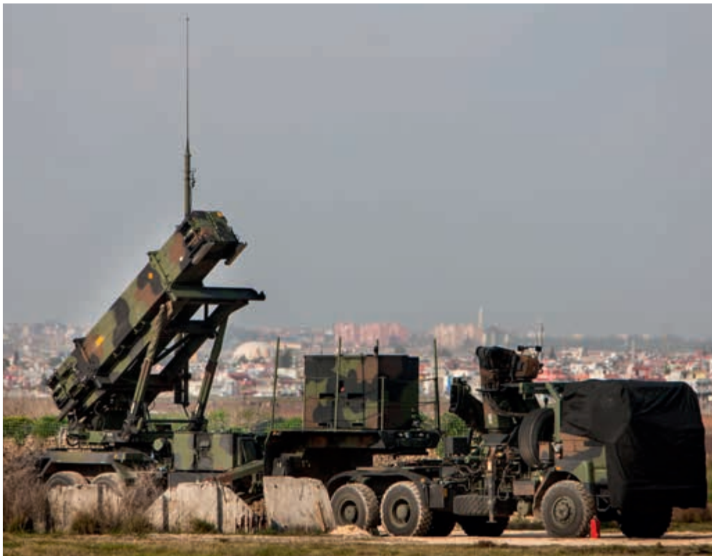
Patriot luchtverdediging bij Adana, Turkije

Na het kabinetsbesluit in december 2012 zijn eind januari ruim 250 Nederlandse militairen naar Turkije vertrokken die deel uitmaken van de Patriot luchtverdedigingseenheid. De Ballistic Missile Defence Taskforce (BMDTF) is bij de Turkse stad Adana gestationeerd om de bevolking en het grondgebied te beschermen tegen eventuele aanvallen met ballistische raketten vanuit Syrië. Naar aanleiding van een herhaald Turks verzoek aan de NAVO heeft het kabinet medio november besloten de Nederlandse Patriotmissie in Turkije met een termijn van twaalf maanden te verlengen tot eind januari 2015.