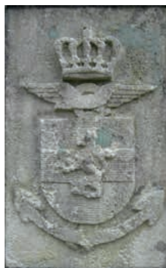
Wapen IGK bij de ingang van De Zwaluwenberg

De laatste jaren bevindt Defensie zich in roerige tijden. Veranderingen in de wereld om ons heen hebben vanzelfsprekend effect op de inzet van ons personeel, op het defensiebeleid en op de uitvoering van de taken. Ook in de toekomst zullen aanpassingen van onze organisatie nodig blijven. Bij de vele ontwikkelingen die ons raken, mogen we het welbevinden van onze mensen niet uit het oog verliezen. De Inspecteur-Generaal der Krijgsmacht zal zich daar altijd voor inspannen!