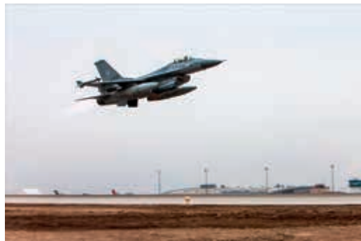
F-16 take off Mazar-e-Sharif, Afghanistan

Vanuit Mazar-e-Sharif ondersteunt de Air Task Force (ATF) met vier Nederlandse F-16's en 120 militairen nog altijd de International Security Assistance Force (ISAF) in Afghanistan. Vanaf deze locatie sporen de toestellen geïmproviseerde explosieven op met behulp van het Recce Lite -fotoverkenningssysteem en beschermen zij Afghaanse en internationale eenheden in acute noodsituaties. De Koninklijke Luchtmacht is al sinds 2002 actief boven Afghanistan. Het vierentwintigste Nederlandse luchtmacht detachement heeft in oktober 2013 de 10.000ste missie boven Afghanistan gevlogen.