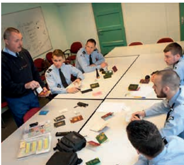
De focus verleggen naar een nieuwe identiteit

Commandanten behouden gedurende het gehele herplaatsingstraject de verantwoordelijkheid voor P-zorgtaken. Dit wordt niet altijd gevoeld door de commandant, die zijn focus immers heeft gericht op het zittende personeel en de taakuitoefening in de nieuwe organisatie. Daarnaast is de herplaatsingskandidaat – behalve in ‘het systeem’ – feitelijk niet meer zichtbaar voor hem. P&O-organisaties die de commandant in hun rol ondersteunen, worstelen daarnaast met het dilemma waar zij de overgebleven capaciteit voor moeten inzetten: voor hen die vertrekken of juist voor het blijvend personeel.