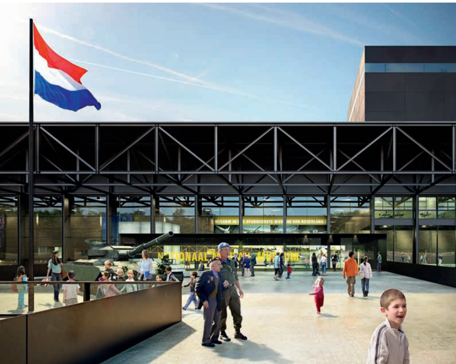
Artist impression Nationaal Militair Museum (architecten Felix Claus Dick van Wageningen Architecten. Beeldeigenaar: BMD vof België)