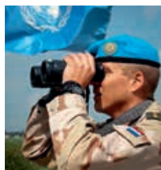
UNTSO-waarnemer aan de grens in Syrië

Nederlandse waarnemers maken al decennia lang deel uit van de United Nations Truce Supervision Organization (UNTSO) en dragen zo bij aan het handhaven van de afgesproken bestandslijnen tussen Libanon, Syrië en Israël. Vanwege ontwikkelingen in de veiligheidssituatie zijn de UNTSO-waarnemers teruggetrokken naar de Israëlische zijde van de bestandslijn.