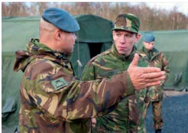
Balans nodig tussen instroom VeVa niveau 3 en doorstroom

Bij uitvoerende commandanten en personeel op alle niveaus van de werkvloer leeft onvrede over de beperkingen in de doorstroommogelijkheden van manschappen naar de opleiding tot onderofficier en de (vermeende) onbalans ten opzichte van de instroom van VeVa niveau 3 leerlingen. Men heeft de indruk dat veel menselijk kapitaal verloren gaat doordat korporaals met een ruime operationele ervaring en 'credits', maar ook met dure opleidingen, moeten uitstromen. Dit manifesteert zich bij alle operationele commando's, maar vooral bij het Commando Landstrijdkrachten. Door de reorganisatie, het verkleinen van de bovenbouw en het reserveren van plaatsen voor de niveau 3 VeVa-opleidingen was de doorstroom naar de Koninklijke Militaire School bij het Commando Landstrijdkrachten de afgelopen twee jaren zeer beperkt.