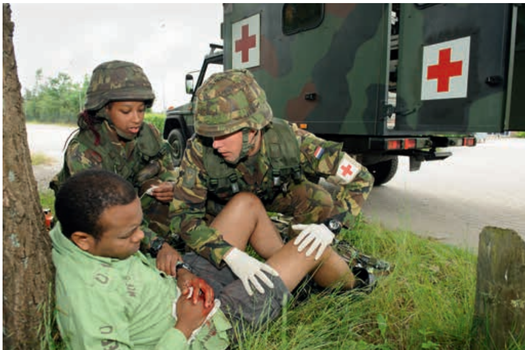
Noodhulp door personeel 400 gnkbat

weinig begrip voor de voorrang van de VeVa niveau 3-leerlingen ten opzichte van de ervaren manschappen bij de eenheid. Daarnaast vinden met name de onderofficieren dat Defensie onvoldoende werk maakt van het vertalen van leer- en werkervaring naar 'Eerder Verworven Competenties' (EVC's), die op de civiele markt begrepen worden. Ook constateren zij dat Defensie weinig doet om dit systeem voor het individu toegankelijk of inzichtelijk te maken.