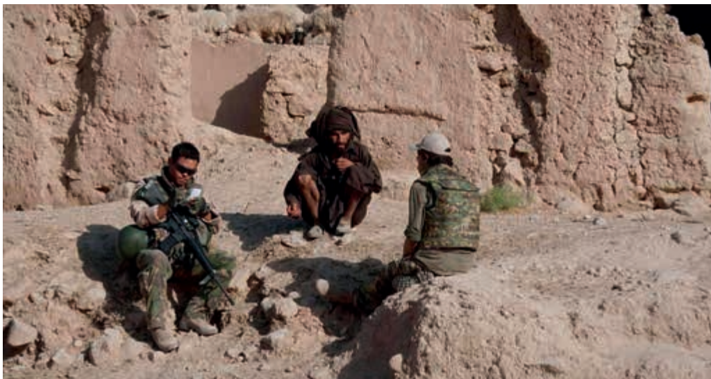
Extra aandacht voor tolken

De afgelopen jaren zijn gemilitariseerde Nederlandse burgers met een Afghaanse achtergrond ingezet als tolk ter ondersteuning van de Nederlandse ingezet in Afghanistan. Deze gemilitariseerde burgers met de status van reservist hebben na afloop van hun inzetperiode de dienst weer verlaten. Voor sommigen van hen is de inzet niet zonder gevolgen gebleven. Enkelen hebben de weg naar de IGK gevonden; anderen hebben zich tot de vakbonden gewend of hebben contact gezocht met Kamerleden. Van een aantal uitgezonden tolken is nog niet vastgesteld of een behoefte aan hulp aanwezig is. Achteraf is duidelijk dat de verantwoordelijkheid voor deze groep niet duidelijk was belegd. Deze problematiek is na enige aanloop onderkend en wordt geadresseerd door een plan van aanpak van het Dienstencentrum Re-integratie. De inzet van gemilitariseerde burgers heb ik besproken met de Commandant der Strijdkrachten. Een verbeterde aanpak bij nieuwe operaties moet dit soort situaties voorkomen.