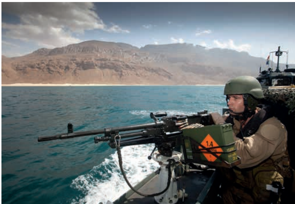
Piraterijbestrijding in de Golf van Aden

Defensie zet sinds 2009 voor de kust van Somalië verschillende middelen in voor de antipiraterijmissies van de NAVO en de Europese Unie. Door te patrouilleren vergroten de marineschepen de veiligheid langs de scheepvaartroutes bij Somalië en ontmoedigen en verstoren zij piraterij. Het kabinet besloot in november 2013 de deelname aan de antipiraterijmissies te verlengen tot eind 2014.