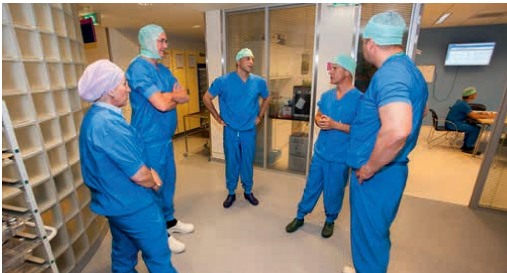
Ook aandacht voor verwerving bij het Centraal Militair Hospitaal

Bij het invoeren van specialistisch materieel is men vaak aangewezen op fabrieksopleidingen. Dit maakt een goede borging en 'follow-up' ten aanzien van het beheer en instandhouding van dit materiaal minder makkelijk. Al met al acht men het noodzakelijk dat nog eens goed wordt gekeken naar alle genoemde deelprocessen in de materieellogistieke keten om de inzetgereedheid van speciale eenheden in de toekomst te kunnen blijven garanderen.