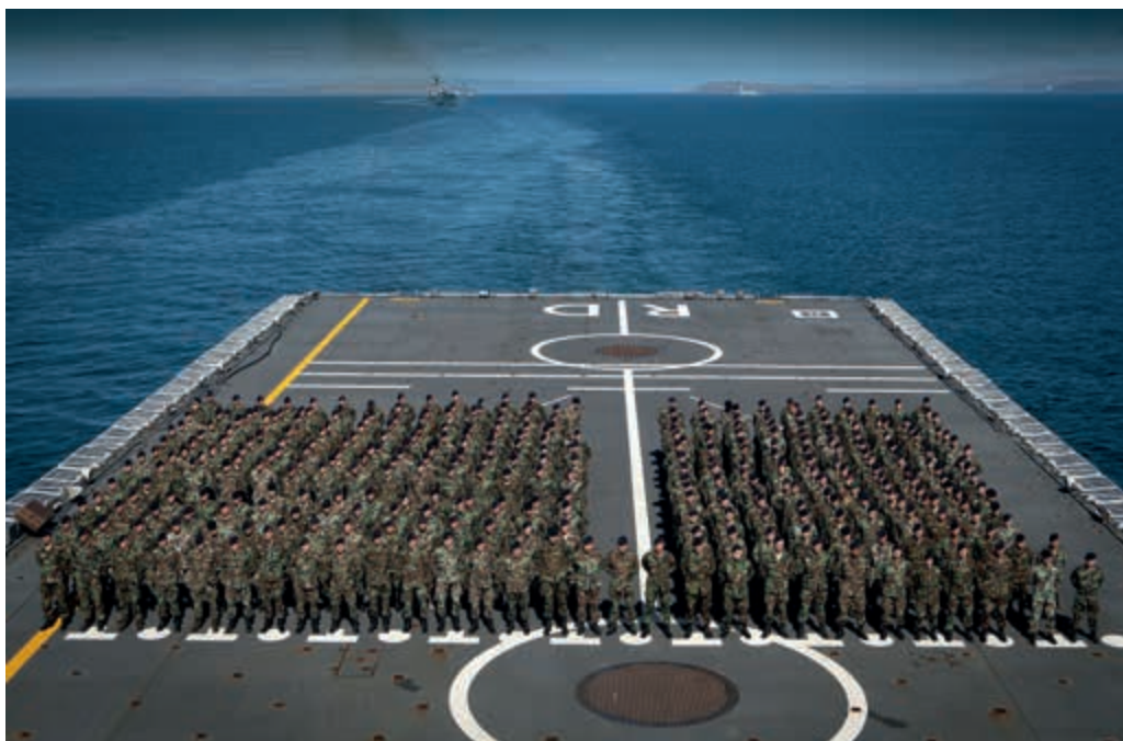
Commandant wil meer invloed op vulling

“Deels door de procesinrichting van mijn defensieonderdeel en deels door centralisering van besluitvorming richting Den Haag ervaar ik dat ik als commandant wel verantwoordelijk blijf maar (te) weinig regelruimte heb”.