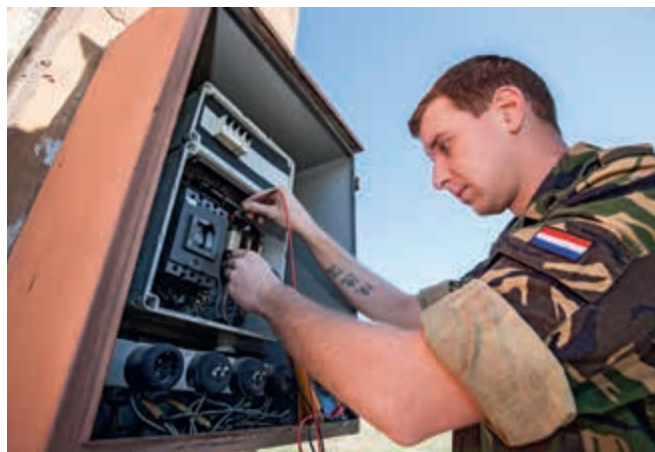
Schaarse capaciteit Patriot-missie

De verlenging van de Nederlandse Patriotmissie in Turkije heeft personele consequenties. Omdat Defensie op dit moment niet over voldoende specifieke capaciteit beschikt, kwam het generieke uitzendritme van 'één termijn op, twee termijnen af' voor een deel van het personeel bij een verlenging onder druk te staan. Om de belasting voor de militair en zijn thuisfont te beperken nam Defensie, mede op grond van gesprekken met het personeel en de centrales van overheidspersoneel, concrete maatregelen. In plaats van één lange rotatie is nu gekozen voor korte rotaties met een uitzendritme van 'één maand op, één maand af', waardoor de betrokken militairen minder lang aaneengesloten van huis zijn. Vanaf eind 2014 zal de gemiste uitzendbescherming alsnog worden genoten.