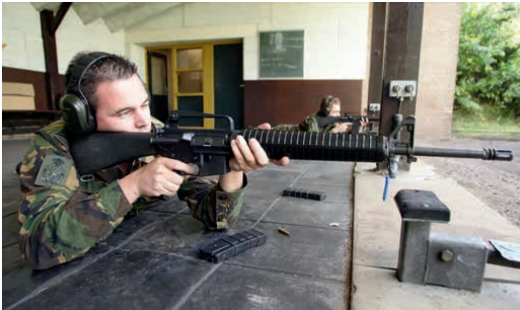
Behouden militaire basisvaardigheden

Voor militairen die buiten het eigen operationeel commando zijn geplaatst blijft het operationeel commando verantwoordelijk voor het faciliteren van de training voor de militaire basisvaardigheden. Door het Commando Landstrijdkrachten werden bijvoorbeeld tot en met 2012 elk jaar circa 700 opleidingsplaatsen voor een driedaagse cursus aangeboden. Deze opleidingen werden verzorgd door de schoolbataljons. Door de bezuinigingen in het opleidingsveld als gevolg van de beleidsbrief 2011 is de benodigde instructeurscapaciteit en daarmee de opleiding niet meer beschikbaar. Soortgelijke problematiek speelt ook bij andere operationele commando's.