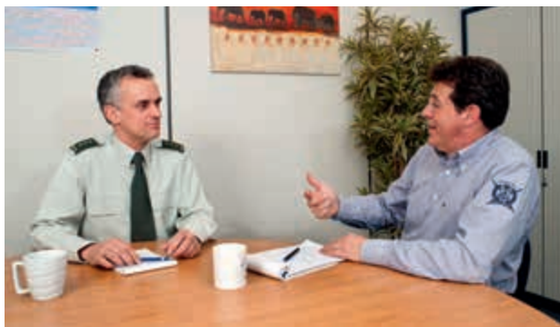
Bevoegdheden P&O te ruim?

Veel commandanten zien de rol van P&O verschuiven van ‘adviseur’ naar ‘bevoegde instantie’. Commandanten stellen vast dat P&O zelf veel bevoegdheden heeft; ‘P&O bepaalt’. Zij ervaren die dwingende handwijze vaak niet als een advies en missen soms kwaliteit en integraliteit van het P&O-advies.