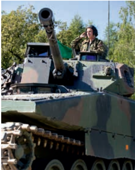
CV-90's beschikbaar als logistieke reserve

Bij de invoer van wapensystemen worden niet langer extra systemen aangeschaft voor gebruik bij opleidingseenheden. Daarvoor moeten voertuigen en systemen worden geleend van de operationele eenheden. In combinatie met de beperkte inzetbaarheid van de wapensystemen moeten eenheidscommandanten voortdurend prioriteiten stellen ten aanzien van de inzetbare systemen. Op groeps- en pelotonsniveau leidt dit tot beperkingen om te kunnen oefenen en trainen en daarmee tot motivatieproblemen bij manschappen en kaderleden. Een mogelijke oplossing kan ontstaan doordat 13 Gemechaniseerde Brigade zal worden omgevormd tot een gemotoriseerde brigade. Dit betekent dat de CV90's van 13 Gemechaniseerde Brigade zullen worden vervangen door de Bushmaster, Mercedes-Benz, Fennek en Boxer. De helft van de CV90's (44 stuks) zal worden afgestoten. De andere helft zal als logistieke reserve worden gebruikt en voor opleidings- en trainingsdoeleinden van 43 Gemechaniseerde Brigade, die de CV90 zal blijven gebruiken.