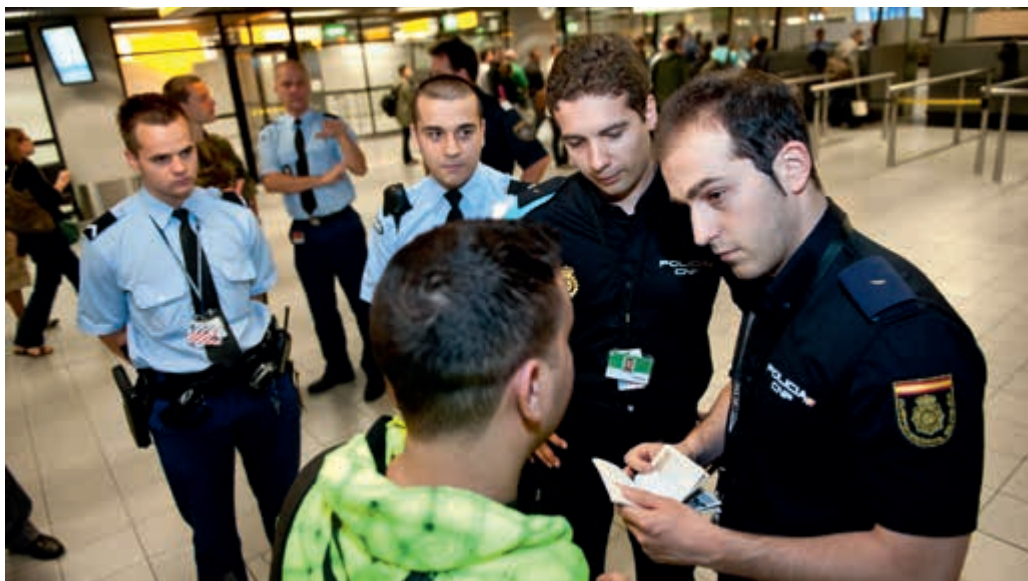
Samenwerking in het kader van Frontex

De belangrijkste taak van Frontières Extérieures (FRONTEX) is het versterken van de Europese grenscontroles. Daarvoor coördineert dit Europees agentschap gezamenlijke operaties ter zee, te land en in de lucht. De Koninklijke Marechaussee leverde in 2013 elf grenswachters voor de Europese luchthavens in Madrid, Boekarest, Milaan, Rome en Stockholm. De marechaussees staan nationale opsporingsdiensten bij in een doorlopende operatie van FRONTEX. Een kustwachtvliegtuig van het type Dornier vloog gedurende de maand december patrouilles in de buurt van het eiland Kreta en de Griekse kust als onderdeel van de surveillancetaak boven de Middellandse Zee rond Griekenland. De Koninklijke Marechaussee is met acht militairen ingezet voor de grensbewaking in Bulgarije. Zij staan daar de nationale opsporingsdiensten bij die de Europese buitengrenzen bewaken.