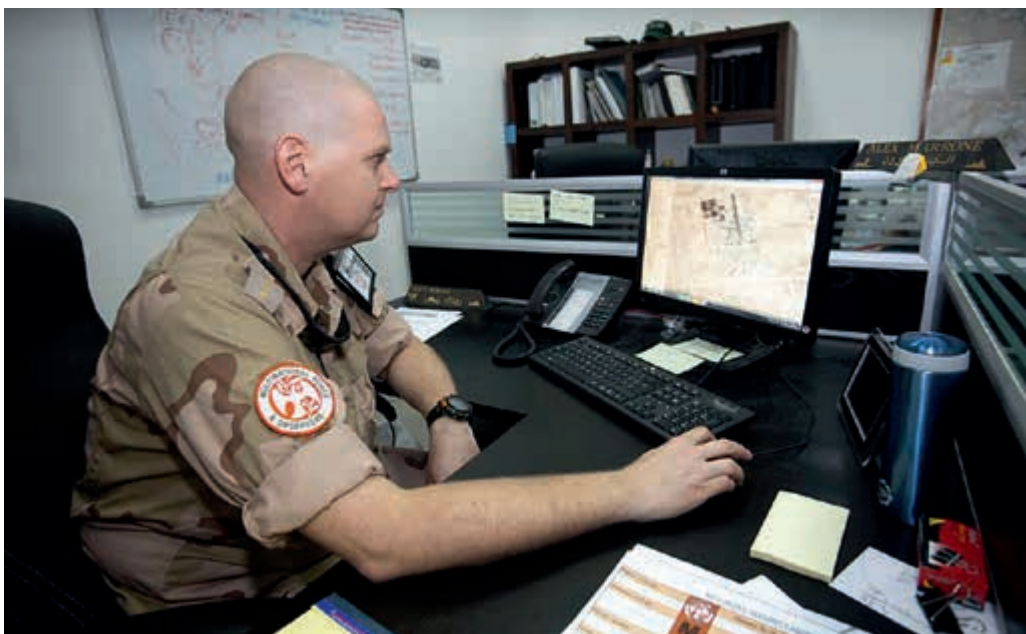
Solliciteren vanuit het buitenland is soms een uitdaging

is, het lastig vindt om een vervolgfunctie te bemachtigen. Dat geldt vooral wanneer de terugkeer naar Nederland eerder plaatsvindt dan was voorzien. Het DCIOD werd in dit verslagjaar geconfronteerd met mensen die vervroegd moesten terugkeren en voor wie nog geen vervolgplaatsing bekend was. Dit personeel komt dan terecht in de zogenaamde 'zwevende periode'. Een vervroegde terugkeer is sowieso ingrijpend voor deze werknemers en hun gezinnen omdat school, huur, emolumenten, fiscaliteiten, auto's en andere financiële consequenties een rol spelen. Vervroegde terugkeer leek daarbij vooral te worden veroorzaakt door een vermindering van het aantal Nederlandse functies in het internationaal functiebestand, in het bijzonder door de reorganisatie van de NATO Command Structure . Dit bestand bestond uit 491 functies en is met ruim honderd functies verkleind naar 387 functies. Mede doordat de precieze gevolgen van de reorganisatie bij Defensie pas in de loop van 2013 duidelijk werden, kon hier pas laat op worden ingespeeld. Zie ook mijn opmerkingen over functietoewijzing voor uitgezonden personeel in hoofdstuk 1.