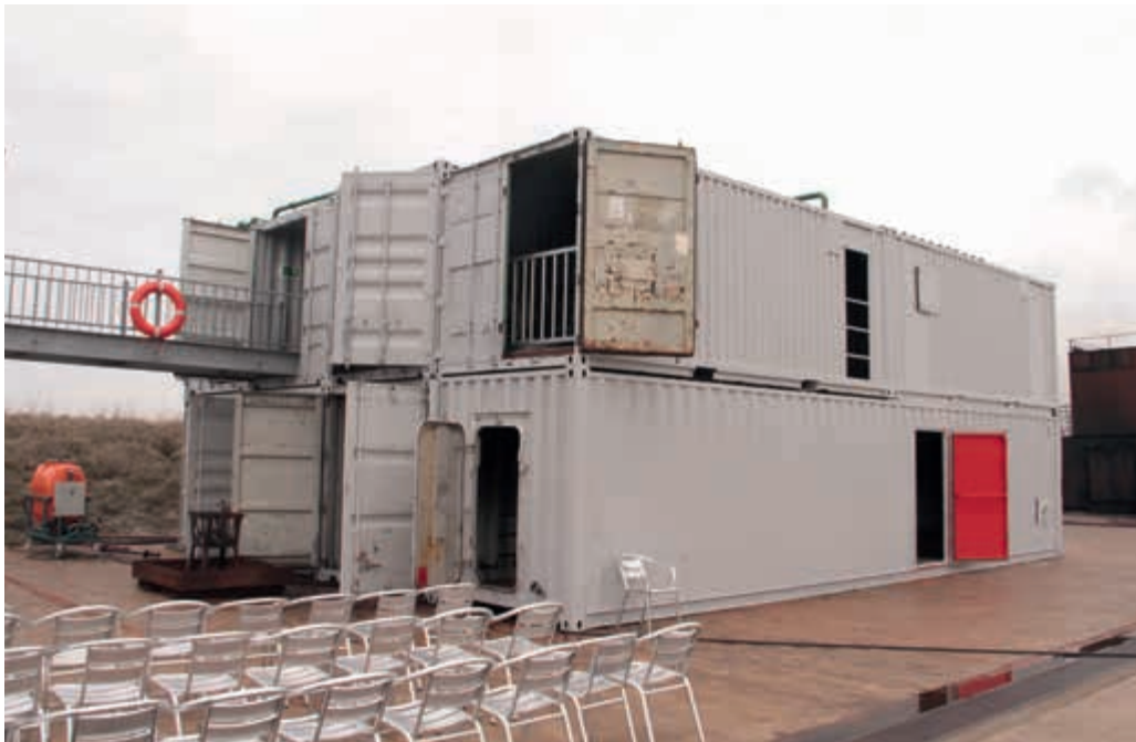
Boeve Mijlhoff: creativiteit in het scheppen van eigen voorzieningen

Door de reducties bij Defensie vindt een sanering van het vastgoed plaats. Dit, in combinatie met de herschikking van eenheden, leidt ertoe dat personeel wordt overgeplaatst naar nieuwe werklocaties. Op de werkvloer heerst een gevoel dat vastgoed belangrijker wordt gevonden dan goede personeelszorg. Hierdoor kunnen issues rondom de vulling ontstaan. Mijn advies is om bij de besluitvorming rondom vastgoed extra aandacht te schenken aan de personeelsaspecten, temeer daar de vulling en het behoud van schaars personeel in het geding zijn.