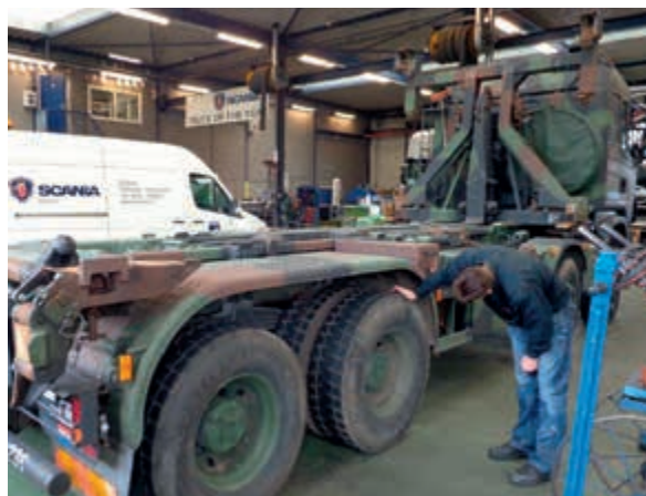
Uitbestede onderhoud bij Scania Veenendaal

Door sourcing ontstaan wel nieuwe afstemingsvragen en bestuurlijke complexiteit. Het proces is ingewikkeld en in de aard langdurig. Er staan veel projecten op de sourcing -agenda, die allemaal een langdurig beroep doen op schaarse technische en financiële kennis. Het verkrijgen van kosteninzicht vergt veel tijd. Opbrengsten en doorlooptijd worden nogal eens te optimistisch ingeschat, zodat de planning later moet worden aangepast.