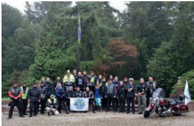
Nederlandse Veteranen Motorrijders

Inmiddels wordt op voortvarende wijze invulling gegeven aan de uitrol van een landelijk dekkend systeem voor de zogeheten 'nuldelijnsondersteuning'. De stichting De Basis heeft in dat kader met financiële steun van het Nationaal Fonds voor Vrede, Vrijheid en Veteranenzorg en onder verantwoordelijkheid van het Veteranenplatform een cursus ontwikkeld. Eind 2013 waren circa 180 vrijwilligers als 'nuldelijns helper' in het systeem geregistreerd, waarvan 80 personen de nieuw opgezette cursus hebben gevolgd. Zij hebben geleerd om de behoefte aan hulp bij een kameraad te onderkennen. Daarnaast kunnen zij ook optreden als eerste aanspreekpunt en eventueel begeleiding bieden bij het verkrijgen van hulp bij een bij het Landelijk