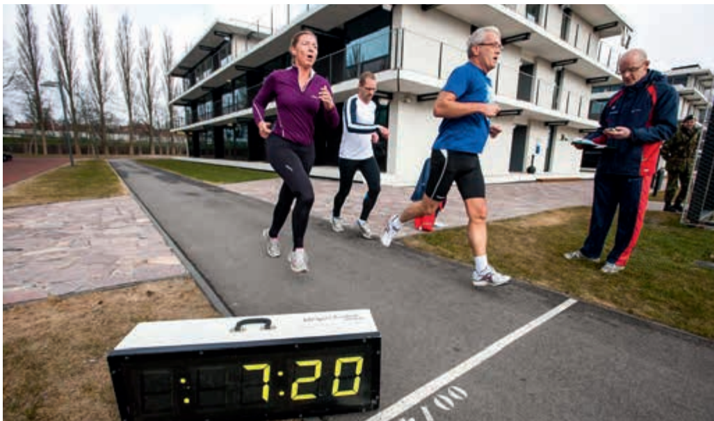
Afleggen Defensie-conditieproef

De Directie Aansturen Operationele Gereedheid erkent dat de praktische invulling van het bijhouden van de MBV vooral bij 'paarse' eenheden moeizaam verloopt. Als gevolg van de bezuinigingen is slechts een deel van de hiervoor benodigde extra instructeurscapaciteit toegekend en is de behoeftstelling van aanvullende onderwijsleermiddelen en infrastructuur doorgeschoven naar 2014.