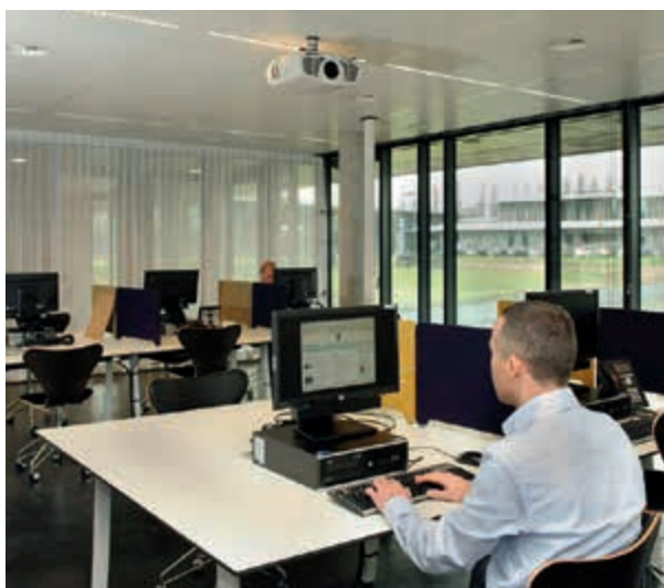
Het nieuwe werken op de Kromhoutkazerne

Een aantal ontwikkelingen was al voor dit verslagjaar in gang gezet. In het Jaarverslag 2012 is bijvoorbeeld de reorganisatie van de Defensie Materieelorganisatie genoemd, die in feite bestond uit vier reorganisaties. Die reorganisaties hebben in november 2013 de eindstatus bereikt. Naast de stafelementen bestaat de nieuwe Defensie Materieelorganisatie uit het Joint Informatievoorzieningscommando, de Directie Materieellogistiek en het Dienstencentrum Operations (het voormalige IVENT). Met de herinrichting van de Defensie Materieelorganisatie heeft een ontvlechting plaatsgevonden van de zogeheten systeem-logistieke bedrijven naar de operationele commando's. Tegelijkertijd is de projectorganisatie SPEER bij het Joint Informatievoorzieningscommando ondergebracht.