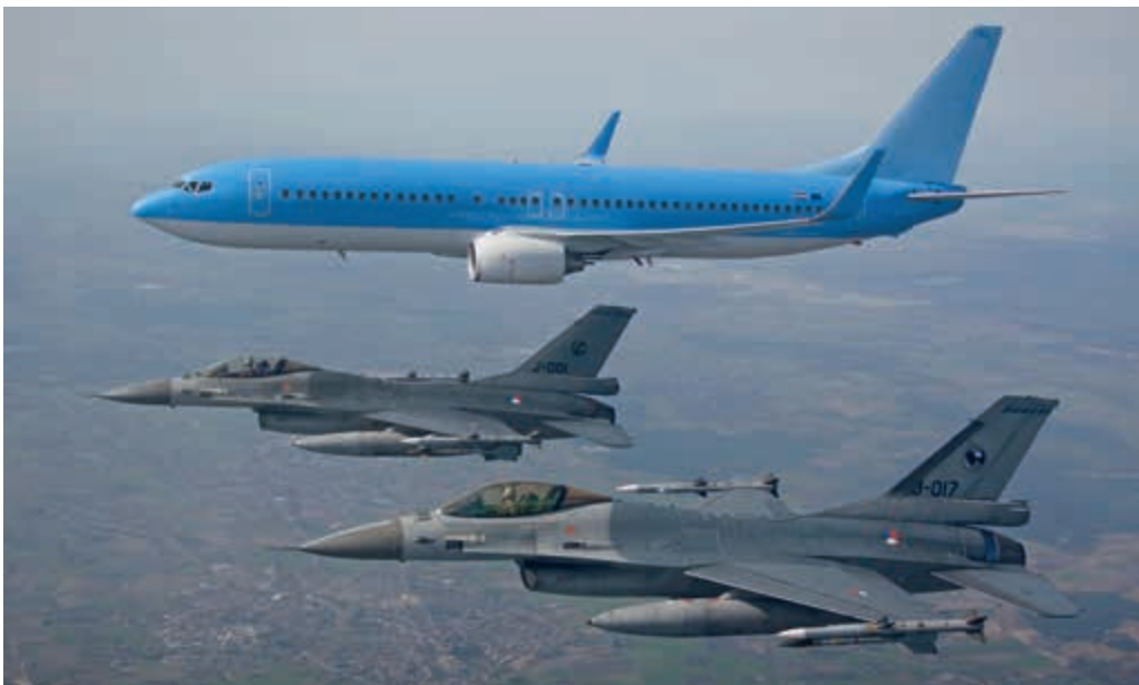
Effecten Arbeidstijdenwet soms ongewenst

Een commandant van een vliegbasis: “Samen met een andere basiscommandant ben ik verantwoordelijk voor de totale F-16 inzet van het Commando Luchtmacht, inclusief de Quick Reaction Alert. Deze QRA, bestaande uit twee F-16's, bewaakt 24 uur per dag, 365 dagen per jaar het nationale luchtruim, plus het door de NAVO toegewezen internationale deel van het luchtruim. De toepassing van de Arbeidstijdenwet heeft tot gevolg dat het personeel dat in één week twee keer een dergelijke QRA-dienst uitvoert, de hele week niet inzetbaar is voor andere diensten, ongeacht of de QRA is ingezet. De toepassing van de wet leidt tot beperkingen en wij zouden hier in de bedrijfsvoering flexibeler mee om willen gaan.”