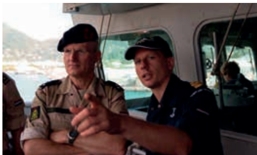
Werkbezoek IGR aan Zr. Ms. Van Speijk tijdens piraterijbestrijding

Van 25 juli tot 3 augustus 2013 heb ik een bezoek gebracht aan het personeel in de missiegebieden Zuid-Soedan, de Indische Oceaan, Afghanistan en Turkije. De doelstelling was kennis te nemen van de ervaringen, beleving en ideeën van ons uitgezonden personeel. Het accent lag daarbij op de taakuitvoering, aansturing, voorbereiding, instandhouding, ondersteuning en zorg.