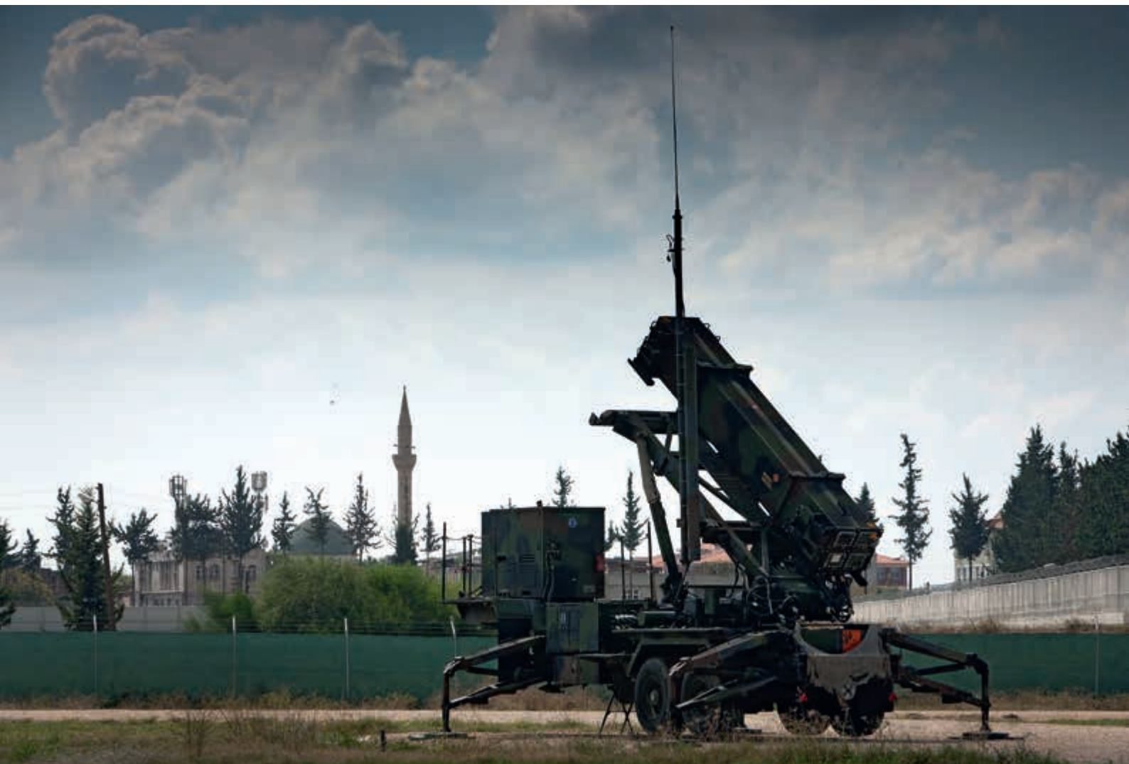
Patriots in stelling beveiligen Adana