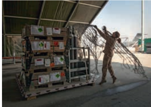
Operationele logistiek is een uitdaging

Naast de sollicitatiemogelijkheden en functie-toewijzing was ook de logistieke ondersteuning een belangrijk aandachtspunt bij het bezoek aan de missiegebieden. Breed werd aangegeven dat het integrale overzicht in de logistieke aanvoer vanuit Nederland verbetering behoeft. Dit knelpunt wordt versterkt doordat verschillende logistieke systemen van operationele commando's nog naast elkaar moeten worden gebruikt. Zowel leidinggevend als uitvoerend personeel in de bezochte missiegebieden adviseert een procesverantwoordelijke voor de totale keten van de materieellogistiek aan te wijzen.