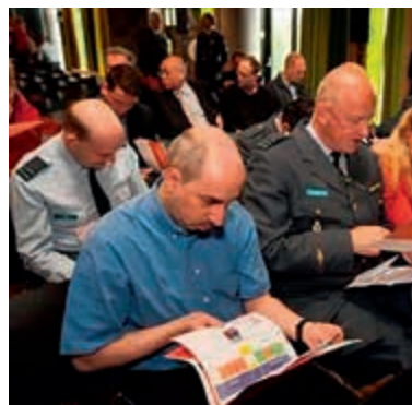
Banenmarkt in Oirschot

Het verslagjaar heeft vooral in het teken gestaan van de uitvoering en implementatie van de vele reorganisatieplannen. Veel medewerkers konden gelukkig relatief eenvoudig worden herplaatst, maar anderen zijn nog zoekend of hebben de organisatie al moeten verlaten. De reorganisatieplannen hebben in ieder geval geleid tot een aanzienlijk kleinere krijgsmacht. Bovendien is er door het verkleinen van de 'bovenbouw' en het hanteren van een strikte numerus fixus tijdelijk weinig doorstroomruimte voor het personeel. Het personeel heeft behoefte aan duidelijkheid. Enerzijds wordt het geconfronteerd met rigide regels rondom functieduurvervulling en anderzijds blijft het, vooral voor specialistisch personeel, onduidelijk wat hun toekomstperspectief is.