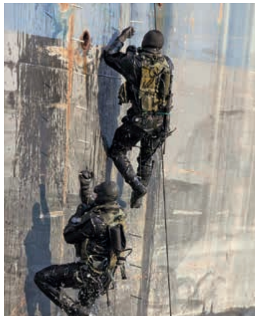
Langere plaatsingsduur voor specialisten gewenst

Ook in het werkbezoek aan de Netherlands Maritime Operations Forces (NLMARSOFF) werd aandacht gevraagd voor een betere invulling en borging van specialistische loopbanen. Specialistismen als kikvorsmannen en Mountainleaders vereisen langdurige en kostbare opleidings-trajecten, waarvan men bij voorkeur zo lang mogelijk rendement wil hebben in het operationele domein. Voor dit specialistische personeel zou in de ogen van het personeel een plaatsingsduur van minimaal drie jaar eerder regel dan uitzondering moeten zijn.