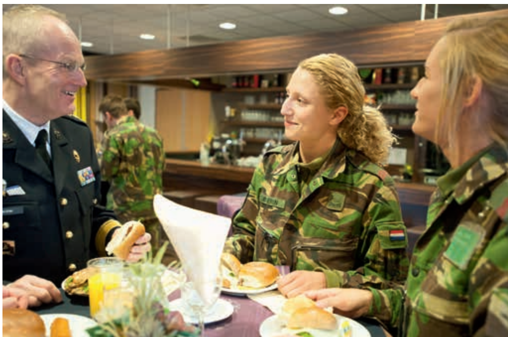
Werkbezoek IGK aan de staf van 13 Mechbrig

Zoals in iedere grote organisatie bestaat ook bij Defensie het risico van een kloof tussen beleid en uitvoering. Om de kans daarop te verkleinen verdiept de IGK zich voortdurend in de alledaagse praktijk 'op de werkvloer' en het effect dat Haagse beleidsmaatregelen daarop hebben. De Inspecteur-Generaal der Krijgsmacht en officieren van zijn staf bezoeken regelmatig alle werk-, oefen- en inzetlocaties van Defensie. Het is de bedoeling dat de Inspecteur-Generaal der Krijgsmacht alle onderdelen eens in de drie jaar bezoekt. Hij gebruikt deze bezoeken om de gevolgen van vastgesteld beleid in de praktijk terug te koppelen naar de commandanten van de Defensieonderdelen en de beleidsmakers. Daarnaast bieden deze contacten leiding gevenden de mogelijkheid met de Inspecteur-Generaal der Krijgsmacht problemen te bespreken die ze zelf niet kunnen oplossen.