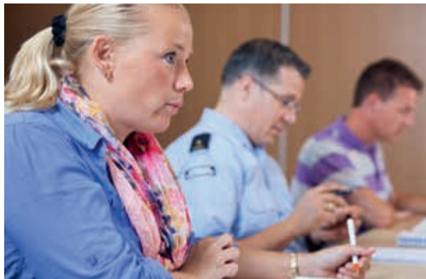
Harmoniseren burger- en militaire rechtspositie

Bij het terugdringen van P&O-regels kan ook gedacht worden aan het harmoniseren van de rechtspositie van burgers en militairen. Daar waar commandanten van operationele eenheden en bedrijven aangeven ruimte te willen voor maatwerk, geeft de directeur van het Dienstencentrum Human Resources juist aan behoefte te hebben aan het wegnemen van onnodige verschillen in rechtspositie. Het Dienstencentrum Human Resources is het aanspreekpunt op het gebied van P&O-regelgeving en -systemen van Defensie.