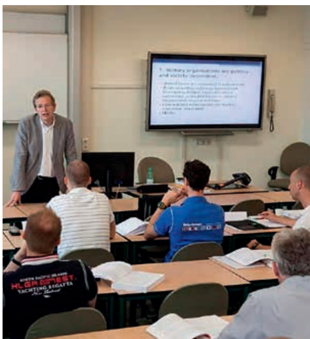
Masteropleiding op de KMA in de avonden