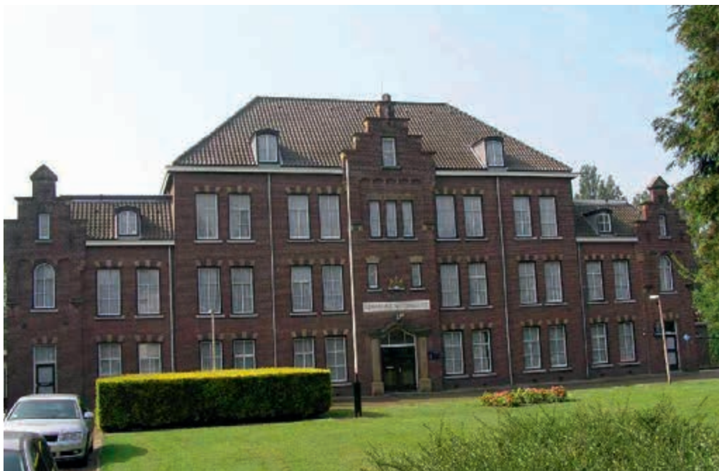
Nieuwbouw vervangt 200 jaar oud KMAR-gebouw in Maastricht

Net als in 2012 is ook in 2013 de verouderde staat van huisvesting diverse keren onder de aandacht gebracht. Zo blijkt de verhuizing van de staf van de afdeling Opleidingen Koninklijke Marine naar de Nieuwe Haven in Den Helder urgent. Het huidige gebouw is slecht geïsoleerd en de overlast van meeuwen op het terrein Buitenveld blijft een terugkomend probleem in het voorjaar. Ook het 200 jaar oude brigadegebouw van de KMAR Brigade Limburg Zuid in Maastricht voldoet niet meer aan de huidige eisen en zal op termijn worden vervuld voor een nieuwe huisvesting.