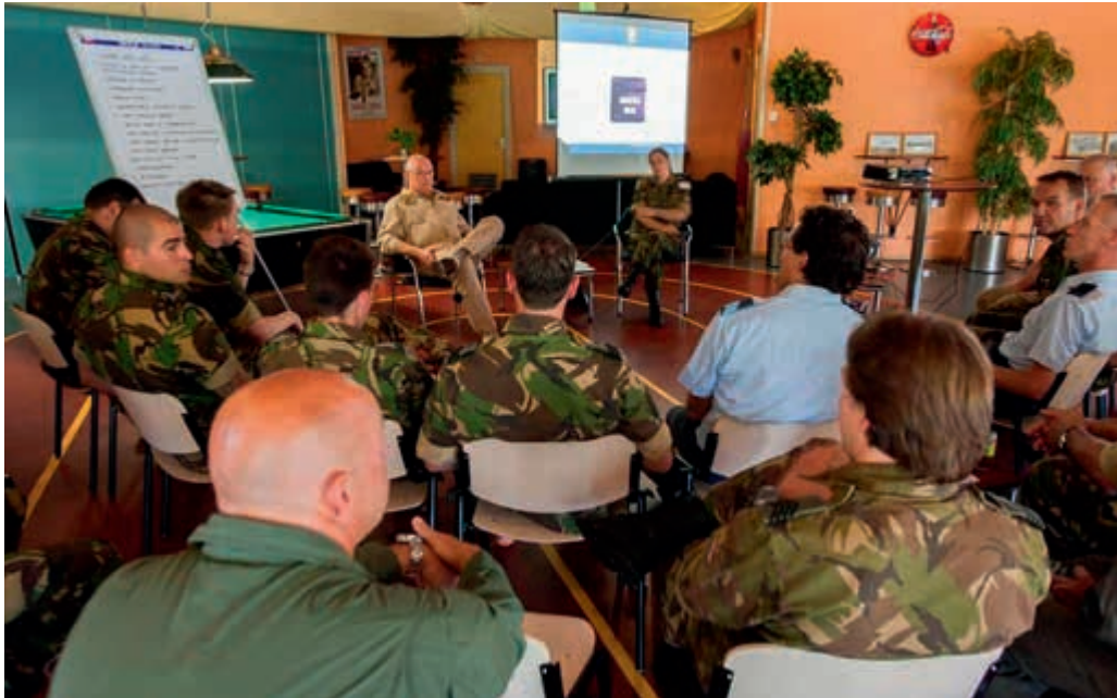
Behoeft aan minder regels