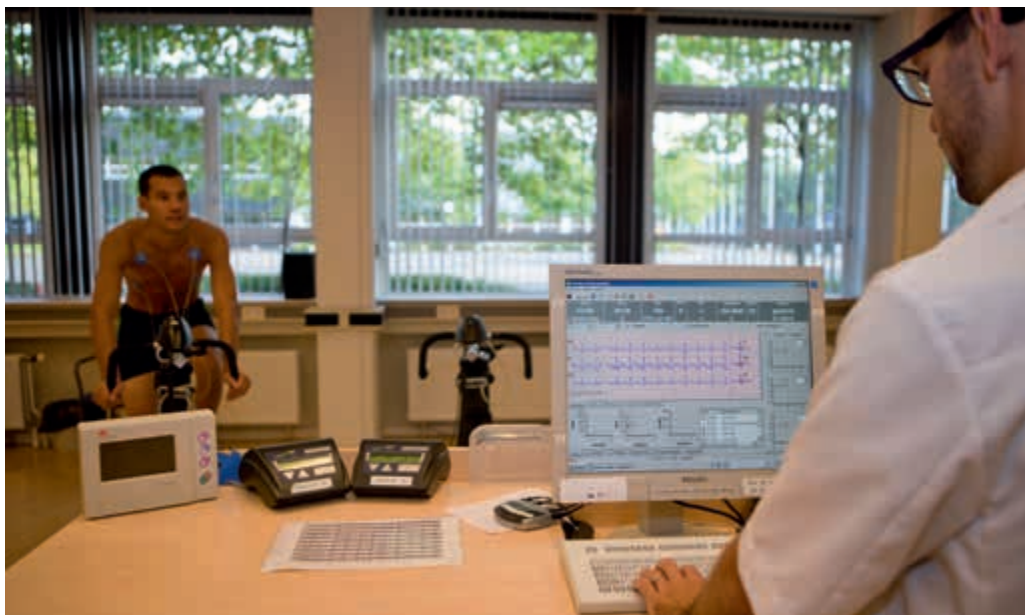
Voorkomen van teleurstelling bij de keuring

Sinds 2011 wordt een deel van de militairen aangesteld vanuit VeVa. Bij de operationele commando's merkt men op dat de eerste ervaringen nog onvoldoende zekerheid bieden om de benodigde instroom te kunnen garanderen.