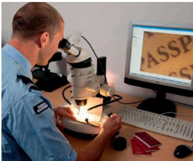
Numerus Fixus soms knellend voor specialisten

"Regels op het personele vlak vertonen een gelijkenis met een ijsberg. Veel regels bevinden zich onder water. Er zijn regels over een persoonlijk ontwikkelplan, opleidingen die plotseling in een geautomatiseerd opleidings-aanvraagstelsel (STOP) moeten. Hoe moet ik als commandant investeren in mijn mensen? Als een vliegmedisch specialist op korte termijn een opleiding moet volgen bij een opleidingsinstituut in het buitenland, dan is de aanvraagprocedure omslachtig en tijdrovend. Het duurt dan veel te lang voordat de betreffende specialist aan de opleiding kan beginnen."