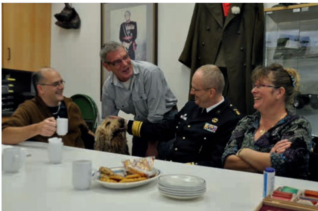
De eerste veteranenhulphond "Teddy" in het veteranenhuis Smilde

Nadat in augustus 2012 voor de eerste maal een hulphond aan een veteraan ter beschikking was gesteld, is in februari tijdens de 'Wegwijsbeurs' te Utrecht opnieuw een hulphond aan zijn nieuwe baas overgedragen. Op 13 december zijn nog eens vijf opgeleide honden tijdens een bijzondere bijeenkomst van de Stichting Hulphond bij 'hun' veteraan ondergebracht. Daarmee komt het totale aantal op zeven. Uit gesprekken met de baasjes van deze honden kwam naar voren dat zij een aanzienlijke verbetering in de kwaliteit van leven ervaren. De aandacht voor de hond geeft hen afleiding en ze durven weer in drukke publieke ruimtes te