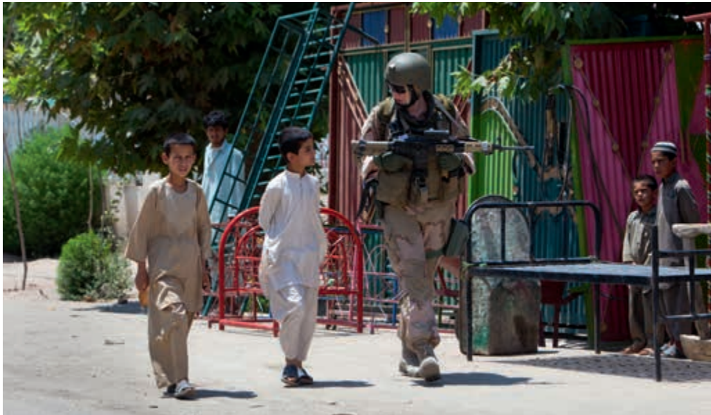
Patrouille in Khanabad, Afghanistan