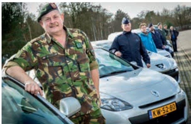
Extra projectcapaciteit door behoudgarantie

Medewerkers van wie de functie komt te vervallen en die voor 1 januari 2016 met leeftijdsontslag gaan, zijn in het SBK 2012 aangemerkt als een bijzondere groep. Dit personeel wordt niet aangewezen als herplaatsingskandidaat en men blijft tot de datum van het leeftijdsontslag in dienst bij Defensie. Meestal is dat op een reguliere functie, maar het kan ook een tijdelijke projectfunctie zijn.