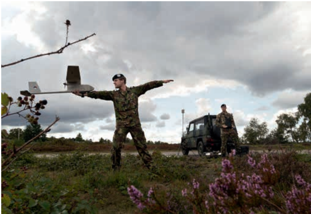
Defensie steunt de politie met onder meer de Raven

Tijdens de ruiming van een zware bom in de IJssel bij Westervoort werd in juli voor het eerst een Raven verkenningstoestel gebruikt. De politie hield met behulp van de onbemande Raven op veilige afstand de omgeving rond de bom in de gaten. De Raven ontdekte enkele personen in de gevarenzone.