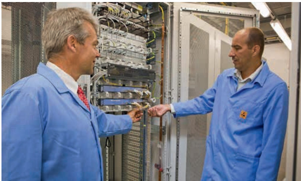
ICT-voorzieningen niet conform de verwachting van het personeel

Voor wat betreft de problematiek in de breedte worden defensiebreed problemen ervaren met de reguliere kantoorautomatisering. De verbinding met MULAN valt met regelmaat uit of komt niet tot stand. Soms duren deze problemen meerdere dagen. E-mail en documenten zijn dan niet toegankelijk, waardoor de dagelijkse routinetaken worden gefrustreerd. Op kazernes leveren de WiFi-voorzieningen niet wat het personeel daarvan verwacht. Met name 's avonds is het regelmatig niet mogelijk verbinding te krijgen door veel vraag en een beperkte capaciteit. Manschappen missen MS Office-faciliteiten in de MULAN-basis accounts waarover ze beschikken. Rapportages in selfservice, zoals functioneringsgesprekken en beoordelingen, zijn daardoor niet leesbaar voor hen.