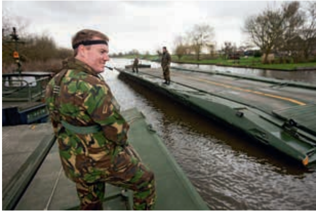
Bruggen slaan bij dilemma's

Vertrouwen in overleg. Zet in op het herstel van vertrouwen tussen overlegpartners. Laat zien dat werkgevers en werknemers in voor Defensie moeilijke tijden er gezamenlijk de schouders onder zetten. Het eerder genoemde rapport van commissie-De Veer biedt hiervoor de handvatten. Gebruik (of herstel) in ieder geval de mogelijkheden voor informeel overleg, bespreek ontwikkelingen en trends in een vroeg(er) stadium. Geef prioriteit aan het verder ontwikkelen en uitwerken van het strategisch personeelsplan en een lange termijnvisie. In het arbeids-