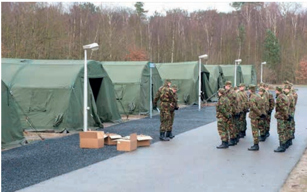
VeVa-cursist is geen militair, dus geen oefentolage voor de instructeur

“Personeel in een missiegebied merkt op dat de regelgeving voor repatriëring bij ziekte en overlijden van relaties niet langer goed aansluit bij de persoonlijke situatie van het uitgezonden personeel. In geval van een ernstige gebeurtenis is de formele mogelijkheid voor repatriëring gebaseerd op de formele status (familied eerste en tweede graad) en niet op de emotionele band die men heeft met betrokkene. De commandant ter plaatse zou een grotere stem moeten hebben bij het bepalen van uitzonderingen op de regel”.