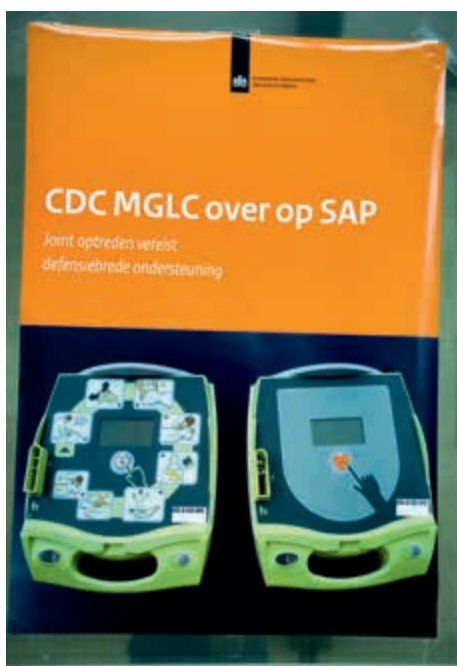
Invoering SAP bij MGLC

Het programma SPEER is in juli 2013 beëindigd en overgedragen aan de lijn. De uitrol van ERP gaat door, waarbij het JIVC en de defensieonderdelen de nog uit te voeren taken oppakken. De implementatie van SAP gebeurt stapsgewijs. In 2013 heeft een verdere uitrol plaatsgevonden. De keuze om over te gaan op het nieuwe systeem wordt breed gedragen. Nut en noodzaak worden onderkend. Er wordt grote inzet getoond om de implementatie goed te laten verlopen. Tijdens werkbezoeken blijft SAP wel een terugkerend onderwerp door de ingrijpende wijziging van de bedrijfsvoering en de extra inspanning die wordt vereist in de transitieperiode.