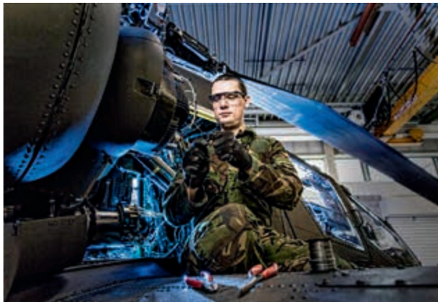
Personeel vraagt om duidelijkheid commandant

P&O-regelgeving die verband houdt met reorganiseren en herplaatsen van personeel ziet vooral toe op het rechtsgelijkheidsbeginsel. Het oogmerk daarbij is een zo eerlijk mogelijke verdeling van de personele gevolgen van de reorganisaties. Bij dit principe van ‘burden sharing’ gaat het algemeen belang voor het specifieke belang van de eenheid. Hoewel bij commandanten begrip bestaat voor deze centrale sturing (en centraal belegde bevoegdheden) bij reorganisaties, zien commandanten met lede ogen aan dat zij een beperkte rol kunnen spelen bij de afweging van de belangen van hun personeel in relatie tot die van de eigen eenheid. Lokaal voorgestelde P&O-oplossingen komen niet tot uitvoering, omdat die niet in lijn zijn met de algemeen geldende spelregels. Zo geeft een commandant bij de luchtmacht aan dat hij geen loopbaanafspraken kan maken met technisch personeel, omdat de BCO-procedure vooral is gericht op de rechtszekerheid van het personeel. Daardoor biedt de procedure onvoldoende ruimte voor maatwerk en een goede kwalitatieve vulling van de organisatie. Commandanten worden geconfronteerd met personeel dat vraagt om duidelijkheid die zij vaak niet kunnen geven. Commandanten zien uit naar het einde van deze ingrijpende reorganisatieperiode om zich samen met hun personeel weer op de kernactiviteiten te richten.