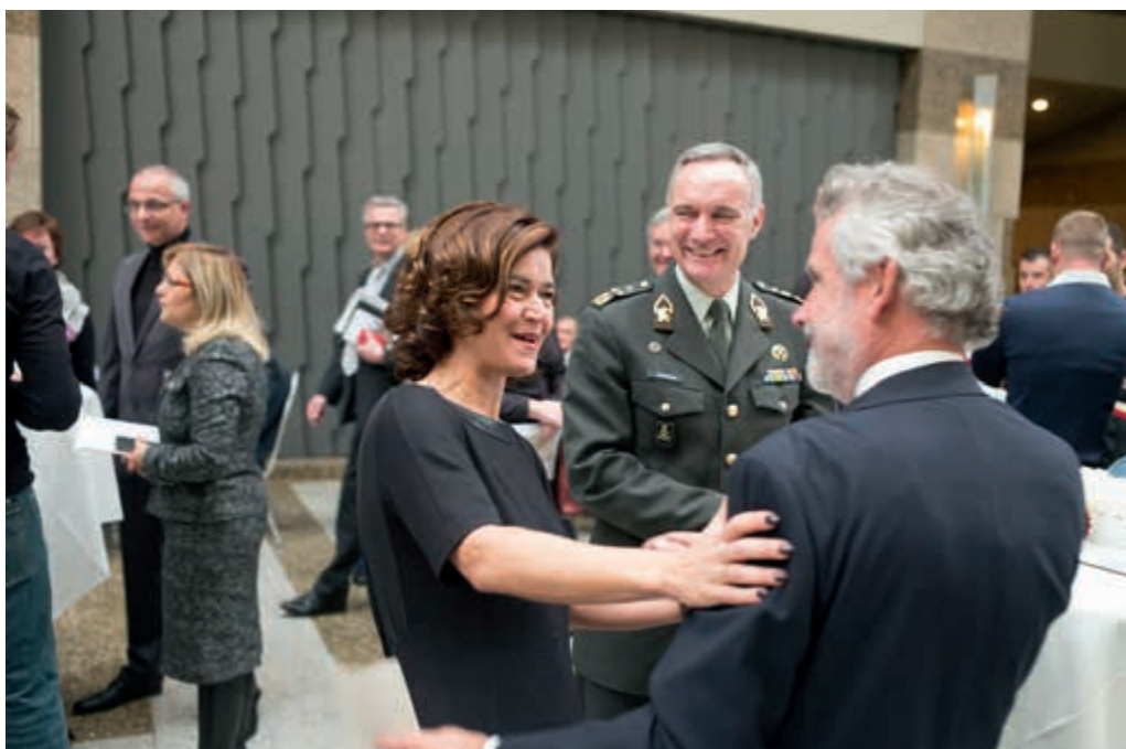
Ontvangst veteranen door de Staten-Generaal

Op 8 en 9 november 2013 hebben de Staten-Generaal invalide veteranen met hun partners uitgenodigd voor een ontmoeting op het Binnenhof. De volksvertegenwoordigers wilden met deze bijeenkomst hun erkenning en waardering laten blijken voor wat deze groep voor ons land heeft betekend. Voor de doelgroep, allen met een militair invaliditeitspensioen, bestond de mogelijkheid om in gesprek te komen met parlementariërs. Ook werden er rondleidingen door het gebouw verzorgd. Ruim 1.400 bezoekers hebben van de uitnodiging gebruik gemaakt. Onder hen bevonden zich ook verscheidene veteranen die aandacht vroegen voor hun persoonlijke omstandigheden. Onze veteranen hebben dit initiatief van de Staten-Generaal bijzonder op prijs gesteld.