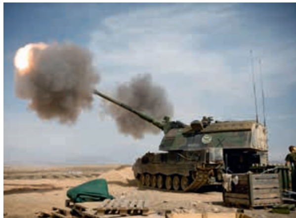
Reservedelen belangrijk voor operationele capaciteit

Inzetbaarheidsproblemen zijn er ook bij het Vuursteuncommando van het Operationeel Ondersteuningscommando Land met betrekking tot de Pantserhouwitzer. Deze problemen zijn eveneens gerelateerd aan de beperkte beschikbaarheid van reservedelen. Voor het mortier 120 mm is het meestal een kwestie van slijtage en te grote speling op bewegende onderdelen. Van dit wapensysteem zijn echter nog voldoende reservestukken voorradig. Hierdoor kan men onderdelen relatief makkelijk vervangen, waardoor slijtage niet direct zal leiden tot een verminderde inzetbaarheid.