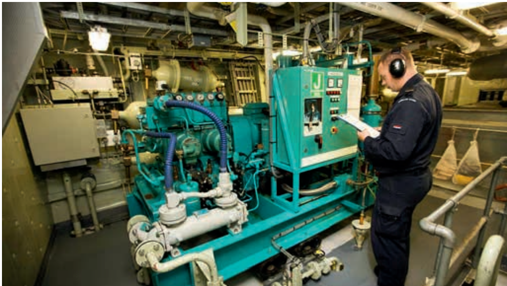
Aandacht voor opleidingsduur van technici