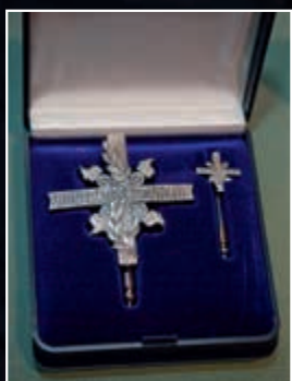
Uitreiking DraagInsigne Gewonden (DIG)