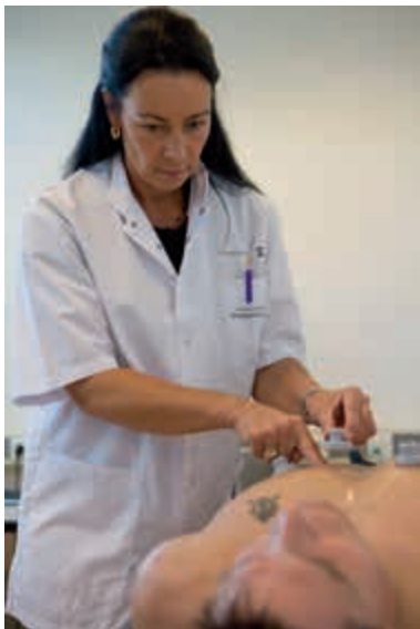
Reorganisatie DGO vertraagd

Door de maatregelen van de Beleidsbrief 2011 is voor de militaire gezondheidszorg een reorganisatie gestart die voorziet in een reductie van circa 30% van het personeelsbestand met behoud van kwaliteit van zorg. De reorganisatie is omvangrijk en complex en ziet niet alleen toe op een forse reductie, maar ook op een fundamentele herschikking van de gezondheidszorgcapaciteit.