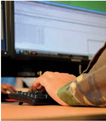
Toegang tot internet beperkt

Ook tijdens een bezoek aan Zr.Ms. De Zeven Provinciën kwam ter sprake dat het personeel in belangrijke mate vanaf functie wordt opgeleid. Voor de functionele begeleiding is de leermeesterfunctie aan boord echter verdwenen, waardoor het overdragen van kennis en ervaring voor een groot deel op de schouders rust van de oudere onderofficieren. Daardoor kunnen zij minder aandacht besteden aan hun rol als chef. De werkdruk wordt door deze categorie als hoog ervaren.