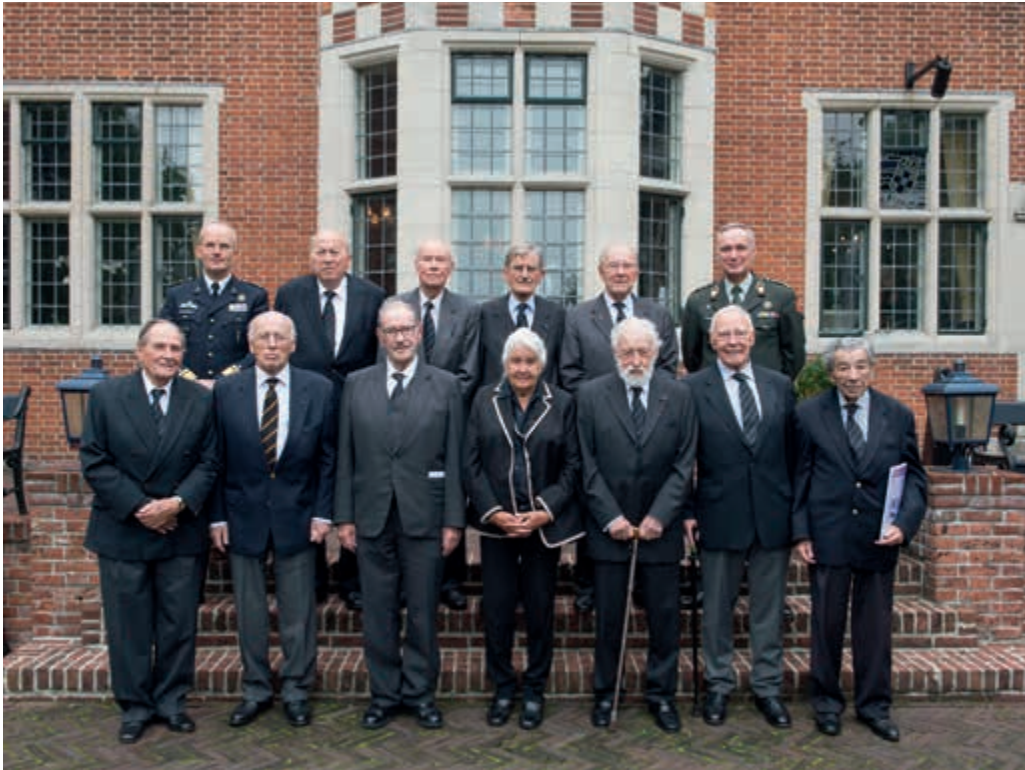
Reinie Engelandvaarders op 25 september 2013 op De Zwaluwenberg

ven vormgeven en daarmee een belangrijke bijdrage leveren aan de opvang van veteranen. Velen van hen hebben de opleiding tot 'nuldlijnshelper' gevolgd. Daarmee dragen zij bij aan het beter toegankelijk maken van het Landelijk Zorgsysteem Veteranen. Ook de geestelijke verzorging en het bedrijfsmaatschappelijk werk van Defensie steunen deze ontmoetingscentra. Wel bestaan zorgen over het voortzettingsvermogen op bestuurlijk en financieel gebied. Vanuit een bestaand samenwerkingsverband werken Defensie en het Veteranenplatform gezamenlijk aan versterking van deze aandachtsgebieden.