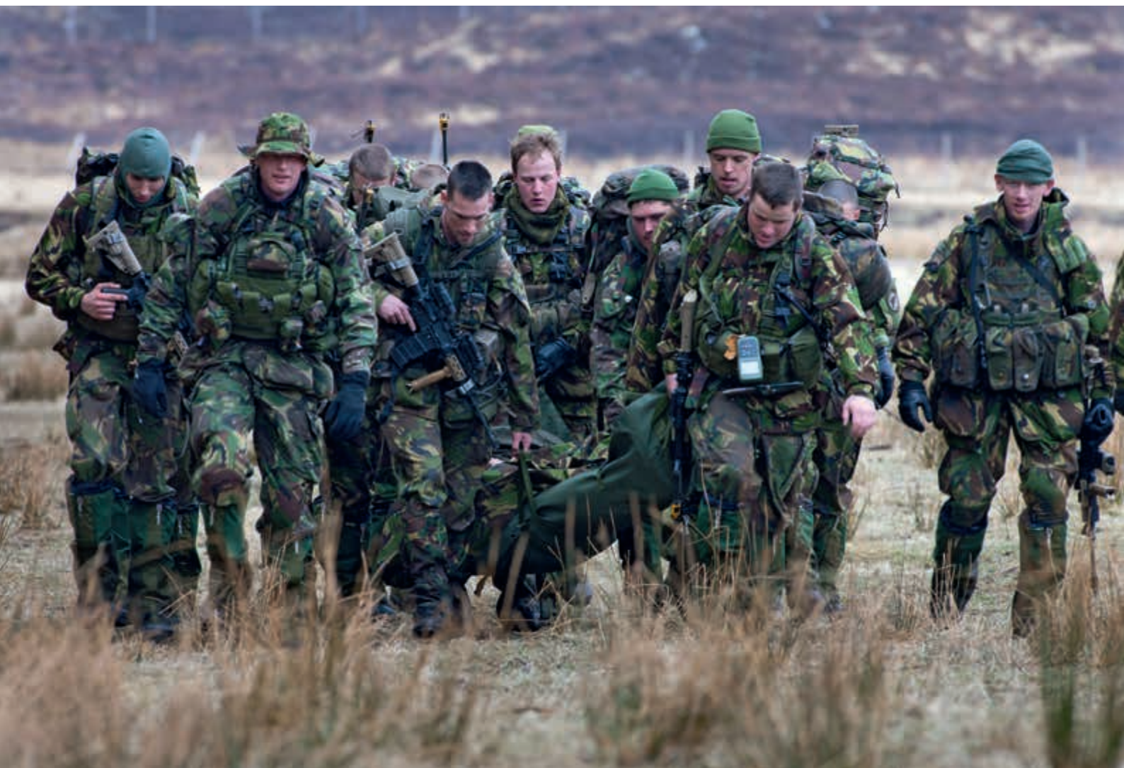
Personeel: de meest kritische succesfactor