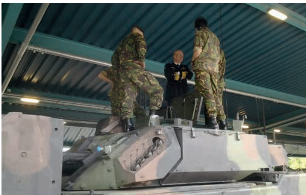
De meerwaarde van medezeggenschap wordt ook erkend bij 45-Painfbat

Uit de werkbezoeken blijkt dat zowel commandanten als personeel van mening zijn dat medezeggenschap een meerwaarde heeft. Het overleg met de commandant verloopt over het algemeen goed. Men acht medezeggenschap vanzelfsprekend en nodig in een tijd waarin Defensie zich snel moet aanpassen aan maatschappelijke veranderingen. Ook de opleidingen voor de medezeggenschap voorzien in de behoefte. Duidelijk is dat het Besluit Medezeggenschap Defensie daarmee een solide basis heeft gekregen.