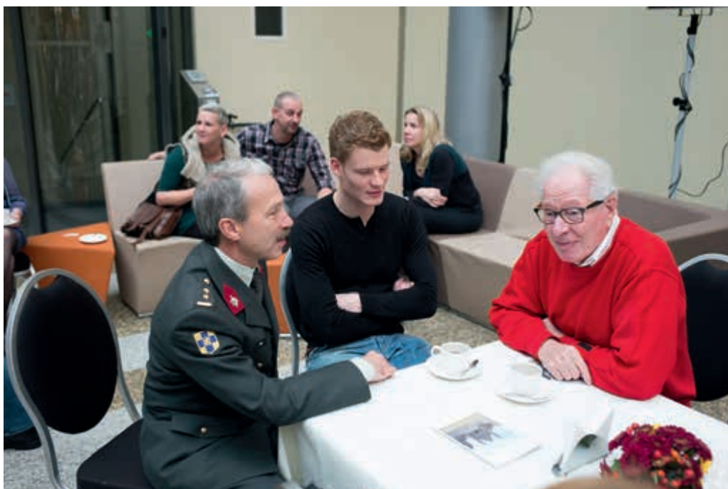
Ook veteranen zoeken bemiddeling

Voor de directe toegang tot een kazerne moet postactief personeel beschikken over een defensiepas. Bezoekers krijgen op vertoon van een geldig legitimatiebewijs of veteranenpas een tijdelijke defensiepas, ook wel aangeduid als 'bezoekerspas'. Veteranen, dienstsachtoffers en postactieven die regelmatig op een defensiecomplex zijn voor sport, verenigingsactiviteiten of medische zorg, komen in aanmerking voor de