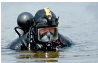
Bijstand door duikers DDG

Defensie is ook in 2013 veelvuldig incidenteel ingezet ter ondersteuning van de civiele autoriteiten bij de handhaving van de openbare orde en veiligheid, of de strafrechtelijke handhaving van de rechtsorde. Daarnaast verleende de krijgsmacht in 2013 hulp in het kader van het openbaar belang, bijvoorbeeld in geval van een ramp of zwaar ongeval, of ernstige vrees voor het ontstaan daarvan. Om de veelvoud aan inzet te illustreren zijn hieronder enkele concrete voorbeelden gegeven.