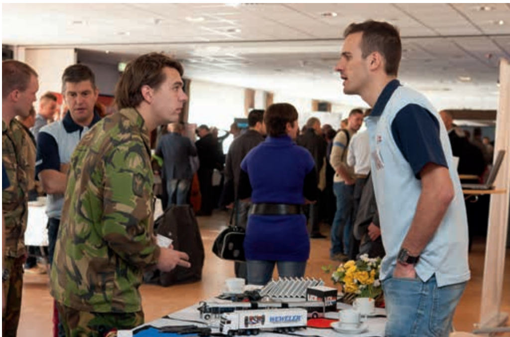
Van werk naar werk

De BBO hanteert het SBK als uitgangspunt om iemand van werk naar werk te bemiddelen. Het volgen van een opleiding of het volgen van een stage is een middel om een goede herplaatsing op de arbeidsmarkt mogelijk te maken. De opleidings- of stagewens van een kandidaat wordt afgezet tegen de kansen op de arbeidsmarkt in die richting. Het effect op de herplaatsingskandidaten is dat men het gevoel heeft dat de BBO erg terughoudend is in het toekennen van opleidingen. Aan een stage hoeft niet per se een baanintentie verbonden te zijn; het is wel een streven. Van de kant van de BBO wordt aangegeven dat herplaatsingskandidaten soms worden overgedragen met een door het defensieonderdeel goedgekeurd opleidingsplan, waarbij de geaccordeerde opleiding de herplaatsingsperiode of het beschikbare budget per herplaatsingskandidaat overschrijdt.