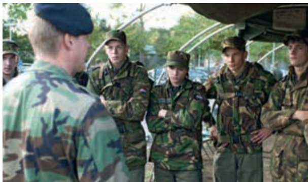
Veel animo voor de VeVa-opleiding

In 2014 blijven de inspanningen gericht op de instroom van nieuw en jong personeel en op de verbetering van het instroomproces. Defensie richt zich in het bijzonder op de werving van schaarse medewerkers,