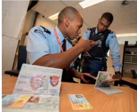
Inzet van KMAR-personeel voor civiele taken

Het overgrote deel van de reguliere inzet van het personeel van de Koninklijke Marechaussee betreft niet-militaire taken. Naast de inzet bij vredesmissies en de politietaken voor Defensie wordt het KMAR-personeel dagelijks ingezet om een breed civiel takenpakket uit te voeren. Hieronder vallen assistentieverlening, bijstand en samenwerking met de regionale politie, rechechtaken, de beveiliging van waardetransporten van De Nederlandsche Bank, de beveiliging van de burgerluchtvaart en de politietaken op civiele luchtvaartterreinen, het mobiel grenstoezicht en objectbeveiliging, ceremoniële diensten en persoonsbeveiliging voor het Koninklijk Huis, buitenlandse staatshoofden en politici.