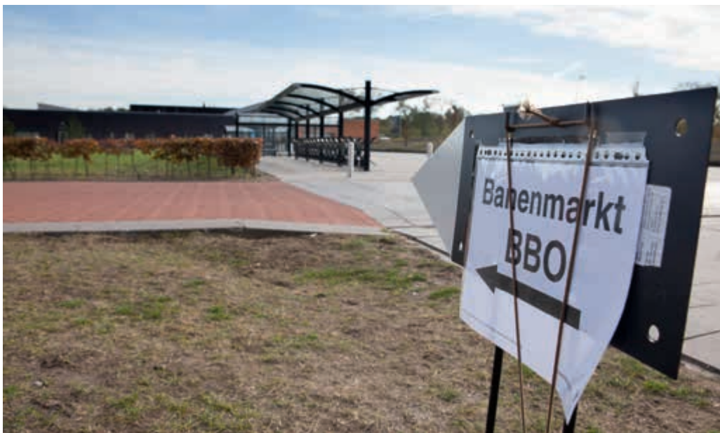
“Kansrijk netwerken”

De Begeleidings- en Bemiddelingsorganisatie (BBO) ondersteunt de medewerker en de defensieorganisatie in de zoektocht naar werk buiten Defensie. De begeleiding richt zich op iedereen die, door een reorganisatie of op basis van reguliere uitstroom, zijn/haar loopbaan buiten Defensie voortzet. Het gaat met name om de uitstroom van medewerkers op grond van het Sociaal Beleidskader Defensie (zowel SBK-2004 als SBK-2012) en FPS. De BBO werkt hierbij nauw samen met de P&O-organisatie van de defensieonderdelen en een externe bemiddelingspartner.