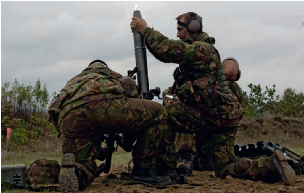
Rendement opleidingen kan beter

"Loopbaantrajecten voor de doorstroom van technisch personeel zijn er niet. Zo wordt de korporaalhersteller nu weer infanterist (mortierist), terwijl er toch voor zo'n 250.000 euro in hem is geïnvesteerd om hem op te leiden tot technicus. Dit ontbrekende traject voor doorstroom is funest voor de KL-organisatie. Voor deze goedopgeleide functionarissen wil ik met P&O voor langere tijd afspraken kunnen maken."