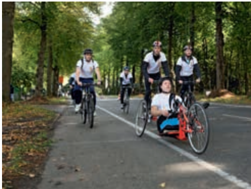
Militairen sporten samen met fysiek gewonde collega's

In 2011 heeft de Minister van Defensie aangegeven zich te beraden over het vormgeven van een blijk van erkenning voor de militairen die betrokken zijn geweest bij de beëindiging van de gijzelingsacties bij De Punt en Bovensmilde in 1977. Bij de behandeling van de Veteranennota 2013 heeft de minister de Tweede Kamer geïnformeerd over het besluit de veteranenstatus toe te kennen aan deze militairen. Op 10 februari 2014 zijn de Staten-Generaal hierover per brief geïnformeerd. De minister heeft daarin ook aangegeven dat het besluit in goed overleg met alle betrokken partijen is genomen.