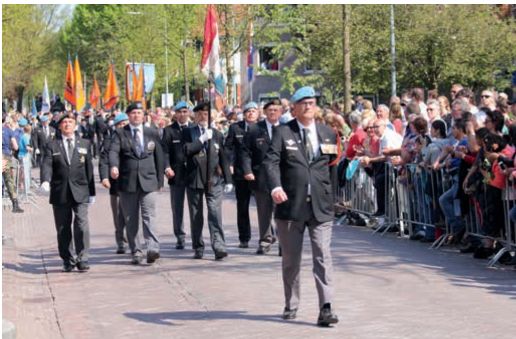
Het veteranenlandschap is volop in beweging.

Naast de advies- en bemiddelingsrol is ook de rol van Inspecteur der Veteranen zeer de moeite waard. Soms op de voorgrond, maar meestal op de achtergrond, mag ik een adviserende, coördinerende en stimulerende rol vervullen. Het is daarbij goed te constateren dat in de afgelopen jaren al veel is bereikt door en voor veteranen. Dat betreft niet alleen de erkenning en waardering, maar ook de zorg. Daarmee zijn we er echter nog niet. Het veteranenlandschap is nog volop in beweging. De samenstelling van de veteranengemeenschap verandert doordat veel oudere veteranen uit de Tweede Wereldoorlog en