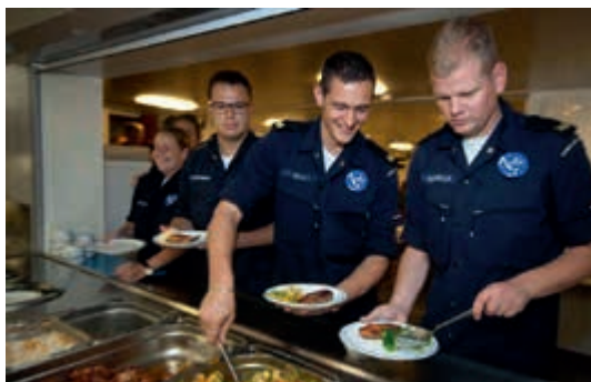
Goede voorzieningen bij inzet

De voorzieningen voor het uitgezonden personeel variëren per missiegebied van goed tot uitstekend. Zaken als voeding, accommodatie en communicatiemogelijkheden met het thuisfront worden door het personeel gewaardeerd. Ook in de uitrusting is goed voorzien. Wel hecht met name de jongere generatie