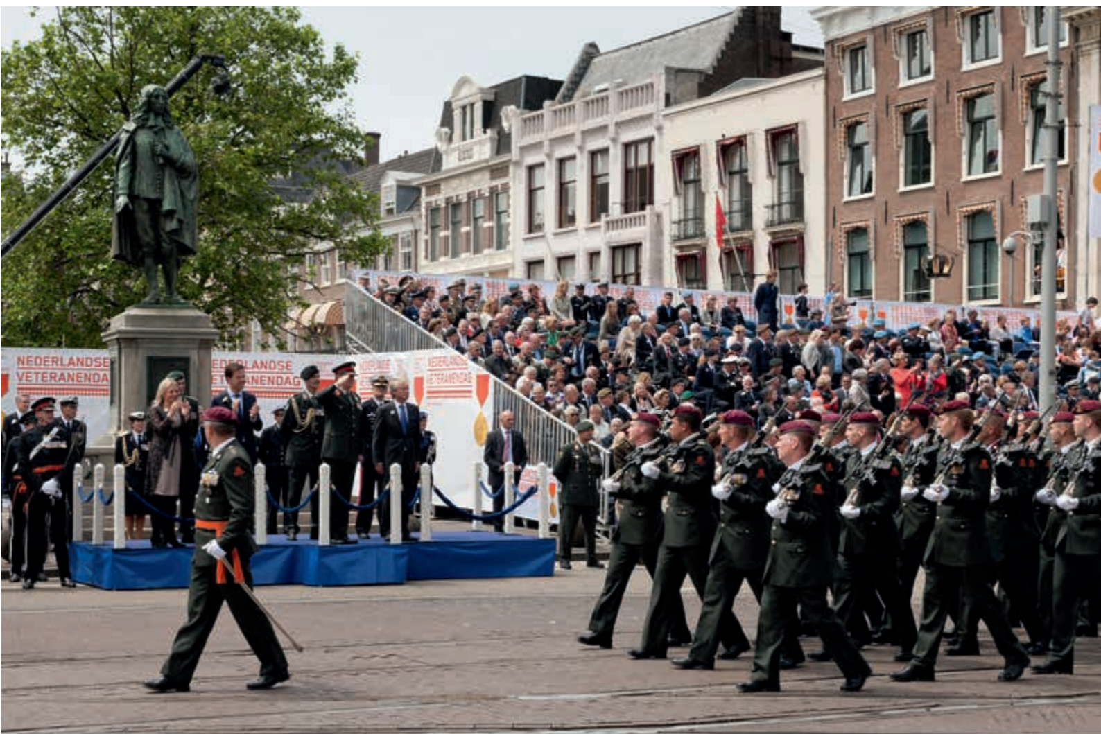
Nederlandse Veteranendag 29 juni 2013 te Den Haag