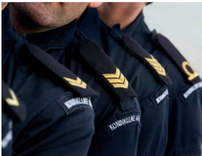
Perspectief op doorstroom blijft belangrijk

Veel militairen vinden dat de mogelijkheden voor doorstroom (te) beperkt zijn. Het vacaturesysteem en de sollicitatiemogelijkheden zijn vooral voor de manschappen beperkend, lastig en frustrerend. Zo wijst het jonge kader van het Vuursteuncommando (artillerie) op de beperkte doorstroommogelijkheden voor korporaals naar de Koninklijke Militaire School. Men pleit voor een grotere doorstroom in plaats van instroom. Er is bij de jongere kaderleden en commandanten