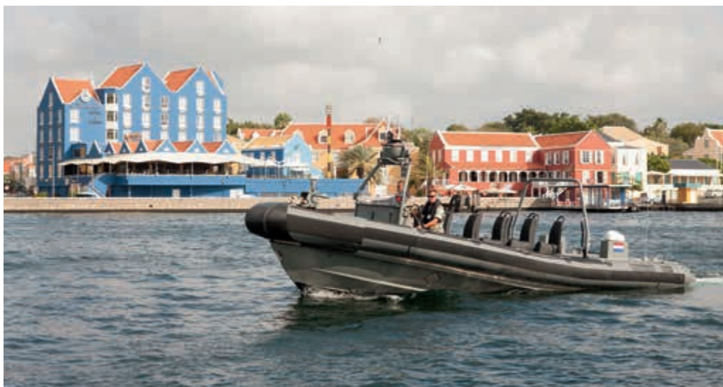
Patrouille in Caribische wateren

De Commandant der Zeemacht in het Caribisch gebied (CZMCARIB) is belast met de externe verdediging van het Koninkrijk der Nederlanden in het Caribisch gebied, de inzet van eenheden voor militaire bijstand, de ondersteuning van de Kustwacht Caribisch Gebied en handhaving van de internationale rechtsorde. Vanuit deze rol voert CZMCARIB het commando over Task Group 4.4 binnen de Joint Interagency Task Force South . Ter ondersteuning van CZMCARIB worden schepen van het Commando Zeestrijdkrachten en helikopters van het Defensie Helikoptercommando ingezet. Zr.Ms. Friesland, Zr.Ms. Holland en Zr.Ms. Amsterdam, die achtereenvolgens in 2013 als stationsschip in het Caribisch gebied hebben geopereerd, hebben meerdere smokkel- en drugstransporten onderschept en de smokkelaars en hun contrabande opgebracht. Het ondersteuningsvaartuig Zr.Ms. Pelikaan hielp de bevolking van Saba aan extra water. Het eiland kampte met een ernstig drinkwatertekort als gevolg van een lange periode van droogte en een defecte waterfabriek. Op oudejaarsdag ondersteunde CZMCARIB de Curaçaose autoriteiten bij de beveiliging van de politiepост van Barber. Daarbij stelde de Compagnie in de West van het Commando Landstrijdkrachten prikkeldraad, zogeheten 'concertina's', ter beschikking. Tevens werden hiervoor op basis van de regeling met het land Curaçao wapens en munitie beschikbaar gesteld aan het Vrijwilligerskorps Curaçao.