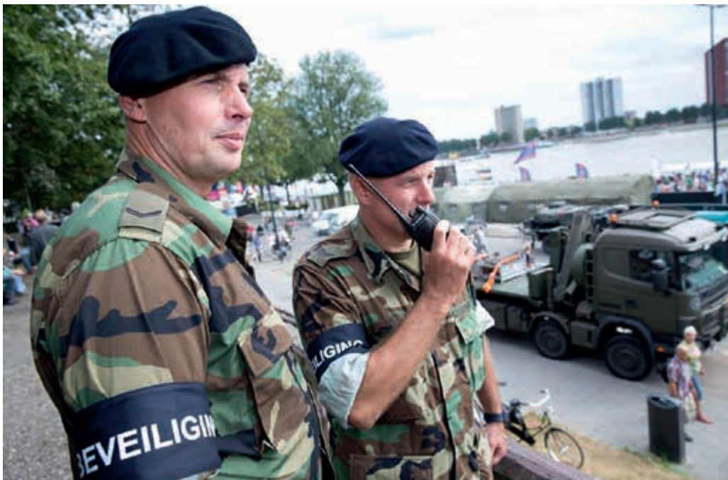
Beveiliging door reservisten van het Korps Mariniers

Inmiddels is direct onder de Commandant der Strijdkrachten een projectbureau Reservisten opgericht. Het bureau, dat bestaat uit reservisten en beroepsmilitairen, moet een impuls geven aan de uitwerking van het toekomstig reservistenbeleid. Om extra aandacht te besteden aan reservisten, heb ik ook aan mijn eigen staf een reservist als stafofficier toegevoegd.