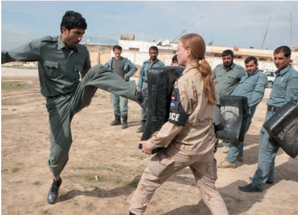
Vrouwelijke militairen zijn een belangrijke succesfactor

in deeltijd worden gevolgd. Verder maken deeltijdwerken en de mogelijkheden van het Nieuwe Werken, bijvoorbeeld door gebruik van een telestick , het eenvoudiger om arbeid, studie en zorg te combineren.