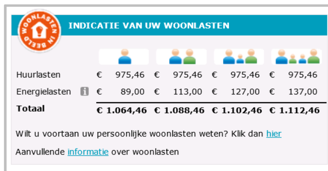
figuur 8-1 Voorbeeld van ‘woonlasten in beeld’ van Woningstichting Etten-Leur