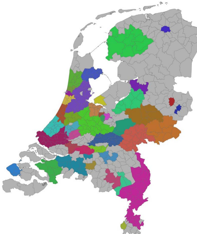
figuur 2-1 Woonruimteverdelingssystemen van samenwerkende corporaties

In figuur 2-1 zijn de huidige woonruimteverdelingssystemen van samenwerkende corporaties afgebeeld. In een aantal grote gemeenten (Almere, Groningen, Maastricht, Tilburg) wordt alleen op lokale schaal samengewerkt, maar de meeste systemen hebben een regionaal werkingsgebied, variërend van enkele gemeenten tot bijna een hele provincie.