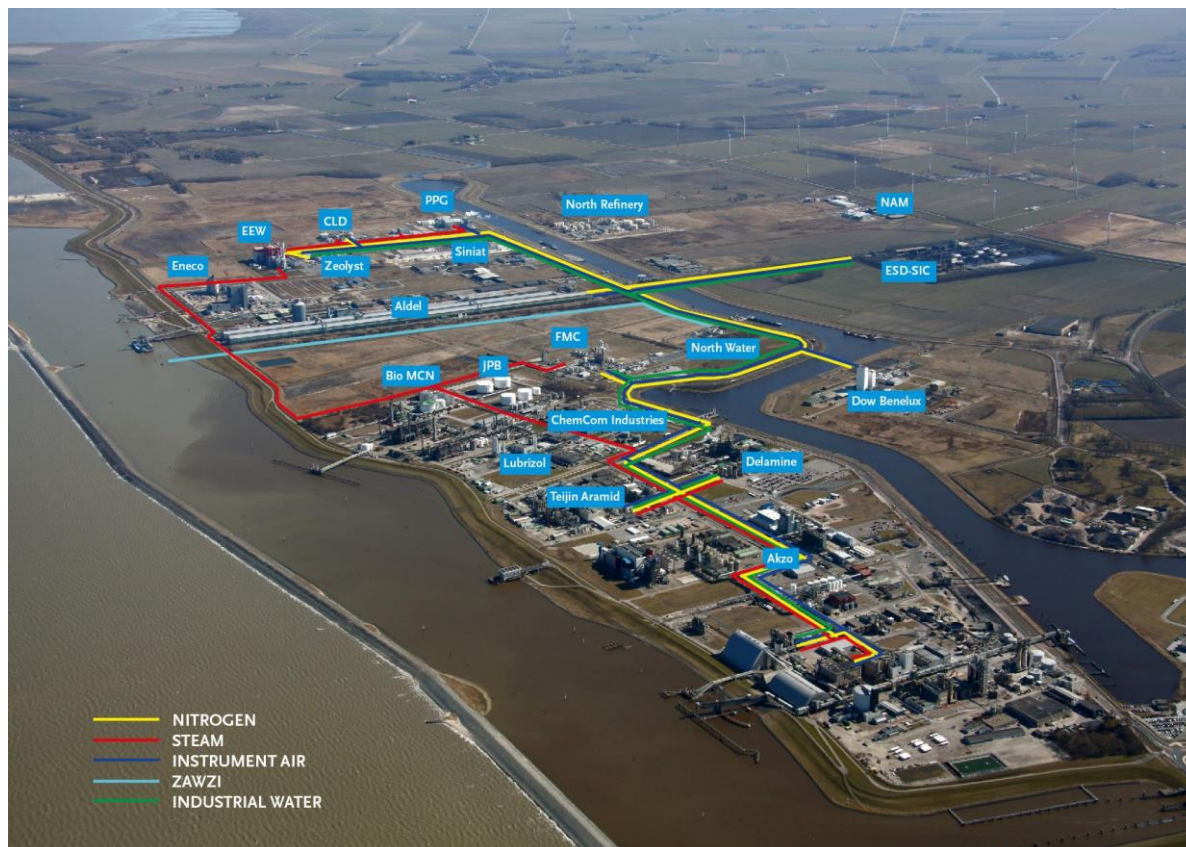
Figuur 1: Het chemiecluster Eemsdelta

Het chemiecluster Eemsdelta onderscheidt zich door een sterke focus op basischemie uitgaande van aardgas, zout en lokale elektriciteitsproductie. Producten zijn onder meer chloorhoudende bouwstenen voor de chemische industrie, industriële vezels, methanol en siliciumcarbide. Het chemiecluster Eemsdelta is goed voor zo'n vijftien procent van de totale Nederlandse chemieproductie. 2 Daarmee is het een belangrijke pijler van de noordelijke economie en de Eemsdelta in het bijzonder.