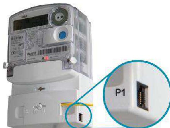
Afbeelding 2: voorbeeld consumentenpoort (P1-aansluiting) voor directe uitleesmogelijkheden

Consumenten kunnen ook zelf en op elk gewenst moment de actuele meterstanden uit de slimme meter halen. De slimme meter beschikt daartoe over een aparte uitgang: de P1-poort (zie afbeelding 2). De frequentie waarmee meetdata via deze P1-poort wordt verstuurd, is elke 10 seconden voor elektriciteit en elk uur voor gas. Vanwege deze hoge frequentie voor met name elektriciteit wordt de feedback via deze consumentenpoort ook wel directe of (near) real-time feedback genoemd.